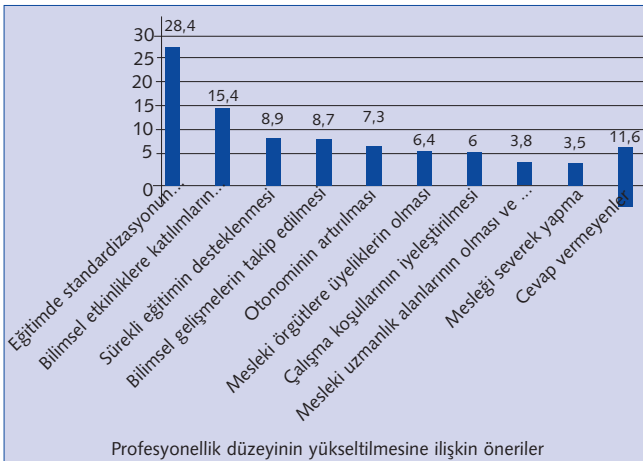
Şekil 2. Öğrencilerin profesyonellik düzeyinin yükseltilmesine ilişkin önerilerin dağılımı *Birden fazla cevap verilmiştir.

Öğrencilerin profesyonellik düzeyinin yükseltilmesine ilişkin önerileri açık uçlu bir soru ile elde edilmiş olup, gelen yanıtlar dokuz alt başlık altında gruplandırılmıştır. Öğrenciler, eğitimin önemi vurgulayarak %28.4 oranında eğitimde standardizasyonun sağlanması, uygulama saatlerinin artırılması önerisinde bulunmuşlardır. Bilimsel etkinliklere katılımın desteklenmesi % 15.4 iken, sürekli eğitimin desteklenmesi (%8.9) ve bilimsel gelişmelerin takip edilmesi (%8.7) önerilerinin oranları birbirine oldukça yakındır. Öğrencilerin bu konuda diğer önerileri sırasıyla otonominin artırılması (%7.3), mesleki örgütlere üyeliklerin olması (%6.4), çalışma koşullarının iyileştirilmesi (%6.0), mesleki uzmanlık alanlarının olması ve yasal olarak kabul edilmesi (%3.8) ve mesleğini severek yapma (%3.5) olmuştur (Şekil 2).