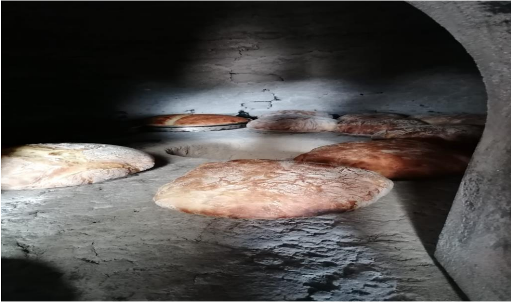
Grsel 6: Fırında piřen ev ekmekleri