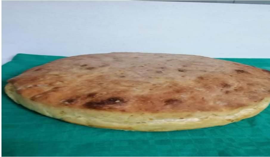
Görsel 3: Patatesli köy ekmeđi