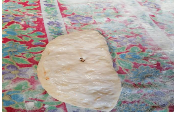
Grsel 5: Niřan (iz) konulmuř hamur iři