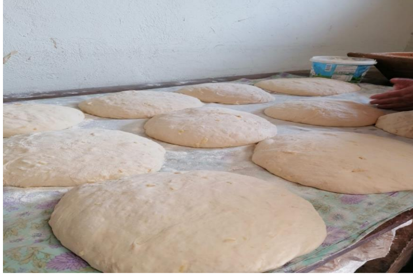
Görsel 9: Mayalanması için bekletilen ekmeđ hamurları