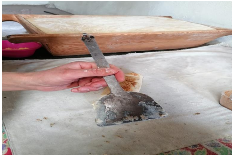
Görsel 10: Hamur kesiminde kullanılan elizan/elizyan