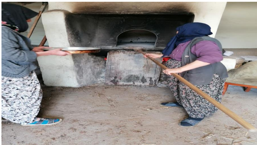
Grsel 7: Ekmek piřiren kadımlar