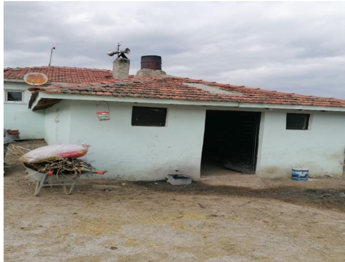
Görsel 4: Köy fırını