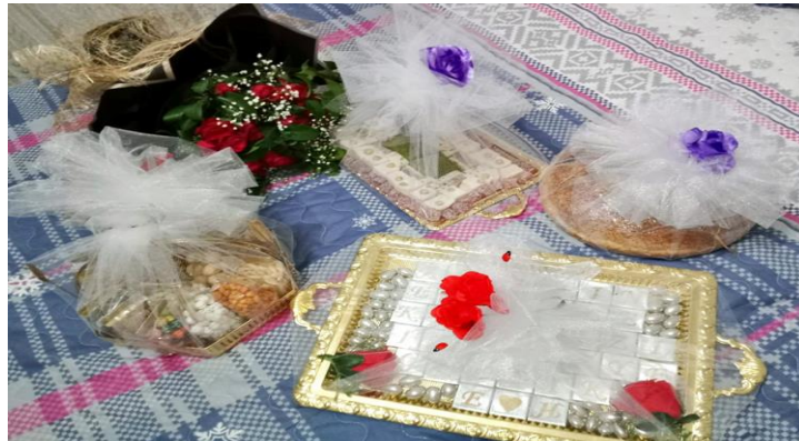
Görsel 1: İsteme merasiminde getirilen çiçek, çikolata ve bütün bir ekmek.