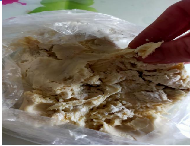
Görsel 2: Ekmek yapımında kullanılan ekşi maya.