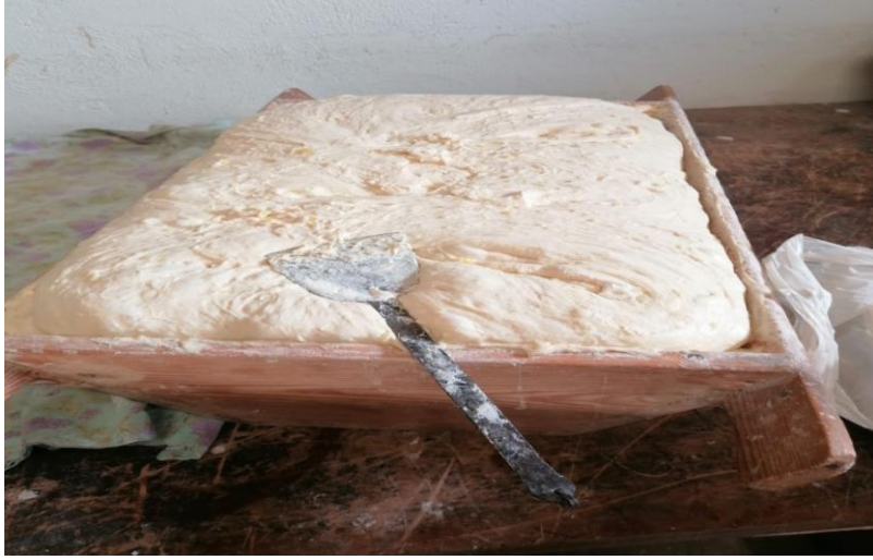
Görsel 11: Teknede bekletilen hamur