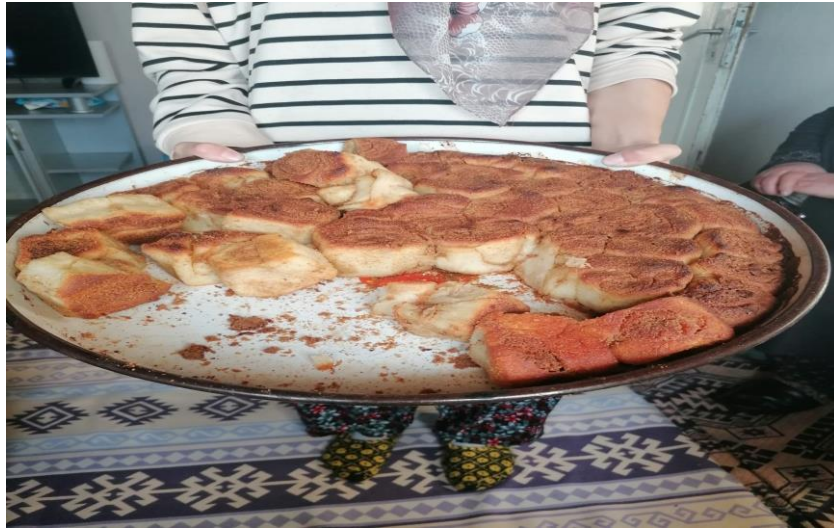
Görsel 13: Köy fırınında yapılmıř olan hařhařlı lokumlar