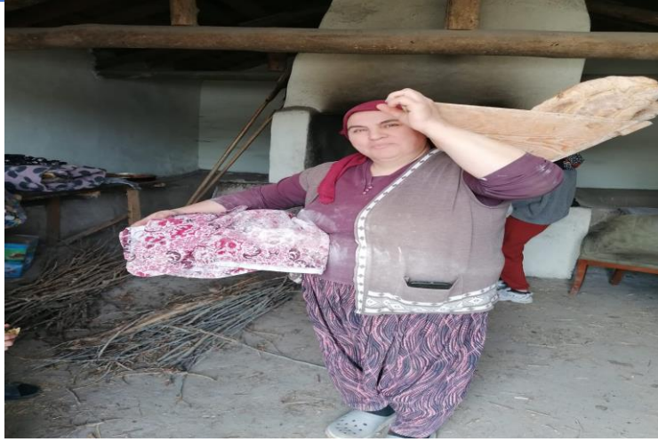
Görsel 8: Piřirdiđi ekmeđi tekne ile evine götüren kadın