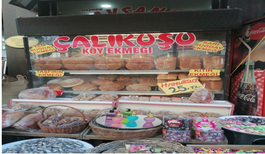
Görsel 12: Ev/köy ekmeđi satılan iřletme