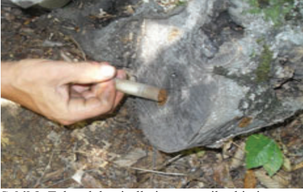
Şekil 9. Tohumluk misellerin şırınga ile ekimi