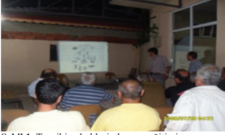
Şekil 1. Teşvikiye beldesinde gece eğitimi