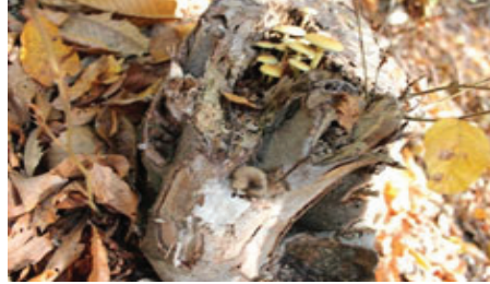
Şekil 14. Hypoloma fasciculare