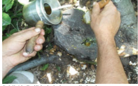
Şekil 10. Deliklerin balmumu ile kaplanması