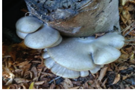
Şekil 12. Dip kütükte organik kayın mantarı