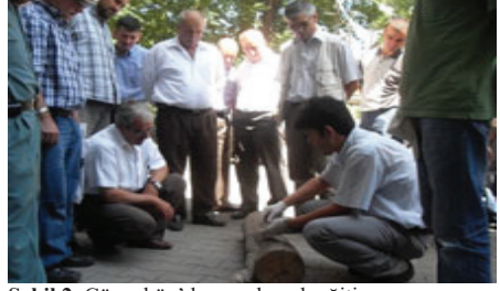
Şekil 2. Güneyköy'de uygulamalı eğitim