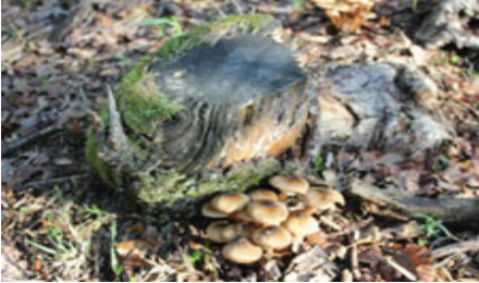
Şekil 13. Armillaria mella