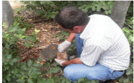
Şekil 8. P.O tohumluk misellerin elle ekimi