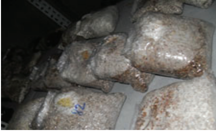
Şekil 5. Ana kültürlerin gelişimi