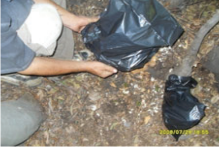
Şekil 11. Dip kütükerin plastikle örtülmesi