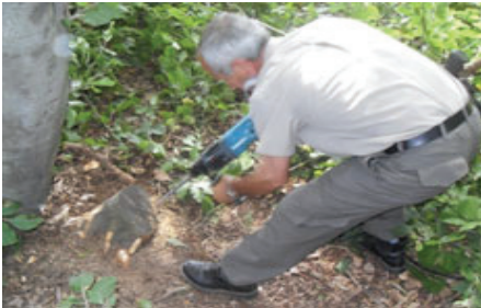
Şekil 7. Dip kütüklerin delinmesi