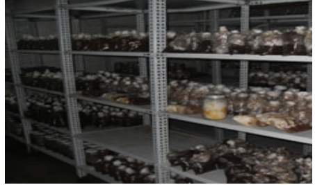
Şekil 6. Organik Meşe talaşında P.O tohumluk misellerinin gelişimi