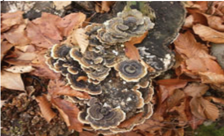
Şekil 15. Trametes versicolor