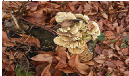
Şekil 16. Bjerkandera adusta