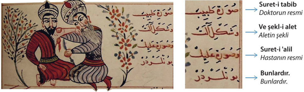
Görsel 11. Sabuncuoğlu Şerefeddin, 1465, “Cerrâhiyyetü'l-Hâniyye”, ikinci babun, kırk sekizinci faslı, tümör çıkarma tedavisi (Uzel, 2020, s. 273)

olarak betimlerken görsel 11'de verilen minyatür metnin içeriğini görsel olarak detaylıca sunmaktadır (Uzel, 2020, s. 273).