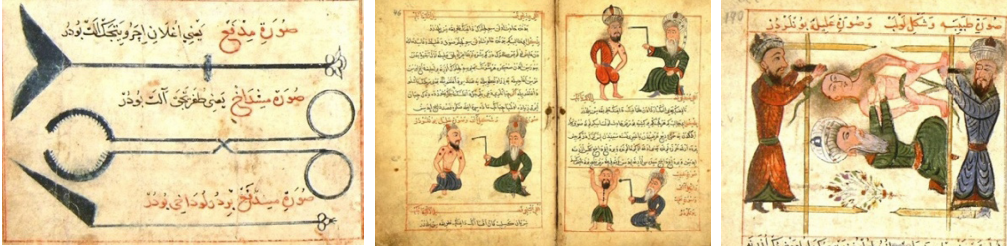
Görsel 10. Sabuncuoğlu Şerefeddin, 1465, “Cerrâhiyyetü'l-Hâniyye”, alet, dağlama ve bel çıkığı tedavisi (Sabuncuoğlu Tıp ve Cerrahi Tarihi Müzesi, t.y.)

Türk-Osmanlı minyatürleri çoğunlukla el yazmaları içinde yer alır ve metni destekleyici bir görsel anlatım sunar. Görseller, metnin anlaşılmasını kolaylaştıran bir araç olarak konumlanır. Türk-Osmanlı yazmaları, sadece metin içeriğiyle değil, aynı zamanda minyatürler aracılığıyla görsel bilgi aktarımını destekleyen sanatsal, eğitici ve belge niteliği taşıyan eserler olarak öne çıkmaktadır.