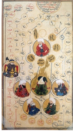
Görsel 1. Hz. Muhammed, babası ve halifeler, Silsilênâme (And, 2014, s. 171).