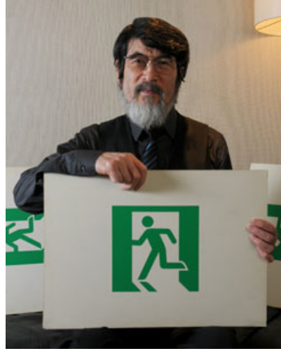
Görsel 2. Yukio Ota ve koşan adam tabelası "exit (çıkış)" piktogramının (Lights, 2012).

Minyatürlerde perspektiften arınmış, gölgesiz, hacimsiz ve olabildiğince minimalist bir anlatım benimsenmiştir. Bu yaklaşım, yalnızca geleneksel bir unsur olmanın ötesinde, bilinçli bir grafik anlatım mirasının sonucudur. Farklı coğrafya ve zamanlarda üretilmiş Mezopotamya rölyefleri, Eski Mısır hiyeroglifleri, Antik Yunan vazo resimleri, Roma duvar resimleri ve mozaikleri, Bizans ikonaları ve duvar resimleri, Orta Çağ Avrupa el yazmalarındaki illüstrasyonlar, freskler, mozaikler ile Çin ve Japon parşömen resimleri gibi örnekler, özgün biçimsel özellikler barındırsa da, tümünde bilginin aktarımına yönelik gelişmiş benzer teknik anlatımlar görmek mümkündür. Geçmişteki bu örneklerin yanı sıra, görsel 2'deki, 1970'lerin sonunda Japon hükümetinin düzenlediği yarışmanın kazananı Yukio Ota'nın tasarladığı "exit (çıkış)" piktogramının (Turner, 2010) bugün uluslararası bir standart haline gelmesi, minyatürlerdeki sadeleştirilmiş, stilize ve yarı profilde ( üç çeyrek açıyla ) anlatımın rastlantısal bir tercih olmadığını kanıtlar niteliktedir.