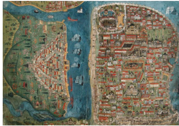
Görsel 9. İstanbul, "Beyân-ı Menâzil-i Sefer-i Irâkeyn-i Sultan Süleyman Han" (Çalışkan, 2020).

Minyatürlerde hiyerarşik mekânsal organizasyon sayesinde, en önemli mekânlar en büyük veya en merkezi olacak şekilde resmedilmiştir. Örneğin, bir şehir minyatüründe cami en büyük ölçekte tasvir edilirken, halkın yaşadığı yerler daha küçük ölçeklendirilmiş olabilir. Bu yaklaşım, modern haritalarda veri yoğunluğuna göre yapılan ölçeklendirme yöntemleriyle benzerlik göstermektedir. Atasoy, görsel 9'da yer alan, Beyân-ı Menâzil Sefer-i Irakeyn minyatürlerini şu şekilde açıklamaktadır: "Nasuh'un önemli olanı öne çıkarma tavrı, İstanbul tasvirinin genel görünümünde belirgin şekilde görülmektedir. Sanatçı, şehrin en önemli yapılarını ve özelliklerini ele almış, bunların aralarındaki evleri ise temsilcileriyle göstermeyi tercih etmiştir (Atasoy, 2015, s. 10)".