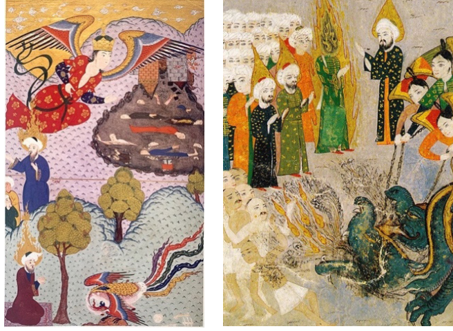
Görsel 5. Zübdetü't-Tevârih (And, 2014, s. 364).