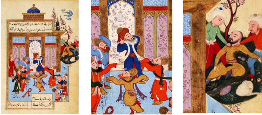
Görsel 7. Mevlânâ'nın hatıralarının ve menkıbelerinin toplandığı Sevâkıb-ı Menâkıb (Tasvir sanatları, 2019)

Osmanlı minyatürlerinde zaman, doğrusal bir süreç yerine, eşzamanlı ve çok katmanlı bir yapı olarak ele alınır; farklı zaman dilimlerine ait sahneler aynı kompozisyonda bir arada gösterilebilir. Örneğin, Sevâkıb-ı Menâkıb isimli yazmanın görsel 7'deki minyatüründe mevlânânın semâsı ve boğulan Sultan Rükneddin zamandaş olarak görselleştirilmiştir (And, 2014, s. 108). Bu teknik, modern bilgigrafilere kullanılan “zaman çizelgesi ( timeline )” yöntemine benzetilebilir. Benzer şekilde, bir padişahın savaşa giderken, savaşırken ve zaferini kutlarken aynı sahnede üç farklı noktada görünmesi mümkündür ki bu da “çoklu zaman anlatımı ( multiple exposure )” tekniğini andırır. Şehir tasvirleri ve sefer güzergâhlarında da benzer bir yaklaşım görülür; Matrakçı Nasuh'un şehir betimlemeleri, Osmanlı ordusunun sefer boyunca geçtiği konaklama noktalarını tek bir görselde birleştirerek zamanın akışını görselleştiren bir sistem oluşturur.