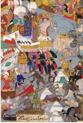
Görsel 8. Haçova Savaşı, Nâdirî, Dîvânı , 1605 civarları (Kundak, t.y.).

Türk-Osmanlı minyatürlerinde, bilginin önemine göre hiyerarşik sıralamayla sunulması ve buna uygun görsel dağılımın oluşturulması, günümüz bilgigrafi tasarımıyla benzerlik göstermektedir. Süslemenin ötesinde, temel amacı bilginin aktarımı olan minyatürlerde hiyerarşik tasarım, nakkaşların sıkça başvurduğu bir tekniktir. Bunun belirgin örneklerinden biri, görsel 8'deki 17. yüzyıl Nâdirî'nin Dîvânı eserinde yer alan Haçova Savaşı minyatürüdür. Bu çalışmada figürler ve mekân ters perspektifle ele alınmış, görsel elemanlar önde küçük, arkaya doğru giderek büyütülerek gösterilmiştir. Figürler arasındaki belirgin orantısızlık, çadırlar ve mimari unsurların figürlere oranla küçük kalması dikkat çekicidir. Benzer örneklerde olduğu gibi, bu minyatürde de hiyerarşik ölçkleme ile padişah ve ileri gelen figürler büyük tasvir edilerek kudret ve önem vurgulanmıştır.