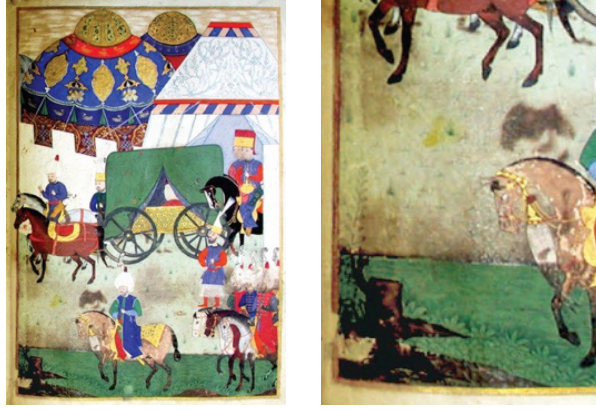
Görsel 4. Kanûnî'nin gizlenen naaşının yola çıkarılması, Nüzhetü'l-ahbâr, 1569, (Toraman, 2018, s. 11).

Kanûnî'nin (1520-1566) son döneminden II. Selim'in (1566-1574) tahta çıkışı ve 1566 Zigetvar Seferi'ne kadar geçen süreç, 1569 tarihli Nüzhet-i Esrârü'l-Ahyâr der-Ahbâr-ı Sefer-i Sigetvar adlı eserde, sürecin tanığı olan Nakkaş Osman tarafından resmedildiğı düşünölen sahnelerle aktarılmıştır. Toraman'ın bu eserdeki sembolik dil üzerine yaptığı çalışmada, ikonografik imgelerin çözümlemeleri dikkat çekicidir. Bunlardan biri, başka eserlerde de karşılaşılan “sürgün vermiş kesik ağaç gövdesi” tasviridir.