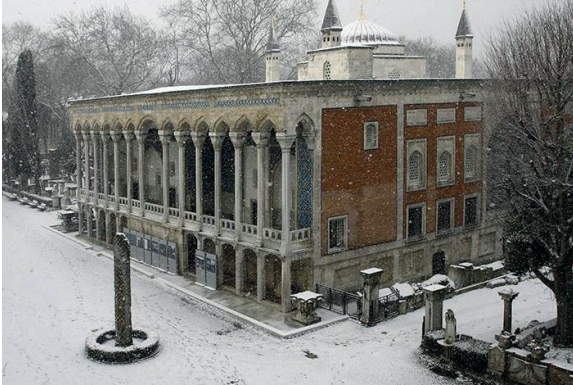
Ek 1. Çinili Köşk