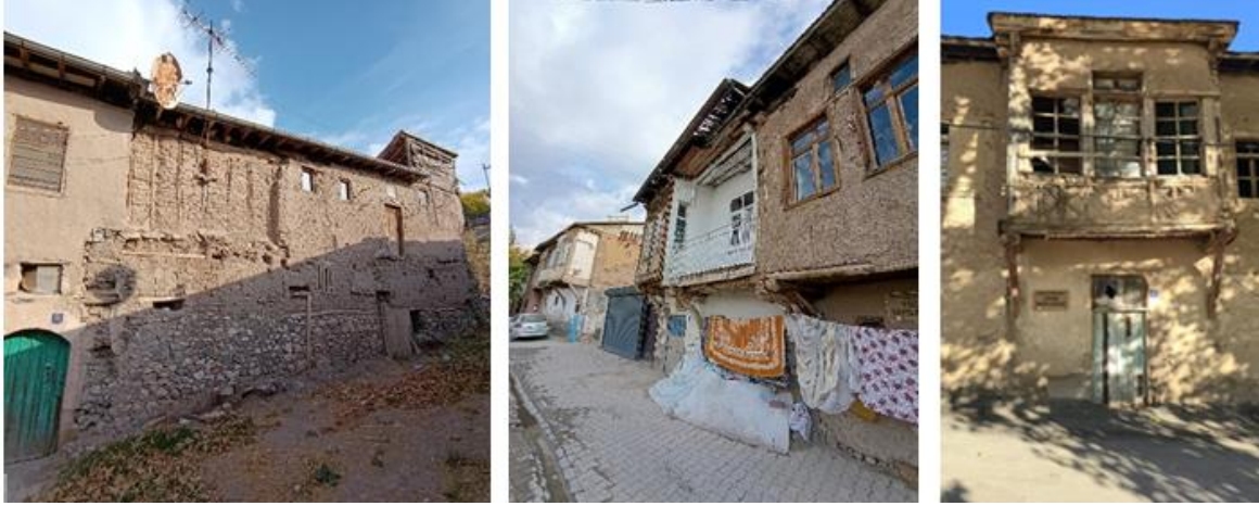
Görsel 7. Geleneksel konutlarda cephe ve malzeme (Yazarın Kişisel Arşivi, 2025).

üzerine kerpiç duvarlarla yığma teknik kullanılarak inşa edilmiştir. Benzer şekilde, bölgede yer alan ibadet yapılarında da taş ve kerpiç malzeme yaygın biçimde kullanılmıştır (Görsel 7). Yerleşim dokusunu oluşturan sokaklar toprak zeminli olup, organik bir plan anlayışı sergilemektedir. Cami, yerleşimin merkezinde konumlanarak toplumsal yaşamın odak noktasını oluşturmuştur (Olğun, 2024).