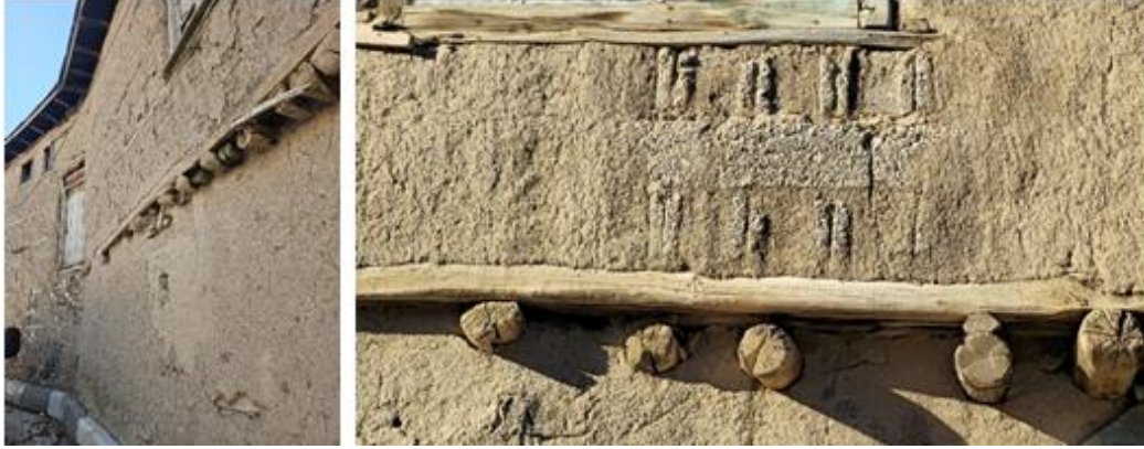
Görsel 9. Geleneksel konutlarda yapım sistemi ve malzeme özelliklerini yansıtan örnek.

Bu üç malzemenin birlikte kullanımı, Hüseynik'in geleneksel konutlarına hem strüktürel dayanıklılık hem de çevresel uyum kazandırmıştır (Görsel 9). Ayrıca, bağdadi ve hımış gibi yerel yapım tekniklerinin uygulanması, bölgenin mimari kimliğini güçlendiren önemli bir unsur olmuştur (Ekici, 2024).