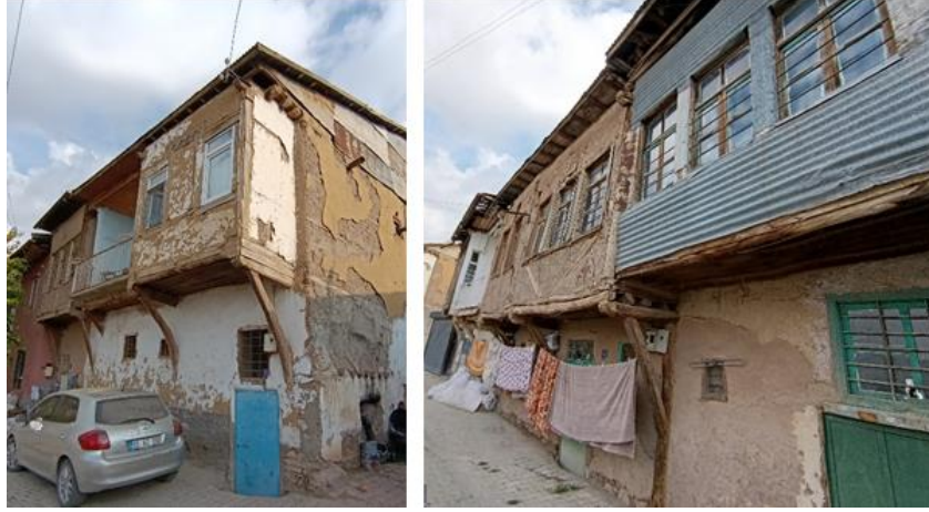
Görsel 5. Geleneksel konutlarda çıkma (Yazarın Kişisel Arşivi, 2025).

korunması ile sürdürülebilir yapı pratiklerinin entegrasyonunu mümkün kılmaktadır (Özgünler, 2017; Kafescioğlu, 2017; Olgun & Karatosun, 2020).