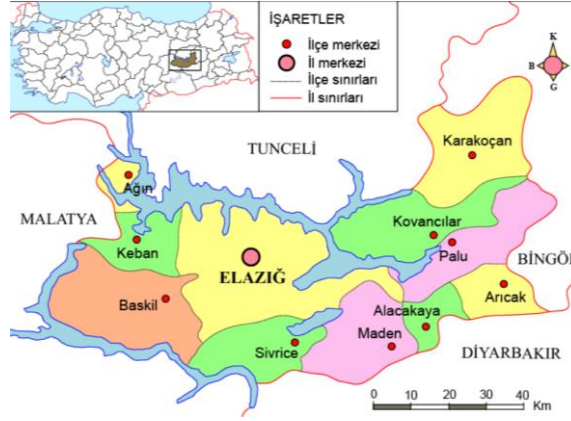
Görsel 4. Elazığ ve ilçelerinin konumu (Saygılı, 2015).

Elazığ ili ve çevresi, elverişli iklim koşulları, yerleşime uygun topografik yapısı ve verimli toprakları sayesinde tarih boyunca birçok medeniyete ev sahipliği yapmış; bu durum, bölgenin zengin bir kültürel mirasa sahip olmasını sağlamıştır (Özer ve Oral, 2017, s.84) (Görsel 4). Günümüzde koruma, sürdürülebilirlik ve enerji verimliliği kavramlarının ön plana çıkmasıyla birlikte, geleneksel bir yapı malzemesi olan kerpiç yeniden değer kazanmıştır. Kerpiç, çevresel uyumu, ekonomik oluşu ve konfor koşullarına katkısı nedeniyle yalnızca kırsal alanlarda değil, gelir düzeyi yüksek kesimlerce de tercih edilen bir yapı malzemesi haline gelmiştir (Kafescioğlu, 2017; Olgun & Karatosun, 2020, s.2).