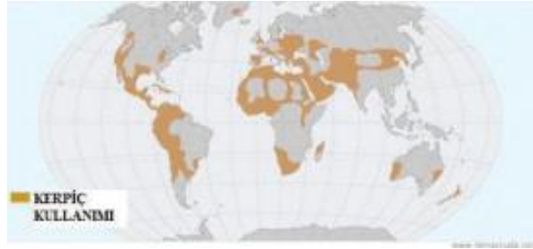
Görsel 1. Dünyada kerpiç kullanımının yaygın olduğu alanlar (Blondet ve Garcia, 2011).

Geleneksel mimari doğal çevre, topografya ve iklimle uyumlu, yerel malzemenin yöresel üretim tekniklerine dayalı deneyim ve geçmiş afet bilgileriyle şekillenen bu eşsiz mimari sistem; bölgesel mimari, yerel mimari, anonim mimari, kendiliğinden mimari, geleneksel mimari veya yerel mimari olarak da adlandırılmaktadır (Rudofsky, 1965, s. 1; Bektaş, 2001, s. 23). Bu sistem tarihsel bir süreklilikle coğrafya ve yaşam kültürüne somut yansımalarıyla yöresel mimariyi oluşturmuş, özgün kültürel kimliği ve toplumsal hafızayı da simgelemiş bir mimari sistemdir (Binan, 2007, s. 26; Akyıldız, 2020b, s. 55).