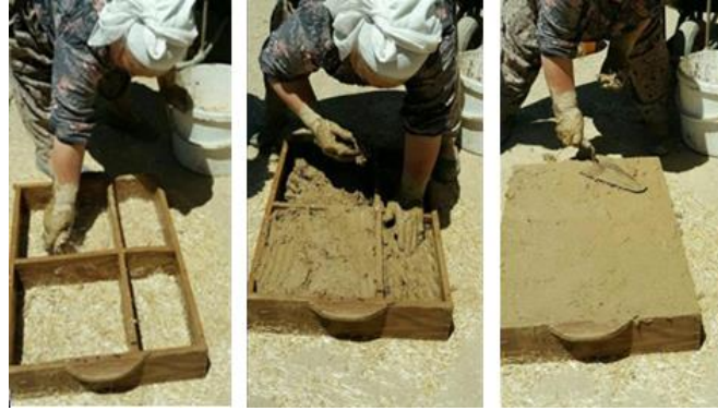
Görsel 3. Ahşap kalıptaki kerpiç karışımı, Konya/Türkiye (Duran, 2016).

strüktürünün vazgeçilmezi olmuştur. Kerpiç malzeme günümüzde de kentsel ve kırsal yerleşim alanlarında varlığı devam ettirmektedir.