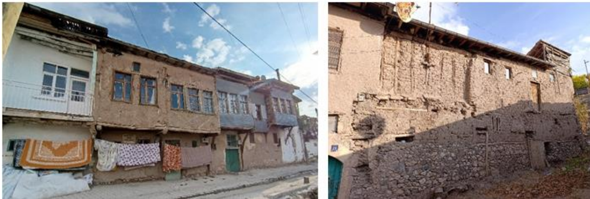
Görsel 10. Geleneksel konutlarda taş, ahşap ve kerpiç malzeme kullanımını (Yazarın Kişisel Arşivi, 2025).

Genellikle bitişik nizamlı olan Elazığ evlerinde kapılar doğrudan sokağa açılmakta; çift kanatlı kapılardan girilen eyvanlar, avlu veya bahçeye geçiş sağlamaktadır. Müstakil nitelikteki konutlarda ise bahçe bölümleri çoğunlukla yan ya da arka kısımda yer almakta, sokağa açılan kapılar ise yapı cephesinde konumlanmaktadır. Bu dokudaki yapı stoğu, çevresel koşulları dikkate alan yerel ustaların bilgi, deneyim ve teknik becerilerini, yöresel malzeme ve araçlarla harmanlamasının bir sonucu olarak değerlendirilebilir (Görsel 10).