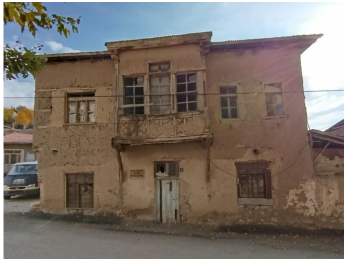
Görsel 6. Geleneksel konutlarda mahremiyet olgusu.

Yerleşim dokusunda evlerin bir cephesi genellikle sokakla ilişkili olup, cephede avluya ya da bahçeye açılan ayrı bir giriş kapısı yer almaktadır. Mahremiyetin korunmasına önem verilen bu yapılarda bahçe ve avlu duvarları kalın ve yüksek biçimde tasarlanmıştır (Görsel 5). Cumbalar, pencereler ve kapılar gibi mimari elemanlar, cephelere görsel bir zenginlik kazandırmaktadır. Konutlar genellikle çıkmalı bir düzene sahiptir ve bu çıkmalar oda boyu çıkma veya gönye çıkma biçiminde düzenlenmiştir. Zemin kat pencereleri olabildiğince küçük tutularak dışarıdan görünürlük sınırlandırılmış, üst kat pencereleri ise sokağa hâkim olabilecek şekilde orantılı biçimde daha geniş tasarlanmıştır. Hüseynik evlerinde zemin katlar, çoğunlukla günlük yaşamın sürdürüldüğü ağıl, mutfak, dükkân, depo gibi işlevsel birimlerden oluşmaktadır. Bu mekânlardaki pencereler, mahremiyetin korunması amacıyla küçük boyutlarda ve yüksek kotta konumlandırılmıştır (Görsel 6).