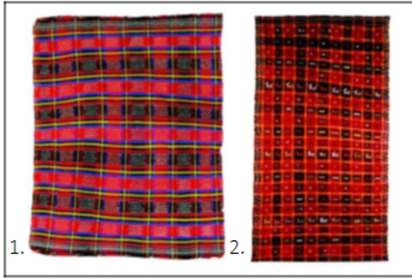
Görüntü 6: 1. Damalı şedde (yün) kumaş. Karabağ mektebi (ekolü). Kelbecer şehri. Millî Azerbaycan Tarihî Müzesi. XX. yy. ortaları; 2. Damalı-tasvirli şedde kumaş. Karabağ mektebi (ekolü). Azerbaycan Halısı ve Halk Tetbige Sanatı Devlet Müzesi. XX. yy. sonu (Aliyeva, 2013: 128, 130).

Damalı Şeddeler: Bu tür şeddelerin görüntüsü genel olarak karelerden oluşur. Kare ve dikdörtgen desenli halılar, satranç şemasını andırmaktadır. Dokumacılar buna "kâğıt kesigi" de demektedirler. Damalı şeddeler evlerde şilte, yorgan, perde, çarşaf, çanta vb. eşyalarda kullanılmıştır. Eşya yüzeyleri, Karabağ ve Gazah halılarında olduğu gibi hayvan ve kuş motifleri ile süslenmiştir. Desenler takviyeli atkı ile yapıldığından örgü üzerinde nakış gibi görünmektedir (Guliyeva; Acar, 2019: 30, 31). Kompozisyon, dokumacının becerisine bağlıdır. Örgü ustası kareyi küçülterek ve genişleterek, çizgiyi oluşturan renk sıralamasını artırıp azaltarak ve renk değişiklikleri yaparak şeddinin görsel kalitesini belirler (Görüntü 6-1,2). Damalı şeddeler çoğunlukla yün, ipek ve çok az pamuk ipliğinden dokunmuştur. Bayram ve düğünlerde kıyafetler damalı şeddeden işlenir, perdeler ve şilteler dikilir, bey (damat) çadırları kurulurdu (Tağiyeva, 2015: 35).