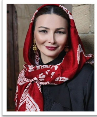
Görüntü 12: Azerbaycan Cumhuriyeti, Büyük Millet Meclisi Kültür Komite Başkanı, Azerbaycan Milletvekili, Ganira PAŞAYEVA. (Kişisel arşivinden, kendisinden izin alındı, 18.09.2020)

Azerbaycan'da kadınlar, yaşa bağlı olarak farklı renk ve formlarda kelağayı kullanmaktadır. Bu nedenle, yaşlı kadınlar kelağayı bir şalma veya dinga (kafa bandı) olarak giymeyi tercih etmekte; genç kadınlar ve kızlar onları fular olarak giymektedir. Yas günlerinde kadınlar siyah veya kahverengi kelağayı takmakta ve genellikle düğün için parlak olanları kullanmaktadır. Düğünden hemen önce düzenlenen kına gecelerinde gelinin başı kırmızı bir kelağayı ile örtülmekte, ellerine ve ayaklarına kına yapılmaktadır. Dolayısıyla, kelağayı geçmişten günümüze sosyal statüye bakılmaksızın Azerbaycan kadınlarının gardıroplarında yer almıştır.