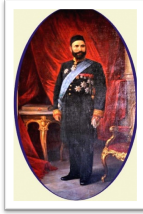
Görüntü 8: XIX. yy. Azerbaycan zenginlerinden olan Z. Tağıyev.