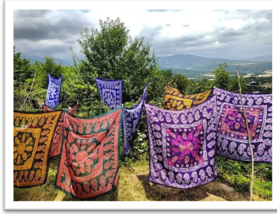
Görüntü 10: Basgal'da üretilen kelağayı.

İpek dokuma geleneği Şeki'de günümüze değin devam etmiştir. "Şeki-İpek" isimli ipek fabrikasında şu anda 800-900 çeşit kelağayı, ayrıca modern kelağayılar ve atkılar üretilmektedir. Bu sayı, sipariş sayısına göre artmaya devam etmektedir. Fabrikanın ürünleri hem yerel pazarda hem de yurtdışı pazarlarında satılmaktadır. Çoğunlukla İran'a ihraç edilmektedir. Şeki ve İsmayılı şehirleri kelağayı üretiminde diğer şehirlere oranla ileridedir (Sadıhova, 2014: 51).