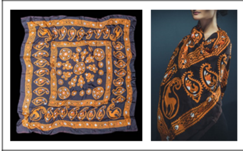
Görüntü 11: Azerbaycan kelağayı. ( https://bakucorner.az/az/milli/kelagayi-prod/kelagayi-377.html , E.T. 17.09.2020)