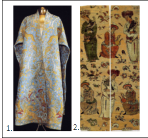
Görüntü 1: 1. Saten kumaş, XVI. yy. Kremlin Silah Müzesi, Moskova (Güngör, 2007: 329); 2. Kadife kumaş, XVII. yy. Danimarka Dekoratif Sanat Müzesi, Kopenhag (Güngör, 2007: 343).