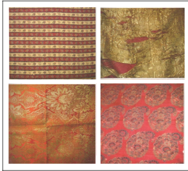
Görüntü 14: Kumaş örnekleri (Çingiz Gacar'ın özel koleksiyonundan, Bakü). (Memmedova, 2016: 333).

Araştırmaya dayanarak şunu söyleyebiliriz "XIX-XX. Yüzyıl başlarında Tebriz'de ipek, atlas, diba, darayı, tafta, gülbendi (renkli ipek kumaş türü), ganovuz, mehmer 5 (mehmel), gülmehmel, zerhara, tirme, elice, zeri-nasiri (Nesreddin Şah'ın onuruna adlandırılmış) mahud 6 , gülger (keçi derisini taraklarken çıkan gezil 7 den dokunan kumaş), çit, semender (ince çit kumaş), kerbas (kalın bez), ağ banu (beyaz renkli ince kumaş, düğünlerde taç yaprakları olarak kapatıyorlardı), gars (hafif tül kumaş), ençuçeki (Yezd'de dokunan sert kumaş), saten vb. geleneksel/yeni tür, yerli ve ithal kumaş çeşitleri kullanılıyordu". Bu dönem kullanılan kumaşların ana malzemesini ipek, pamuk, yün, keten vs. oluşturmaktadır (Memmedova,2016: 332).