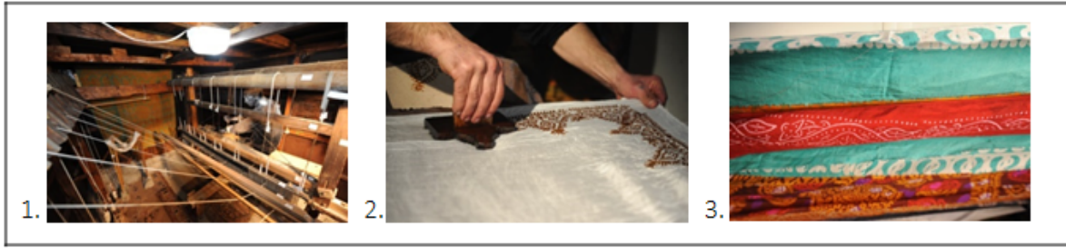
Görüntü 7: 1. İpek kelağayının tezgâhta dokunması. 2. Desenlendirilmesi. 3. Eşarp olarak çeşitleri. ( https://bakucorner.az/az/milli/about-kelaghayi.html . E.T. 27.09.2020).