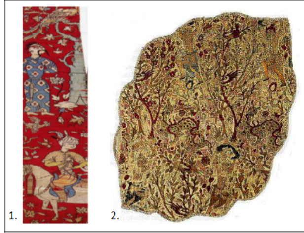
Görüntü 4: 1. Konulu ipekli kumaş, XVI. yy. Şark Halkları Müzesi, Moskova; 2. Kadife kumaş, XVI. yy. Metropolitan Müzesi, New York.

Safevi devletinin XVII. yüzyılda gerilemesi ve daha sonra Hanlıkların oluşması ticarete durgunluğa ve kumaş üretiminin zayıflamasına neden olmuştur.