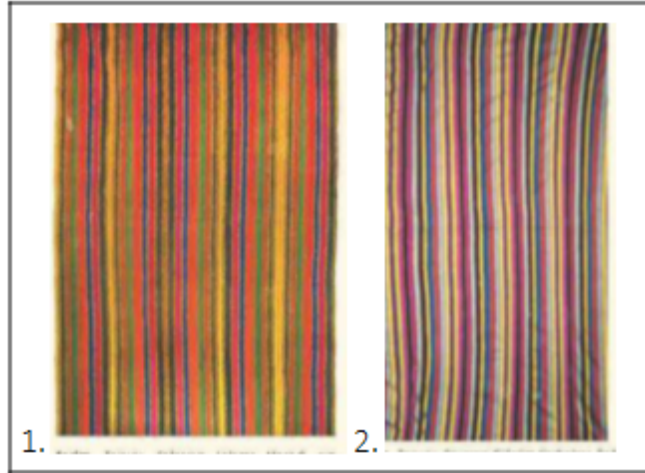
Görüntü 5: Nahçıvan'dan beş dar parçanın birleştiği cecim kumaş örnekleri

Şeritli kumaşlar grubuna giren cecim kendi içinde de ayrılabilir. Çünkü bu kumaşların bir kısmı sadece şeritli üretilse de bir kısmında şeritlerin içerisi çeşitli küçük nakışlarla süslenmiştir. XIX. yüzyılda üretilen bitkisel desenli kumaşlar, elbiselik kumaşlar ve parça hâlinde üretilen sofa bezi, başörtüsü, yatak örtüsü vs. kumaşlara ayrılabilir (Kerimov, 1992: 157). Şunu da kaydetmek gerekir ki bu dönemde Azerbaycan'da üretilen kumaşların desenleri Rusya, İran, Orta Asya ülkeleri gibi çevre ülkelerde üretilen kumaşların desenleri ile benzerlik göstermektedir.