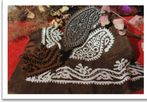
Görüntü 9: Buta desenli kelağayı.

Azerbaycan'da ipekli dokumacılığın durumu, Rusya tarafından işgal edildiği dönemde değişim göstermiştir. Azerbaycan'ın Rusya tarafından siyasi işgali, 1930'lu yıllardan başlayarak ekonomik işgale dönüşmüştür. Bu süreçte Rusya öncelikle, Rusya sanayisinin hammadde ihtiyacını karşılamak için Kafkasya'ya yönelmiştir. Bu amaçla, Kafkasya'da ipekçiliği ve ticaret sanayisini geliştiren bir kampanya düzenlenmiştir. Azerbaycan'da üretilen ipeğin, İtalya ipeği kalitesinden geri kalmadığı söylenmektedir. Bu dönemde Şeki şehir nüfusunun ekonomik hayatında ipekçiliğin başlıca yer alması bir dizi yardımcı sanat alanlarının (boyacılık, tekelduz 3 vb.) geniş ölçek almasına neden olmuştur. Şeki ipeğinin bir kısmı yurtdışına ihraç edilmiş; kalan bölümü ise yerel imalathanelerde, Azerbaycan halkının gereksinimi için kumaş üretiminde kullanılmıştır. Şeki ustaları; ipekten, millî renklendirmeye sahip, desenli kelağayı üretimi yapmışlardır.