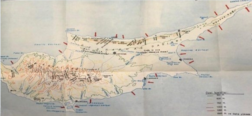
Harita 2: Osmanlı donanmasının muhtemel çıkartma bölgeleri

Kaynak: Genelkurmay Başkanlığı Harp Tarihi Başkanlığı, Kıbrıs Seferi (1570-1571) Türk Silahlı Kuvvetleri Tarihi 3 Kısım , 3/40-41.