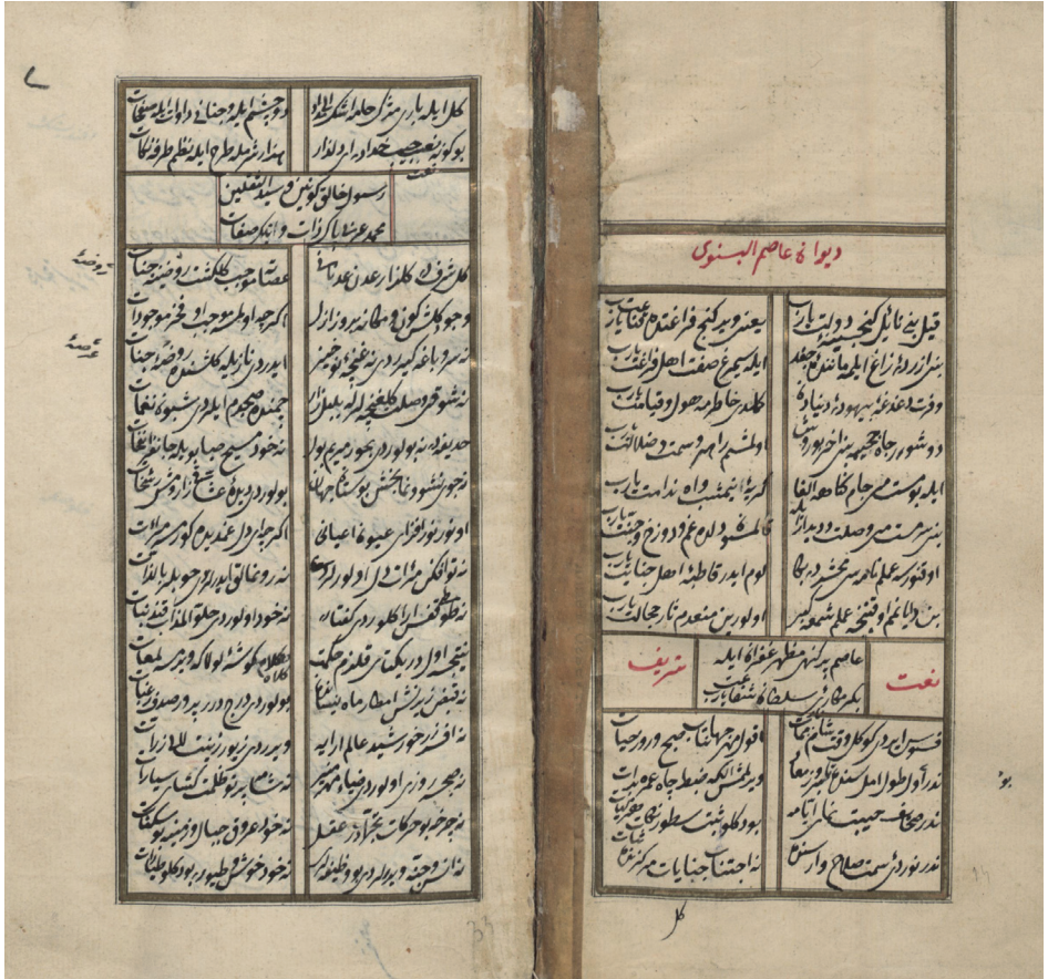
Divân-ı Âsım, İstanbul Üniversitesi Kütüphanesi, T. 70, vr. 1b-2a.