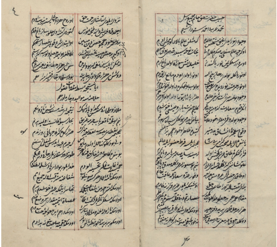
Divân-ı Âsım, vr. 3b-4a.