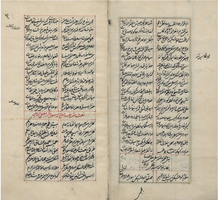
Dîvân-ı Âsım, vr. 2b-3a.