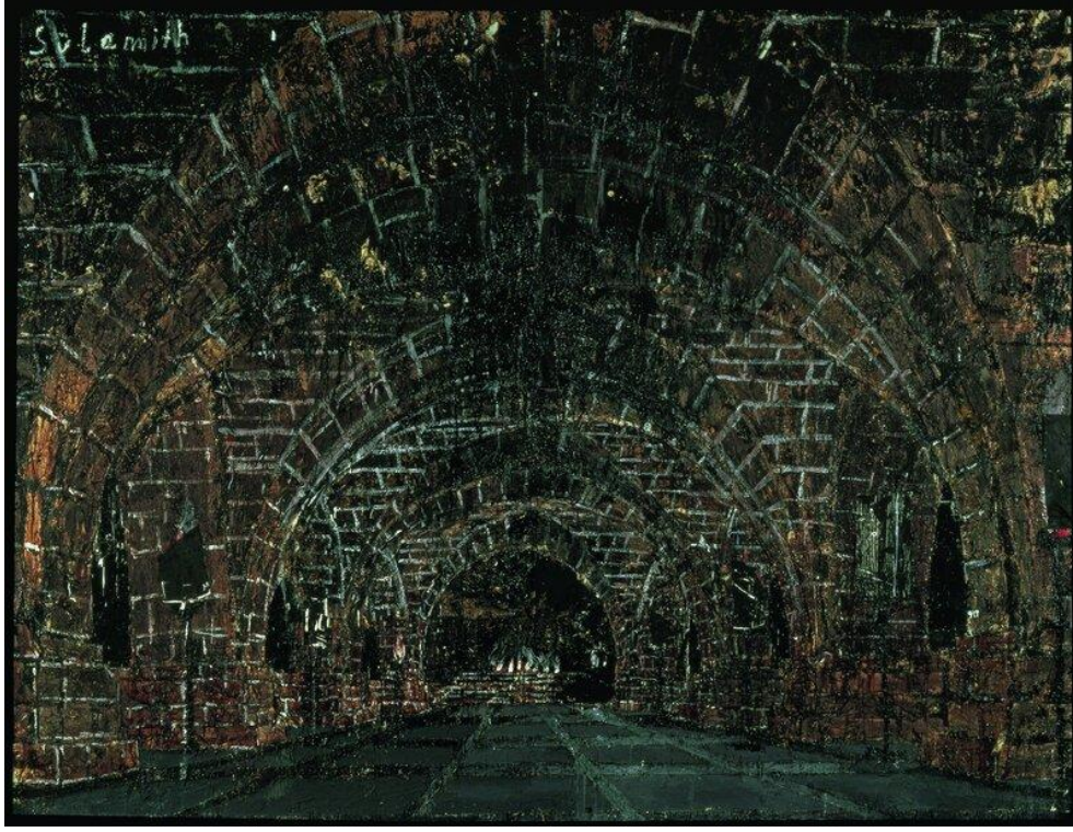
Fotoğraf 7. Sulamith, Kiefer, A. 1983. Tuval üzerine yağlıboya, akrilik boya, emülsiyon, saman, 370 x 290 cm.

Sulamith boyutlarıyla insanda hayranlık uyandırır. Kiefer Margarete'da olduğu gibi bu resimde de Celan'ın şiirindeki anlattıklarının görsel olarak hissettirdiklerinin dışında sanat çevresindeki yankısıyla ilgilenir. Bu amaçla Sulamith karakterini bir portre olarak değil mimari bir alan olarak resmeder. İç karartıcı görüntüsüyle insanların canlı canlı yakıldığı bir fırını anımsatan yer mimar Wilhelm Kreis tarafından tasarlanır. Savaşta öldürülen Alman askerleri için cenaze salonunun fotografik sunumundan alınır. Fotoğraf karesini aynı oranda resmeden Kiefer, söz konusu yeri Yahudi katliamının mimari sembolü olarak tasarlar ve Yahudiler için bir anıt mezara dönüşür (Doğan, 2023).