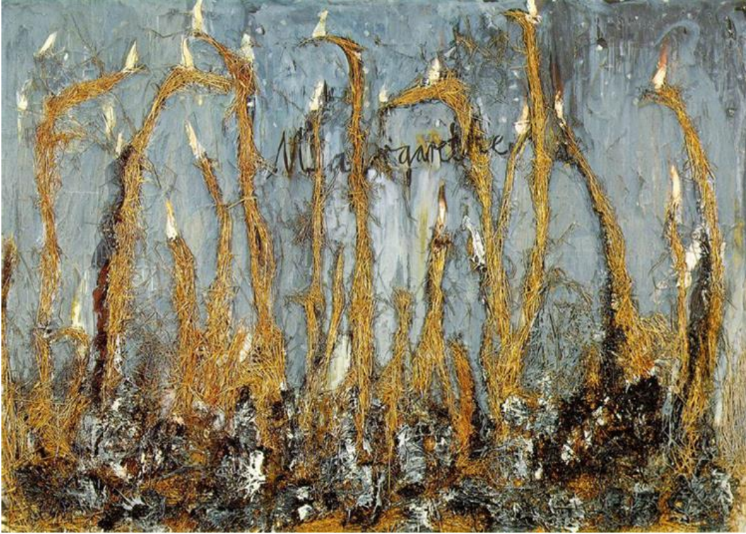
Fotoğraf 6. Margarete , A. Kiefer, 1981. Tuval üzerine yağlıboya, akrilik, emülsiyon ve saman, 380 x 280 cm.

Saman doğası nedeniyle zamana karşı dayanıksız olup, biyolojik bozulmaya uğrar. Bu nedenle sanatçının eserlerindeki samanlar zaman geçtikçe ayrılmaya, parçalanıp kopmaya ve dökülmeye başlar. Eserdeki değişim devam eder. Eser bitmiş gibi görünsede aslında oluşumunu tamamlamaz. Bu sebeple Kiefer'in saman resimleri zaman içerisinde sürekli dönüşür ve yeni kimlikler kazanır. Bu durum eserlerinin devamı ve geleceği adına bir takım kaygılara sebep olur. Ancak Kiefer'in felsefesi bakış açısı ile uyum gösterir. Çünkü, Kiefer için ilgi çekici olan eserlerinde kullandığı malzemeyle birlikte geçirdiği zaman içindeki dönüşümü oluşturur. Bu dönüşüm yıkım ve yeniden oluşum süreciyle ilişkili olarak sanatçının kendine has felsefesini ortaya koyar. Kiefer'in Margarete isimli eseri aslında Clean'ın şiirindeki Margarete 'yi anlatır. Clean Nazi kampında tutsakken bu şiiri yazar. Nazi askerlerinin esir edilen Yahudi halkını müzik eşliğinde katledilişini anlatır. Ana karakter Margarete Almanya'nın üzücü geçmişiyle eşleştirilir. Alman ırkını ve kadını sarı saç benzetmesiyle anlatır. Şiirde senin altın saçların Margarete sözleriyle kadın teması işlenir ve bu dize şiirde sürekli tekrarlanır (Ross, 2006, s. 32).