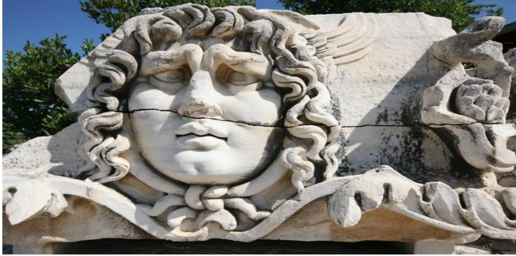
Şekil 2. Medusa kabartması, Didim Apollon Tapınağı