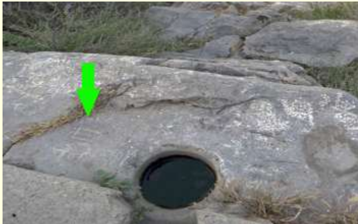
Şekil 2. Süleyman dağındaki Baş Taş.

Ziyaretçiler buz gibi soğuk suyla dolu oyuğa migrenden kurtulmak için sokarlar. 1 Buradaki soğuk su, migren, göz yorgunluğu, zihinsel bulanıklık, ruhsal gerginliğe iyi gelmektedir. Su kültürünün arınma ve temizlenme inancına dayanan bu uygulama fizyolojik olarak vücut ısısının düşürülmesi, kan akışının düzenlenmesi yoluyla sinir sistemini yatıştırıcı bir etki yaratmaktadır. Oş 'ta yaz aylarında hava sıcaklığının 45°C'nin üzerine çıkması, halkın dağda vakit geçirmesinin, soğuk mağara ve sularda pratikler gerçekleştirmesi olağandır. 3