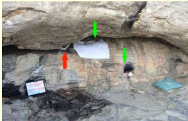
Şekil 5. Ene Beşik Kült Alanı

Ene Beşik, annelik, bereket, yaşam döngüsünün kutsal bir sembolü olarak halkın inanç sisteminde önemli bir yere sahiptir.