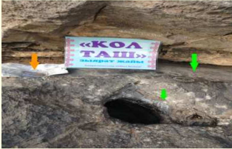
Şekil 6. Kol Taş (ziyaret alanı) kült alanı.

Taş yüzeyinin serinliği, uzun süreli temasın oluşturduğu soğuk uygulama (kriyoterapi) etkisi ile dokularda kan akışını azaltarak iltihabi süreçleri hafifletmektedir. Bu durum, ağrı reseptörlerinin geçici olarak duyarsızlaşmasına, analjezik bir etkinin ortaya çıkmasına yol açar. Ayrıca parmakların taşın pürüzlü yüzeyine teması, refleksolojiye benzer bir sinirsel uyarım yaratarak el kaslarının gevşemesine yardımcı olur. Bu uygulamalar taşın canlı, koruyucu bir ruha sahip olduğuna inanıldığı için taş kültü kapsamında değerlendirilir.