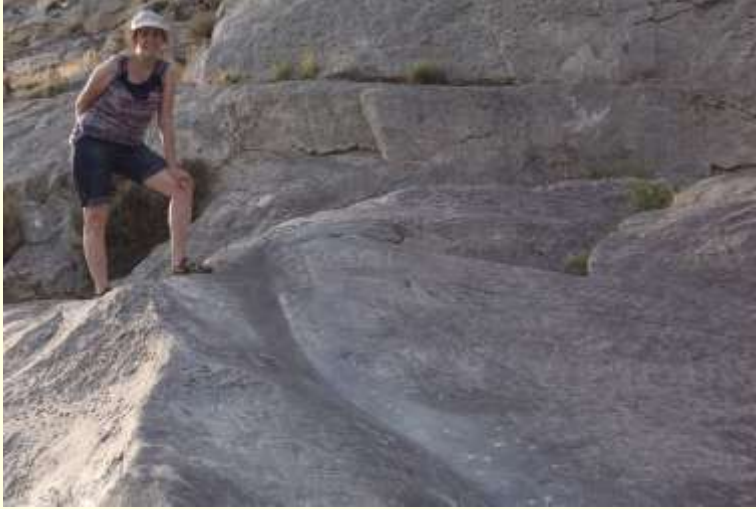
Şekil 3. Süleyman Dağı Bel Taş. Alan araştırmasına ait fotoğraf. Kırgızistan / Oş.

Taş'tan üç kez kayan kişi, sırt, kalça ve böbrek ağrılarından kurtulur. İklim koşulları nedeniyle taş gün içinde oldukça ısınır; ziyaretçiler sıra olmadığında taşın üzerinde sırtüstü uzanarak bel bölgelerini ısıtır. 2,3