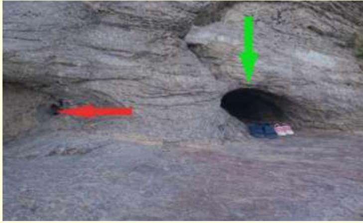
Şekil 4. Çaka Tamar Mağarası

Şekil 4'te yer alan yeşil ok Çaka Tamar Mağarası'nı, kırmızı ok ise hemen yanındaki Ene Beşik'i göstermektedir. Mağarada gerçekleştirilen ritüeller kısırlık, göz rahatsızlıkları, baş ağrısı, ruhsal arınma, doğurganlık dilekleriyle ilişkilidir. Kadınların mağara zeminiyle temas etmesi, doğurganlığı simgeleyen toprak ana kült inancına dayanmaktadır. Mağaradan damlayan suyun bedene ya da yüze temas ettirilmesi arınma ritüeli olarak kabul edilmektedir. Bu uygulama mikro düzeyde hidroterapi etkisi taşımaktadır. Damlayan suyun mağara içindeki iyonize atmosferle birleşmesi, solunum yolları üzerinde sakinleştirici bir etki yaratmaktadır. Sinir sistemi üzerinde yatıştırıcı bir rol üstlenmektedir. Kırgızlar bu damlalara "Allah'ın gözyaşları" adını vermektedir. Bedene değdiğinde fiziksel, ruhsal şifa sağladığına inanılmaktadır. Mağara önünde çıkarılan ayakkabılar, saygı, temizlik anlayışını yansıtmaktadır.