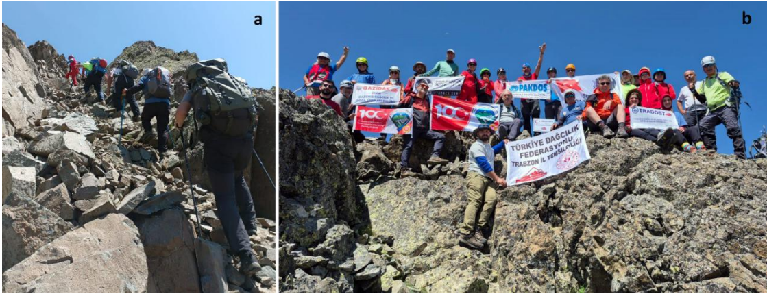
Şekil-6 a) Dik yamaç ve parçalı-gevşek zeminde tırmanma; b) Demirkapı Tepe'nin zirvesi

Pirömer Gölü-zirve arası yaklaşık 2 km kadardır. Pirömer Gölü'nden güneye doğru akarsu boyunca yamaç yukarı tırmanılarak yaklaşık 4 saat sonra Demirkapı zirvesine ulaşılmış olur. Pirömer Gölünden sonra tırmanma rotası oldukça dik ve zor olup, zemin parçalı ve ayırık kayalardan oluştuğu için dağcıların, baton, kask, sağlam bot ve benzeri malzemelere sahip olması güvenlik açısından büyük önem taşımaktadır. Buzul vadisi ve göllere yapılacak normal yürüyüşler için arazi ayakkabısı, baton ve günlük ihtiyaçlar için diğer malzemeler (şapka, yağmurluk, gözlük vb) yeterli olur.