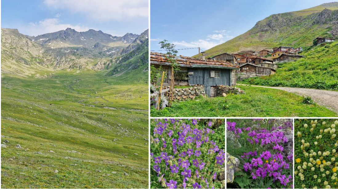
Foto-4 Demirkapı buzul vadisi, morenler, doğal bitkiler ve Büyük Yaylanın otantik evleri

Bölge orman üst sınırının oldukça üzerinde, 2400 metreden daha yüksek olup, bölgede alpin çayırları egemendir. Ayrıca yer yer orman gülleri ve benzeri çalı özelliği taşıyan bitkiler de mevcuttur (Şekil-4).