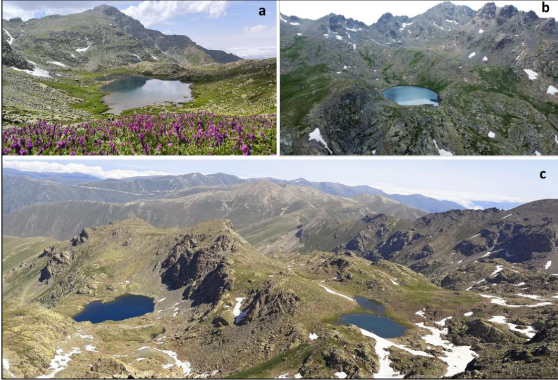
Şekil-2 Demirkapı vadisinin büyük buzul gölleri: a) Pirömer Gölü; b) Karagöl; c) Solda isimsiz göl, sağda Çifte Göller

Karagöl, İsimsiz Göl ve Çifte Göller ile 2 küçük buzul gölü olmak üzere toplam 6 göl bulunmaktadır (Şekil-2). Dolayısıyla burası 6 göller olarak adlandırılabilir.