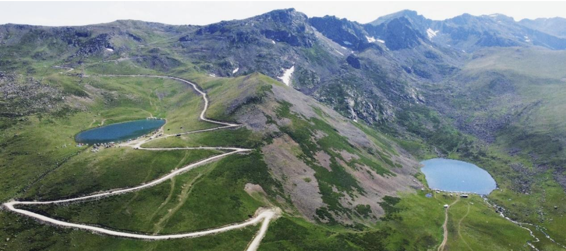
Şekil-3 En çok ziyaretçi alan buzul gölleri, sağda Balıklı Göl, solda Aygır Gölü

Çaykara-Bayburt yolu üzerinde yer alan Balıklı Göl ve Aygır Gölü yaz döneminde yoğun olarak yerli ve özellikle yabancı gezginlerin uğrak yeridir. Özellikle Uzungöl'e yakınlığı nedeniyle bu iki göl gününbirlik çok sayıda ziyaretçi almaktadır (Şekil-3). Bu nedenle de çeşitli çevresel sorunlar ve özellikle çevre kirliliği oluşmaktadır. Bölgede yer alan diğer göllere ancak yaya olarak ulaşılabilir. Dolayısıyla bu göllerde kirlenme veya benzeri bir çevresel sorun şimdilik yaşanmamaktadır.