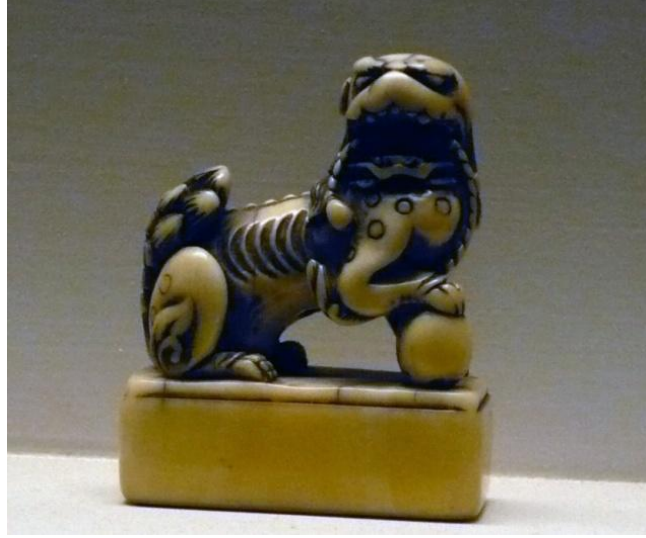
Resim 5: Tenka Taihei, Aslan ve top, mühür biçimli netsuke , 18.yy, y: 4.4 cm, fildişi

Çin efsaneleri de konu olarak çalışılmıştır. 17. Yüzyıldan itibaren Çin’den gelen kitaplarda yer alan efsaneler, tarihi hikayeler ve egzotik motiflerin çeşitliliği Netsuke sanatçısı için ilham kaynağı olmuştur. (Okada, 1980:6) (Resim 6) Yine Çin kökenli Sennin adı verilen keşiş ve münzevi figürleri sıklıkla karşımıza çıkmaktadır.