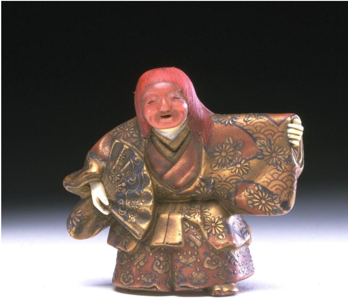
Resim 4: Judokasai, Noh aktörü, 19.yy, y: 4.8 cm, lake, fildişi, mercan

Netsuke heykellerinde günlük yaşamdan eğlenceli konulara sıkça rastlanır: Pazardan dönen kadınlar, balıkçılar, oyun oynayan çocuklar, doğa, hayvanlar, manzara, erotik kompozisyonlar vs. Ukiyo (yüzen dünya) yaşadığımız dünyanın geçiciliğini anlatan Budist inançla ilişkili bir ifadedir. 17.yüzyıldan itibaren bir ekol olarak gelişen Ukiyo-e (ukiyo resmi ya da sanatı) zaman içinde, budist öğretiden uzaklaşmış, hayatın kısa olduğu ve sanatın eğlendirici olması gerektiği fikri öne çıkmıştır. (Chapin, 1922: 10) Bu durum, hayatın katı kurallar ve kısıtlamalarla sınırlandırıldığı Edo Japonyası'nda baskılara karşı bir tepki olarak değerlendirilebilir.