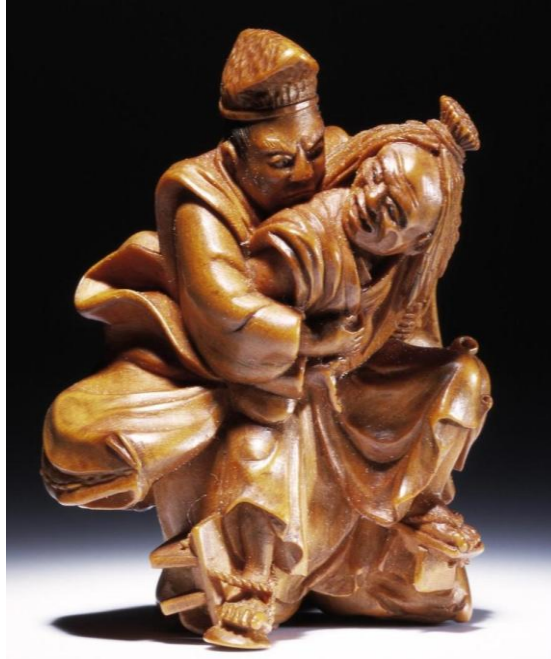
Resim 17: Tadamori yanlış hırsızın peşinde, 19.yy., ahşap

Geleneği, hikayeleri ve plastiği küçücük bir hacim içine sığdırmış netsuke , izleyiciyi zengin bir hayalin içine alır. Mekanını insan bedeni ve avcunun içi olarak seçmiş bu heykelcikler tüm alçak gönüllüğü ile görkemlidir.