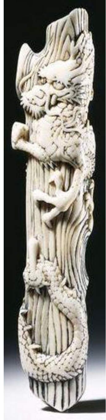
Resim 13: Kütüğe tırmanan ejderha, 18.yy, y: 10 cm, fildişi

Doku: Netsukenin görünümünün önemli bir özelliği de pürüzsüzlüğüdür. Bu niteliğe Japoncada aji adı verilmektedir. Bu kavram, sanatçının ruhunu hem görme hem de dokunma