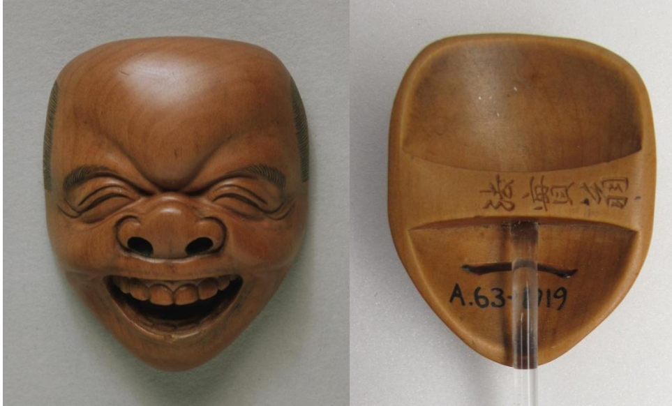
Resim 9: Tenkaichi Deme Uman, Noh maskesi, 18.yy, y.: 4.2 cm, ahşap