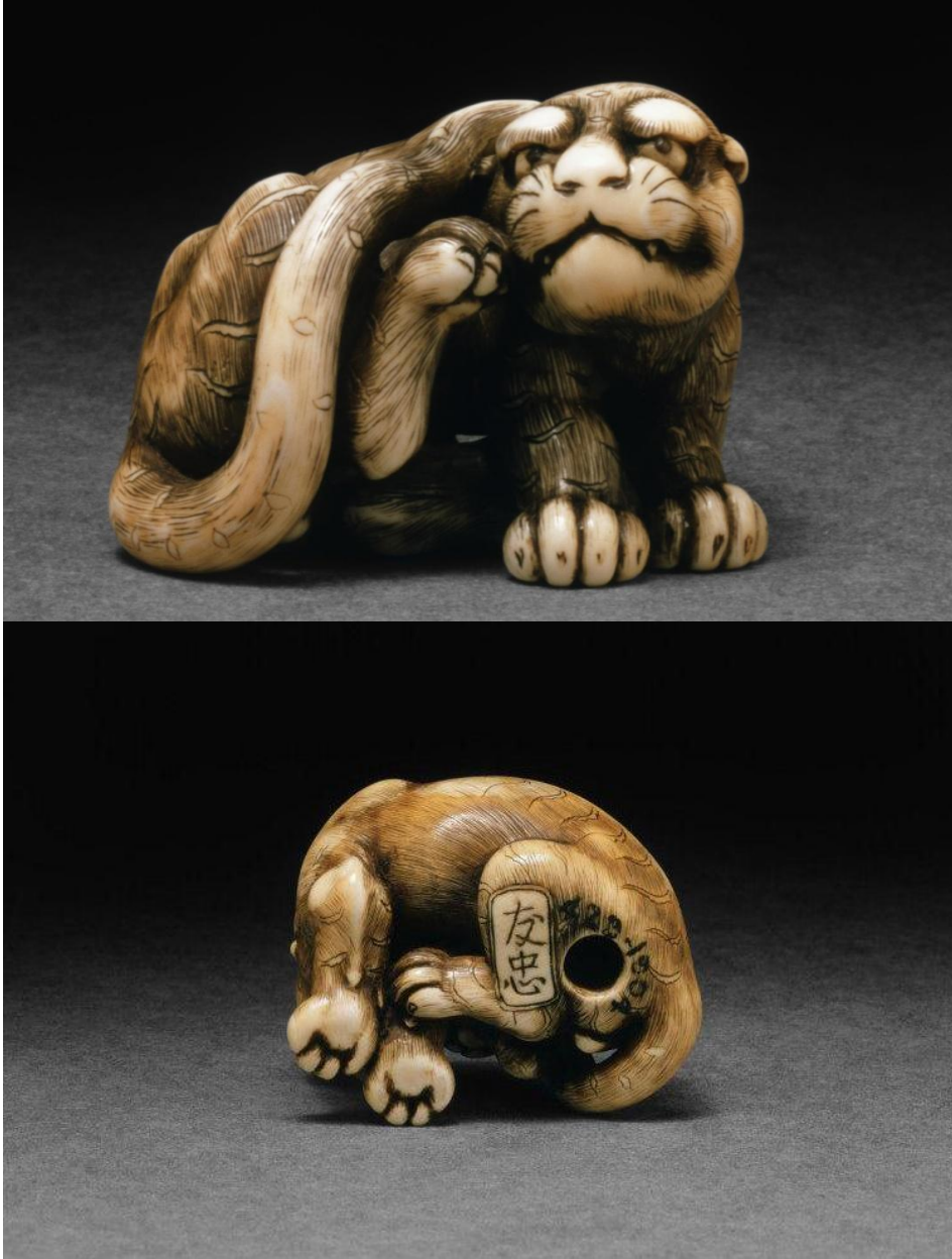
Resim 10: Tomotada, Kaşınan kaplan,18.yy, fildişi (yan ve alt görünüm)

Netsukede çalışılmış konuların başında hayvanlar gelmektedir. Bunların bir kısmı çevrede bulunan sıradan hayvanlardır: Günlük yaşamda karşılaşılabilecek öküz, balık, kuş gibi. Mitolojik ya da egzotik hayvanlarla da karşılaşmaktayız: Shi-shi (Çin mitolojisinde aslan köpek); fil, kaplan vs. Kaplanlar shi-shi modellerine göre daha realistik figürlerdir. Ama tasarımlara dikkatle bakıldığında gerçek kaplandan çok ev kedisinden çalışılmış gibidir. Japonya’da modern zamanlara kadar kaplan bulunmamaktadır. (Earle, 1980:9)