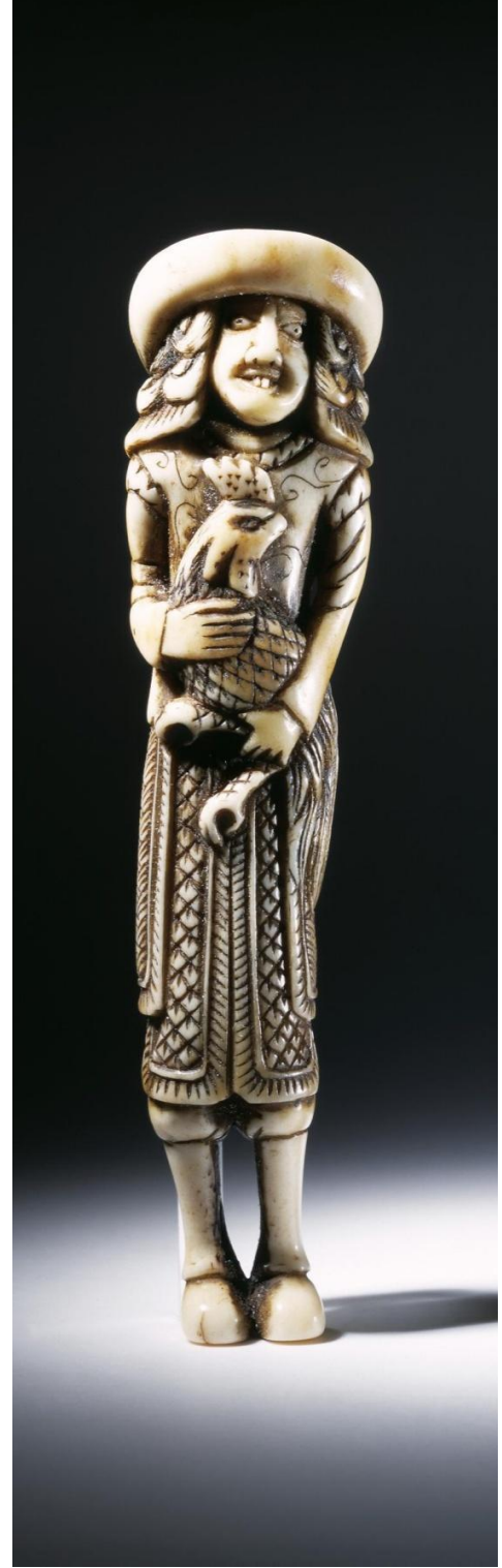
Resim 7: Horoz taşıyan Hollandalı, 18.yy, y: 9.8cm, fildişi

Resimdeki örnek netsuke tasarımında kompozisyonun sadece asılı ya da elde tutulmasına değil bağımsız bir heykel olarak ayakta durabilmesi için dengenin nasıl dikkate alındığını gösterir.