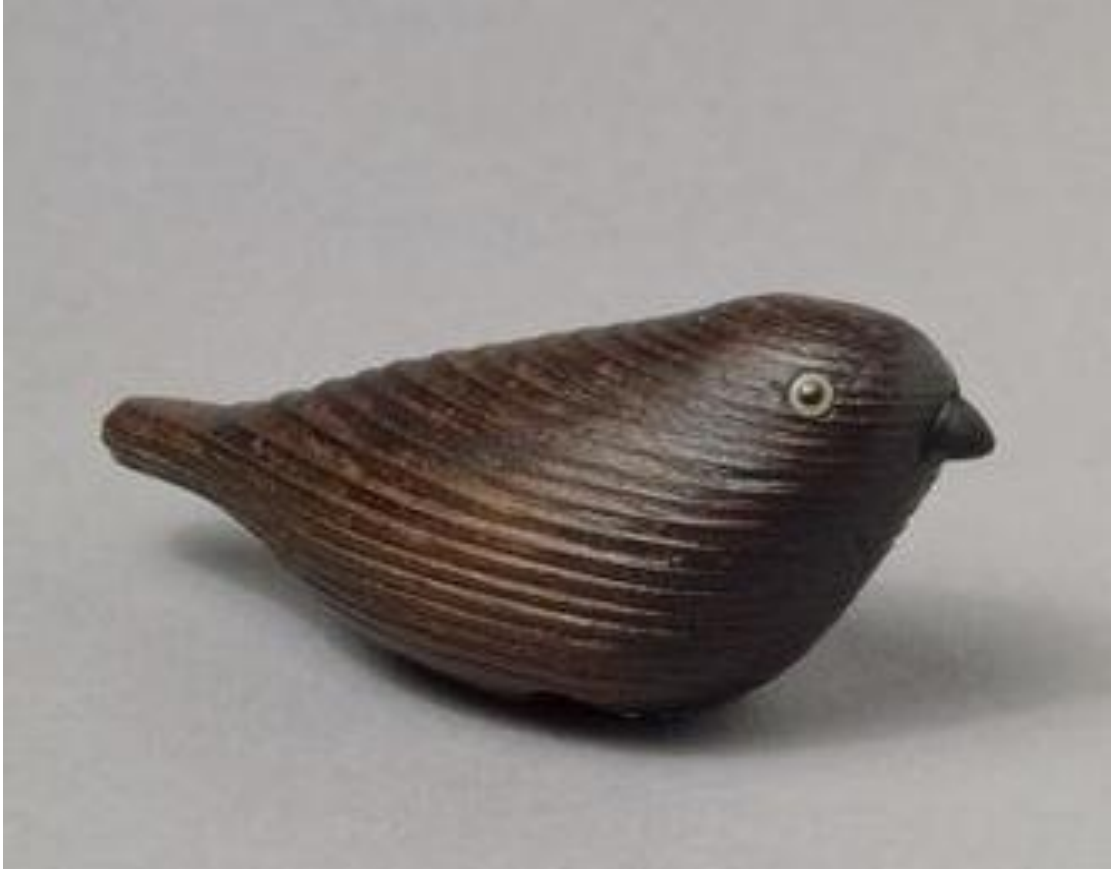
Resim 15: 18-19. yy, u: 6.7 cm, ahşap

Netsuke yi heykel sanatında ayrıcalıklı bir yere oturtan en önemli özelliği küçük yontu oluşudur. Heykelin bu sıra dışı boyutunda izleyicinin heykelle ilişkisi yakınlaşmakta, diğer bir deyişle algı mesafesi kısalmaktadır. Kimono kemerine asılı duran bu objeler uzaktan genel kompozisyonları ile algılanır. İzleyiciyi merakını uyandırarak yakınlaşmaya davet eder. Elle tutularak izlenen bu heykelciklerde detaylar çok temiz çalışılmıştır. Bu kadar detaylı bir çalışma biçimi için belki yontu yerine kazıma ifadesini kullanmak yerinde olacaktır. Detaylar kimi zaman izleyicinin ancak dikkatle, yakından baktığında algılayabileceği sürprizler saklamaktadır. (Resim 16)