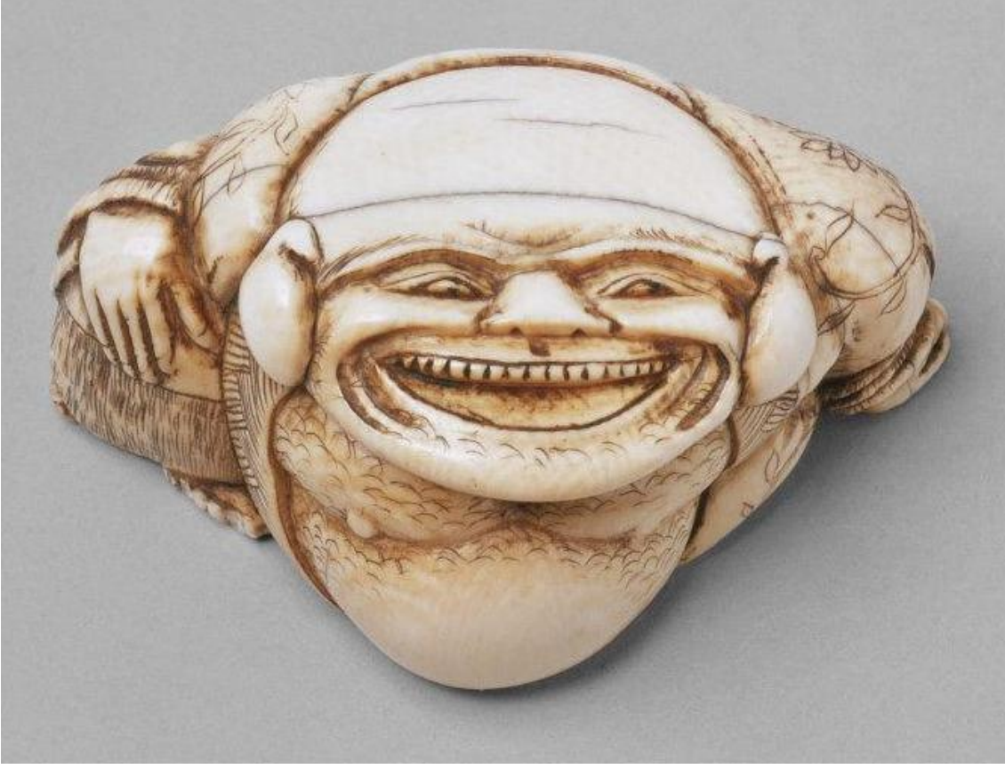
Resim 1: Kohosai, “Bereket tanrısı Hotei”, 19.yy sonları, y: 4.3 cm, fildişi