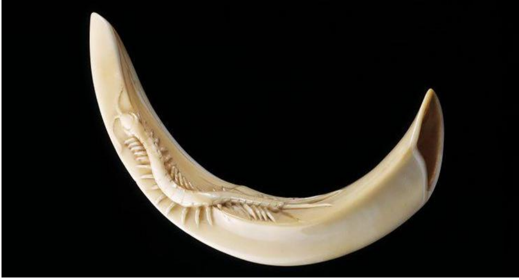
Resim 14: 19.yy sonları, yaban domuzu dişi