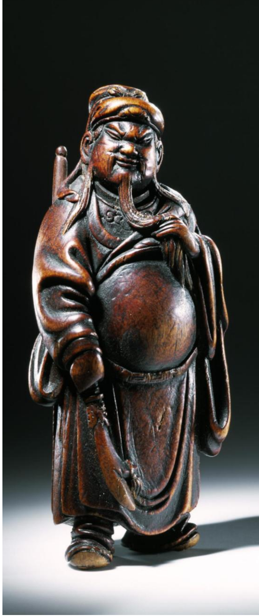
Resim 3: Kakihan, Çinli general ve savaş tanrısı Kan'u, 19.yy., ahşap