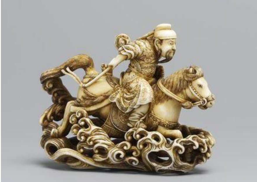
Resim 6: Rakueisai, Çinli general Gentoku 19. yy, u: 6.4 cm, fildişi

Çin efsaneleri de konu olarak çalışılmıştır. 17. Yüzyıldan itibaren Çin’den gelen kitaplarda yer alan efsaneler, tarihi hikayeler ve egzotik motiflerin çeşitliliği Netsuke sanatçısı için ilham kaynağı olmuştur. (Okada, 1980:6) (Resim 6) Yine Çin kökenli Sennin adı verilen keşiş ve münzevi figürleri sıklıkla karşımıza çıkmaktadır.