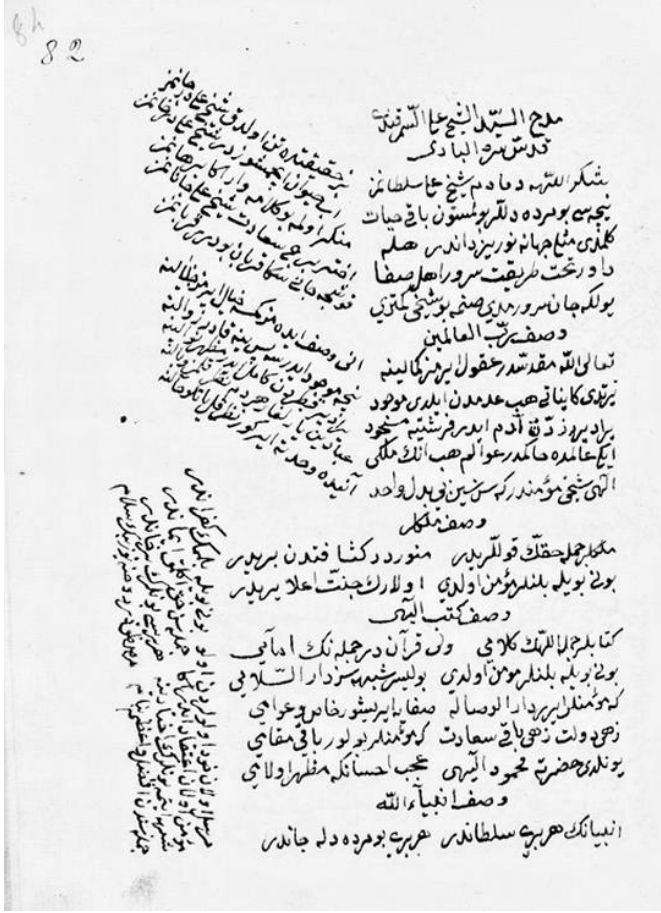
Resim 1: Arabe 2254 82b sayfası.

1.2.2. Başlıklar ve Tematik Kurgu: Eser, 11 tematik bölümden oluşur. Metnin dikkat çekici yanını, anlatımındaki sıralamadır. Adeta bir yol haritası gibi tasavvuf kültürünün çıkış noktası olan mürşitten başlayarak en yüksek ve mutlak olan Allah (celle ve azze)'a, O'ndan somut ve içsel olana yani insana ve onun içi dünyasına doğru bir ilerleyiş söz konusudur.