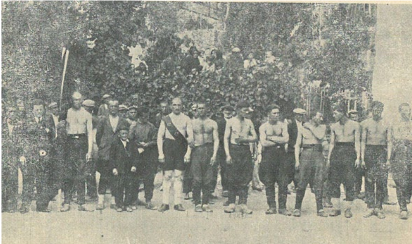
Kaynak: (Çoruh, 21 Şubat 1938, s. 16).