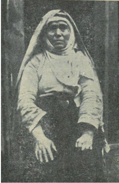
Gazi Havva Bacı