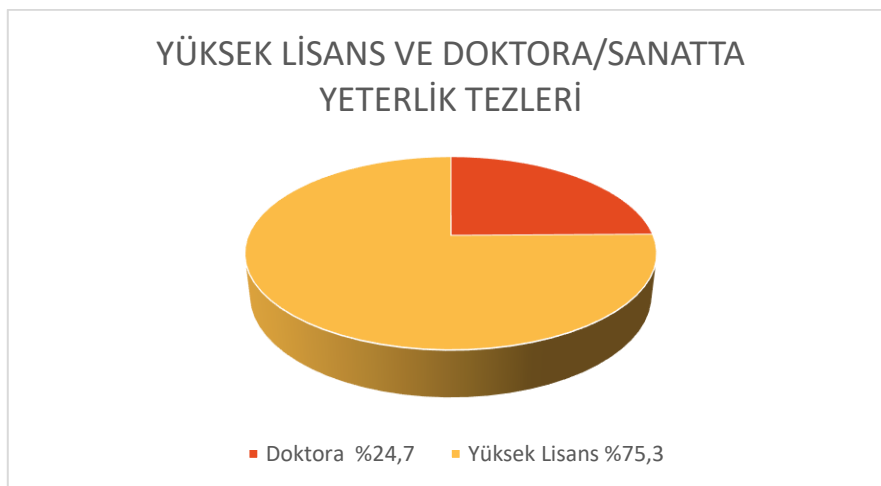
Grafik 2. Türkiye’de lisansüstü tezlerde eko-eleştirel kuramın çalışılma yüzdelerinin yüksek lisans ve doktora/sanatta yeterlik derecelerine göre dağılımı (1995-2024 Haziran)

Örnekleme özelinde değerlendirildiğinde, lisansüstü eko-eleştirel çalışmalar içerisinde yüksek lisans tezlerinin sayısal olarak ağırlıkta olduğu görülmektedir. Ancak bu durum, eko-eleştirel yaklaşımın doktora düzeyinde daha az ilgi gördüğü şeklinde doğrudan ve mutlak bir yargı olarak değerlendirilmemelidir. Türkiye’deki yüksek lisans ve doktora programlarının sayısal dağılımının eşit olmaması, doktora programlarının daha sınırlı sayıda üniversitede yürütülmesi ve doktora öğrenci sayısının yapısal olarak daha düşük olması, bu nicel farkın önemli belirleyicileri arasındadır. Dolayısıyla bulgular, doktora düzeyinde eko-eleştirel çalışmalara yönelik ilginin zayıflığından ziyade, yükseköğretim sisteminin yapısal dinamikleri çerçevesinde temkinli biçimde yorumlanmalıdır.