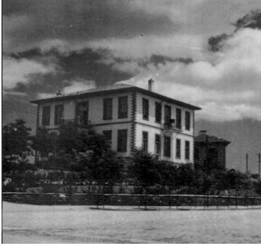
Grsel 1. Konya Halkevi eski binası (Rum Okulu) (Kaynar, 2007: 382).

1940'lı yıllara gelindiğinde kullanılan yapının yetersiz kalması sebebi ile alıřılan ve kurs verilen birok alan farklı okullara, cezaevine dađılmıştır. Bu durum, Halkevi faaliyetlerinin kontrolnn yapılamaz hale gelmesine sebep olmuřtur. Bu sebeple Halkevi btesinden belirli bir ayırım yapılarak yeni bir bina yapılmasına karar verilmiřtir. CHP Mřavir mimarı A. Sabri Oran tarafından tasarlanan Konya Halkevi binasının tasarımları Arkitekt Dergisi'nde yayınlanmıřtır (Grsel 2) (Oran, 1940: 198-202). Konya Halkevi'ni Alaaddin Křk harabelerinin eteklerindeki bir mevkide tasarlayan A. Sabri Oran'ın projesi muhtemelen lek olarak byk olması ve ekonomik problemler neden gsterilerek uygulanamamıřtır (Parlak ve Yaldız, 2022: 240).