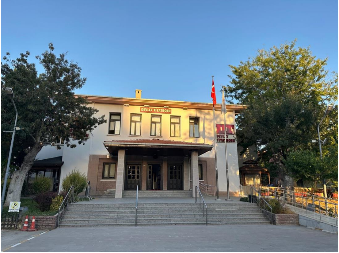
Görsel 4. Őevki Balmumcu tarafından tasarlanan Konya Halkevi binası ön cephe (Konya Devlet Tiyatroları).