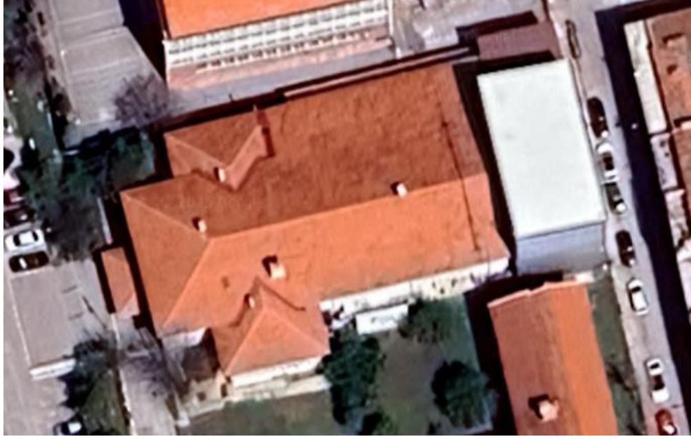
Görsel 7. Konya Halkevi'nin (Devlet Tiyatrosu) bugünkü durumu.