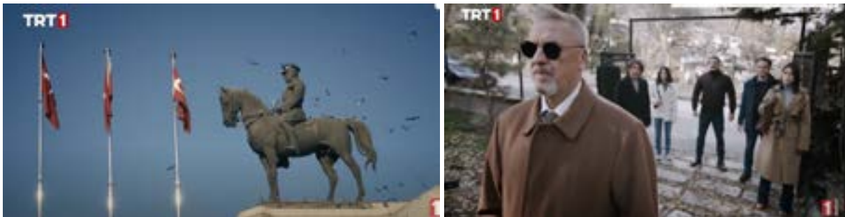
Görsel 1. İlk Bölümden Sahneler.

Teşkilat dizisinin ilk bölümü “Vatan için millet için ölmeyen ölmüşlerdir” konu başlığı ile seyircinin karşısına çıkmıştır. Bölümün başında Atatürk görseli ile başlayan kareler eşliğinde dış ses bölümünün ana temasına uygun bir şekilde aktarım yapmaktadır. Teşkilatın içerisinde yer alan istihbarat görevlilerinin her birinin veda sahneleri verilerek, ailesini, işini ve geride bıraktıkları görülmektedir. Bu sahnelerde görevlerinin kutsallığına atıf yapılarak, devlet ve vatan vurgusu ön plana çıkarılmaktadır.