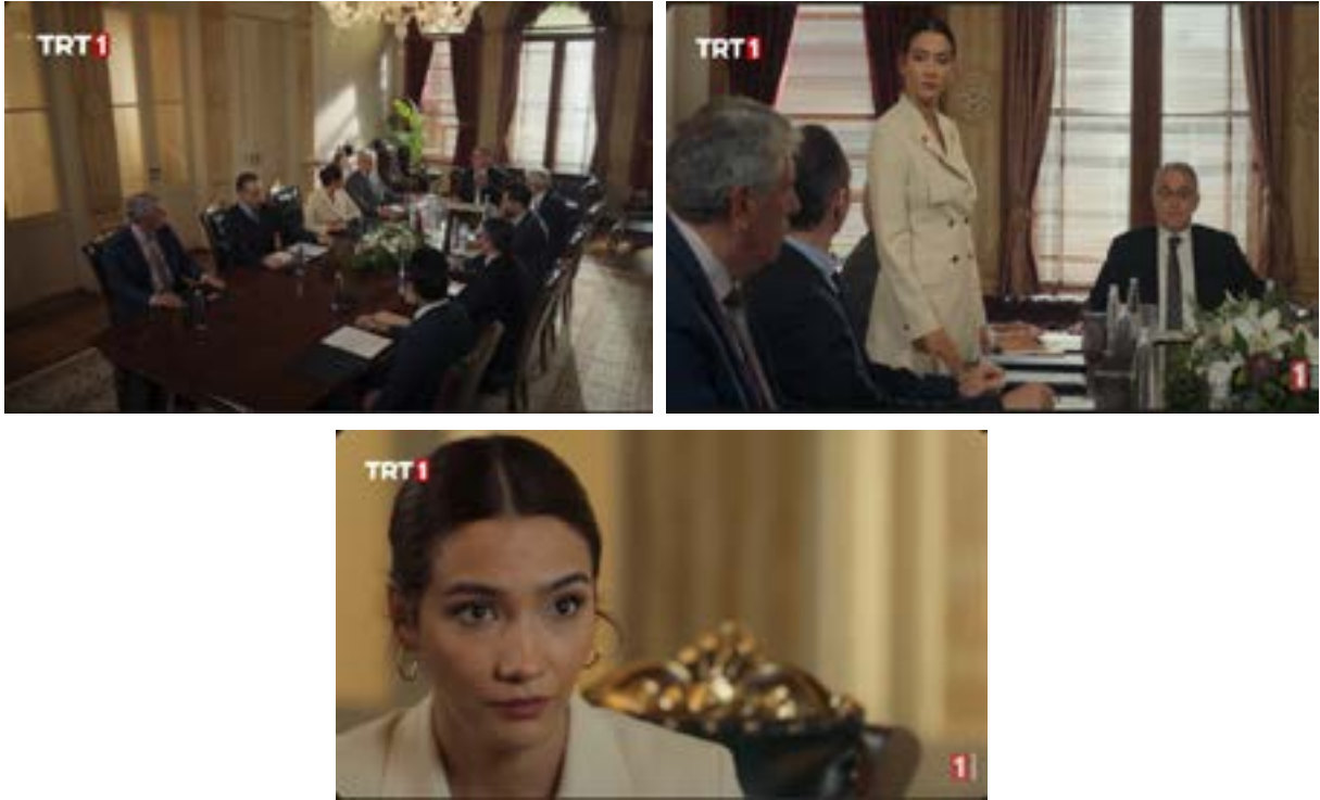
Görsel 5. Dizinin 81. Bölümünden Sahneler.

Teşkilat dizisinin 81. bölümünde Sırp asıllı teröristi savunan terör örgütü yandaşının sözlerine karşı "bayrak dediğiniz nedir Neslihan Hanım bir insanın hayatından daha mı değerli" diye sözde bu saldırının savunmasını yapmaya çalışırken, Neslihan Başkan'ın Türk Bayrağı'nı şu sözlerle savunması -"O terörist bizim bayrağımıza saldırdı. Sizin için bir bez parçası değil mi? Yere düşebilir yırtılabilir. Gökyüzünde dalgalanırken birisi çekip alabilir. Sizin bayrağınız basit bir bez parçası olabilir ama bizim için öyle değil bayrak, bizim için bağımsızlık demek özgürlük demektir. Gözünü bile kırpmadan ölüme koşan binlerce şehidin kanı demektir. Hiçbirinizden