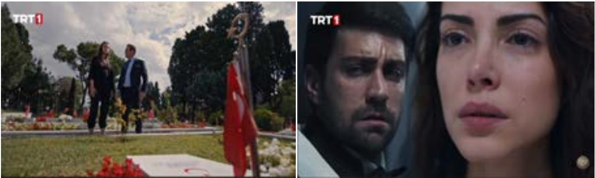
Görsel 4. Dizinin 51. bölümünden sahneler.

Teşkilat dizisinin 51. bölümünde istihbarat görevlisi Zehra’nın, teşkilat başkanı ile birlikte mezarlığa gittiği görülmektedir. Gerçekleştirilen bir operasyon sonrası duygusal ve fiziksel travma yaşadığı gözlemlenen Zehra’nın görevine yeniden dönmesi için başarılı olması gereken bir test vardır. Test sırasında kendisine sunulan resimlerin kendisinde uyandırdığı tanımlamalar sorulmaktadır. Şehit olan arkadaşının görseli sunulduğunda vatan sağolsun ifadesi ile Zehra’nın kaybettiği şehit arkadaşının vatan için hayatını kaybeden bir şehit olduğunu vurgulaması dikkat çekmektedir. Şehidin bir ismi olsa dahi vatanın ve milletin sürdürülebilirliği için hayatını kaybeden herkesin kahraman olduğu, milletin iradesinin ve devletin vatanın bağımsızlığını korumak