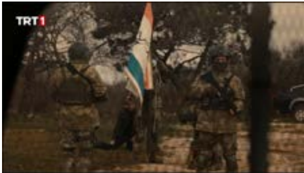
Görsel 3. Dizinin 130. Bölümünden Sahneler.