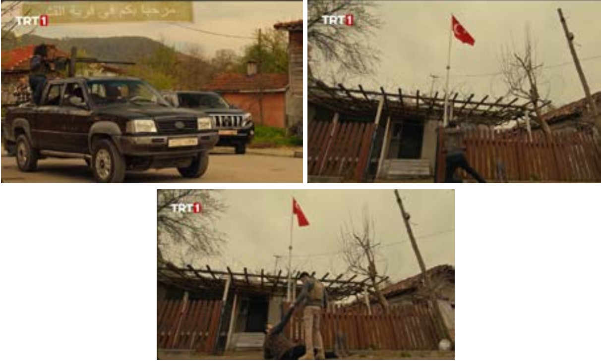
Görsel 6. Dizinin 72. Bölümünden Sahneler.

Teşkilat dizisinin 72. bölümünde köyde saldırı düzenleyen ve birçok insanı öldürüp köydeki çocukları kaçıran terör örgütü grubu liderinin işaretiyle Türk Bayrağı'nın indirilmesi yönünde harekete geçen teröristin bu hamlesi olay yerine gelen Teşkilat ekibi ile son bulur. Teşkilatın içerisinde aktif saha operasyonlarında baş karakter olarak yer alan Ömer isimli istihbarat görevlisinin bayrağı indirmek isteyen teröristi etkisiz hale getirdikten sonraki ifadeleri bayrağın dokunulmazlığı yönündeki duruşu temsil etmektedir. "Bayrağıma dokunanın elini kırarım!" ifadesiyle dizi izleyicisine verilmek istenen mesaj millî kimliğin belirli semboller ve temsil pratikleri aracılığı ile dizinin ana teması olarak vurgulanmaktadır. Görsel ve işitsel unsurlar ile 72. bölümde bayrağa yönelik verilmek istenen anlam sembolik bir formda somutlaştırılmaktan öte belirli bir kültürün oluşturduğu ve Türk Milleti'nin istiklalini kazanması ve bağımsız bir devlet olmanın gereği olarak gösterilmiştir.