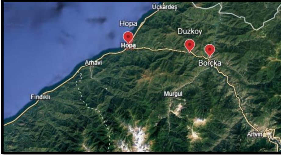
Borçka-Hopa arası karayoluyla 28 km'dir. 86

11'inci Alay Trabzon'a ulaştığında Alayın 2'inci Taburu yeni kurulan 13'üncü Tümen'in 55'inci Alayı'na çekirdek olarak Trabzon'da bırakılır. 87 3'üncü Taburu 16 subay ve 250 er, dört makineli tüfek, 51 sandık piyade cephanesi, 7 subay ve 37 erden oluşan 1 kudretli dağ bataryası haktan sağlanan motorlarla Akçaşehir'e yola çıkarılır. 3'üncü Kafkas Tümen Komutanı Albay Nuri 18 Nisan'da Erkân-ı Harbiye-i Umûmiye Vekâletine çektiği şifre telgrafıyla 2 Schneider dağ ve 4 kudretli dağ topunun 340 schneider, 419 kudretli mermisiyle ve 40 kadar erle Batum gemisine yüklenerek Akçaşehir'e ulaşmak üzere Trabzon'dan yola çıkarıldığını bildirir. 88 Batum yalnız Karadeniz'in, İngiliz ve Yunan gemilerinin tehdidiyle yol almaz. Bu yaşlı gemi yol alırken geminin gövdesi birkaç kez delinir. Delikler çimento ve çaputlarla kapatılır, ziftli brandalar ile tutturulur. 89