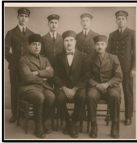
Trabzon ve Samsun Bahriye Komutanlıklarında görev alan deniz subayları.

Sevkiyatın yapılacağı deniz araçlarının organizasyonu konusunu ise Trabzon Nakliyatı Bahriye Komutanlığı üstlenir. 81 Ancak bugünlerde Karadeniz'de taşıma yapmak zorlaşmıştır. İngilizlerin gemi ve gambotların seyir defterini inceleme bahanesiyle pek çok kez Trabzon'a çıktığı, 82 Yunan, İngiliz hatta ABD gemilerinin cirit attığı Karadeniz limanları arasında tek sefer değil, birkaç kez gidip gelmek, arada kömür alımı için duraklamak zorunda kalacak deniz nakliye araçlarını zor bir görev beklemektedir. Buna karşın Sevkiyat ve Nakliyat Genel Müdürlüğü, Trabzon Nakliyat Bahriye Kumandanlığı ve hatta Samsun Sevkiyat Müdürlüğü eş güdüm halinde bu yolculuğu koordine eder. Şahin, Ümit, Batum, Pretal, Penay, Gülnihal, Bahricedit, Turgut ve Kırım vapurlarının kullanıldığı bu sevkiyatta halk da motor, kayık ve sandallarla vatan görevini yerine getirecektir.