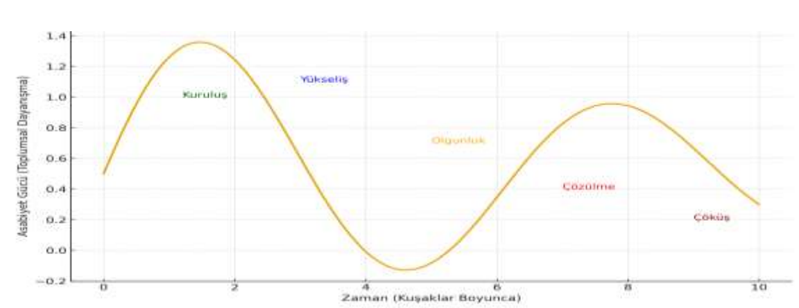
Grafik 1: İbn Haldun'un Tarihsel Döngü Aşamaları

Bu döngünün sonunda yeni bir "asabiyet" taşıyıcısı sahneye çıkar. Bu, döngünün yeniden başlamasıdır. Günümüzde İbn Haldun'un bu düşüncesi, sosyoloji (toplumsal dayanışma), siyaset bilimi (devletlerin ömrü), ekonomi (refah-çöküş ilişkisi) gibi alanlarda erken bir sistem teorisi veya medeniyet döngüsü modeli olarak kabul edilmektedir (Korkmaz, 2018). Grafik 1, bu döngünün aşamalarını göstermektedir.