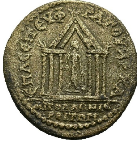
Figür 18. Hexastylös prostylös tapınağın önünde ayakta ve başı sola dönük Apollon Kitharoidos betimli Apollonos Hieron sikkesi (RPC VI: 4557)

var olan bir kutsal alana işaret etmektedir. Tüm bu bilgiler ışığında Tripolis'te 2017 yılında yapılan arkeolojik çalışmalar sırasında bulunan bir heykel kaidesinin MS. 4. yy.a tarihlenen Grekçe yazıtında, "Apollon'un Kenti" ifadesi de kentin Apollon kültü ile doğrudan bir ilişki içerisinde olduğunu kanıtlar niteliktedir.