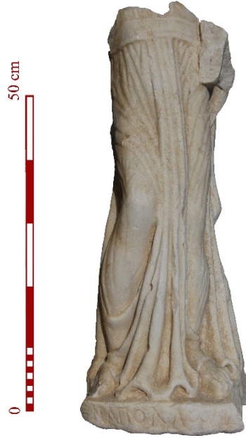
Figür 16. Tripolis Apollon Kitharoidos heykeli (Duman 2024: 65)

Apollonos Hieron'da Apollon kültürüne ait ilk bulgu yine Tiberius Dönemi'ne (MS 14-37) ait iki sikkede görülmektedir. Sikkenin ön yüzünde İmparator Tiberius, profilden sağa dönük bir şekilde betimlenirken, arka yüzde ayakta cepheden betimlenen Apollon, sol elinde kithara, sağ elinde phiale tutmaktadır (RPC I: 3043; SNG Ber.: Taf. 93, 2907). Apollon'un Kitharoidos kült heykeli tipolojisindeki bu sikkede Apollon, göğüs altında kemerle sıkıştırılmış kolsuz, uzun khiton üzerine iki dairesel formlu belirgin omuzlarını saran manto giyimlidir. Tripolis'te ele geçen pişmiş toprak mühür baskısı üzerinde yer alan cepheden betimlenmiş Apollon'un da tıpkı Apollonos Hieron sikkesinin arka yüzünde olduğu gibi, iki dairesel formlu belirgin omuzları ile tasvir edilmiştir. Benzer bir betimleme arka yüzde ayakta ve