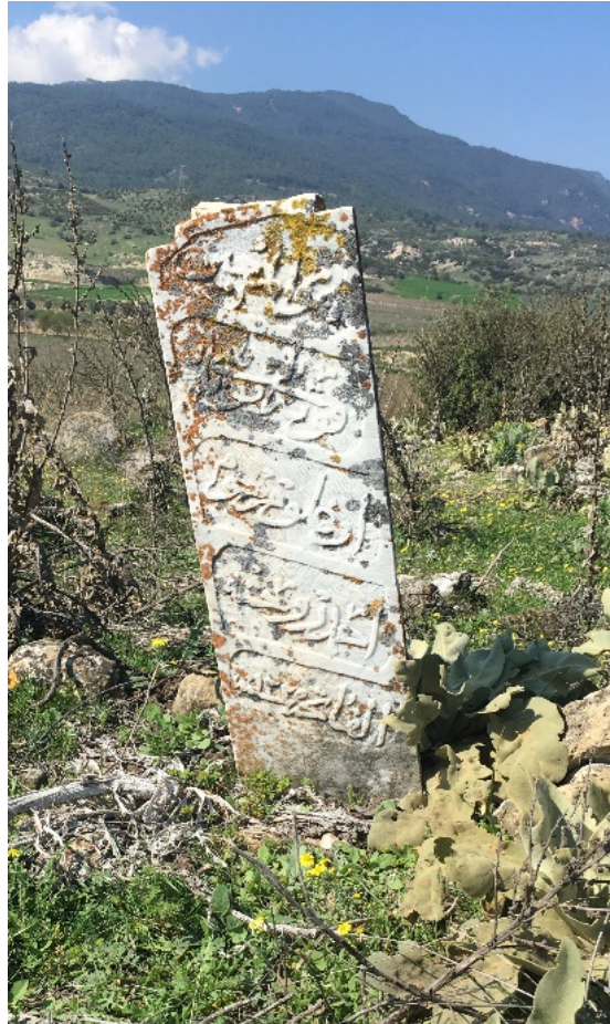
Figür 5. Mezarlıktepe Mevkii'nde yer alan Osmanlı Dönemi mezarı ve mezar taşı

Aynı alanda devşirme olarak kullanıldığı tespit edilen dikdörtgen bloklardan ve kesme taşlardan yapılmış 3 x 2.50 m'lik küçük bir mekân oluşturulmuştur. Bu dikdörtgen bloklar, olasılıkla önceki bir