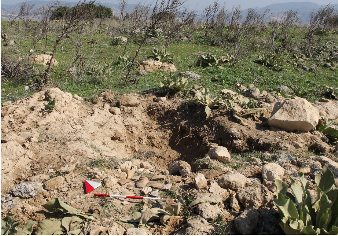
Figür 12. Mezarlıktepe Mevkii'nde tespit edilen kaçak kazı çukurları