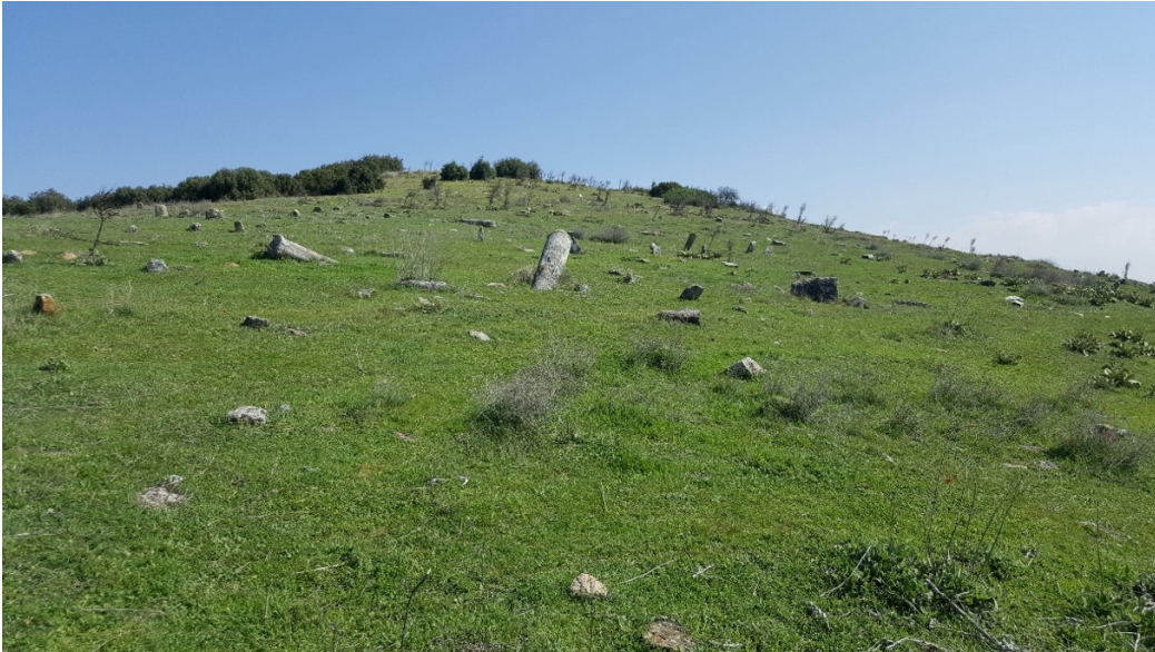
Figür 7. Mezarlıktepe Mevkii batı yamaçtan genel görünüm

Mezarlıktepe Mevkii adı verilen alanın bittiği ve yamaç bölümünün başladığı “Batı Yamaç” 255 m yükseklikle başlayıp, dik bir eğimle 230 m inerek son bulmaktadır. Burada yüzey boyunca çok sayıda mimari elemanların araziye dağılmış bir şekilde yer aldığı tespit edilmiştir (Fig. 7).