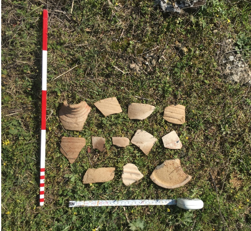
Figür 13. Mezarlıktepe Mevkii'nde tespit edilen kaçak kazı çukurları etrafında ele geçen seramik parçaları