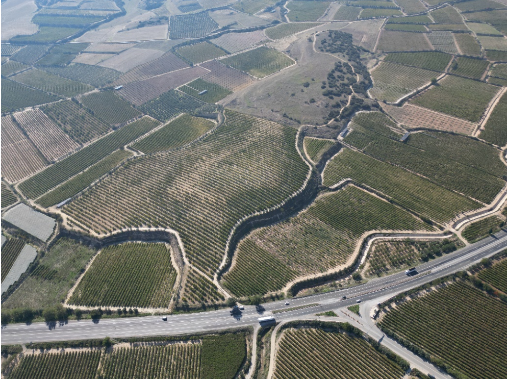
Figür 1. Mezarlıktepe Mevkii hava fotoğrafı (kuzeydoğudan)

Atik ve Koçel Erdem tarafından 2001-2003 yılları arasında Buldan ve çevresinde gerçekleştirilen “Kültür Varlıkları Envanteri” çalışmalarında adı geçen Bölmekaya Mahallesi ve üzerinde Osmanlı Dönemi’ne ait mezarların da bulunduğu Mezarlıktepe Mevkii’nde en az iki farklı yapının varlığı ile tapınak olabileceği ileri sürülmüştür (Atik, Koçel Erdem 2003: 13).