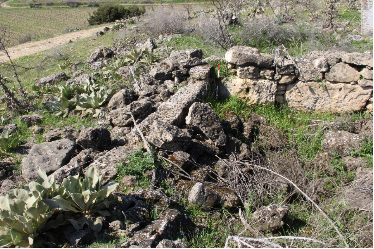
Figür 6. Tepe alanın kuzeyinde yer alan Osmanlı Dönemi mezarında kullanılan olası orthostat blokları BATI YAMAÇ

yapıda kullanılmış olan orthostat blokları olup, Osmanlı Dönemi'ne ait mezarın etrafının çevrilmesi amacıyla yeniden kullanılmış olmalıdır (Fig. 6). Mezarlıktepe Mevkii adını bu alandan aldığı düşünülürken, bu alan deniz seviyesinden yüksekliği 255 m ile batı sınırında sonlanmaktadır.