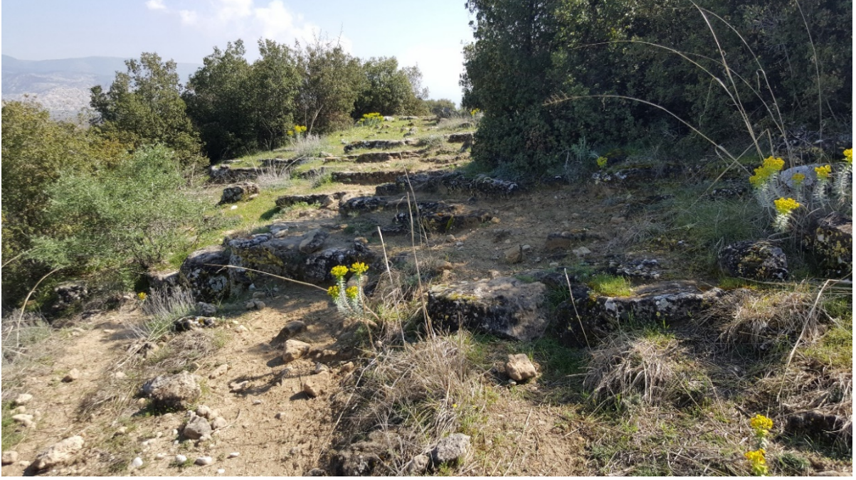
Figür 14. Kuzey yamaçta yer alan olası basamak sırası