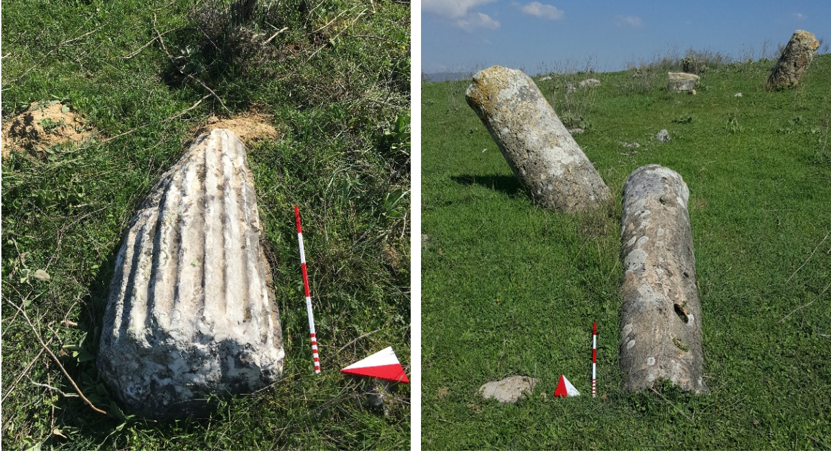
Figür 8-9. Mezarlıktepe Mevkii batı yamaçta yer alan sütun ve sütun parçaları

düz bir şekilde bırakılmıştır (Fig. 9). Aynı alanın yakınlarında köşesinde akanthus süsleme detayı olan geison parçası ve bir adet mermerden postamentli kaideye ait kırık iki parça tespit edilmiştir (Fig. 10). Mermer bloğun kuzeyinde ise 0.40 m genişliğinde 0.60 m derinliğinde 0.27 m yüksekliğinde kırık bir mermer postament yer almaktadır (Fig. 11). Doğusunda yer alan tepe yerleşimindeki Osmanlı Dönemi'ne tarihlendirilen çoğunluğu plaka şeklinde kırık ve moloz taşlardan tek ve çift sıra harçsız örülmüş duvar ile çevrelenmiş mezarların bu alanda çok daha az sayıda yapıldığı ve yamacın yüksek kesiminde sınırlandığı anlaşılmaktadır.