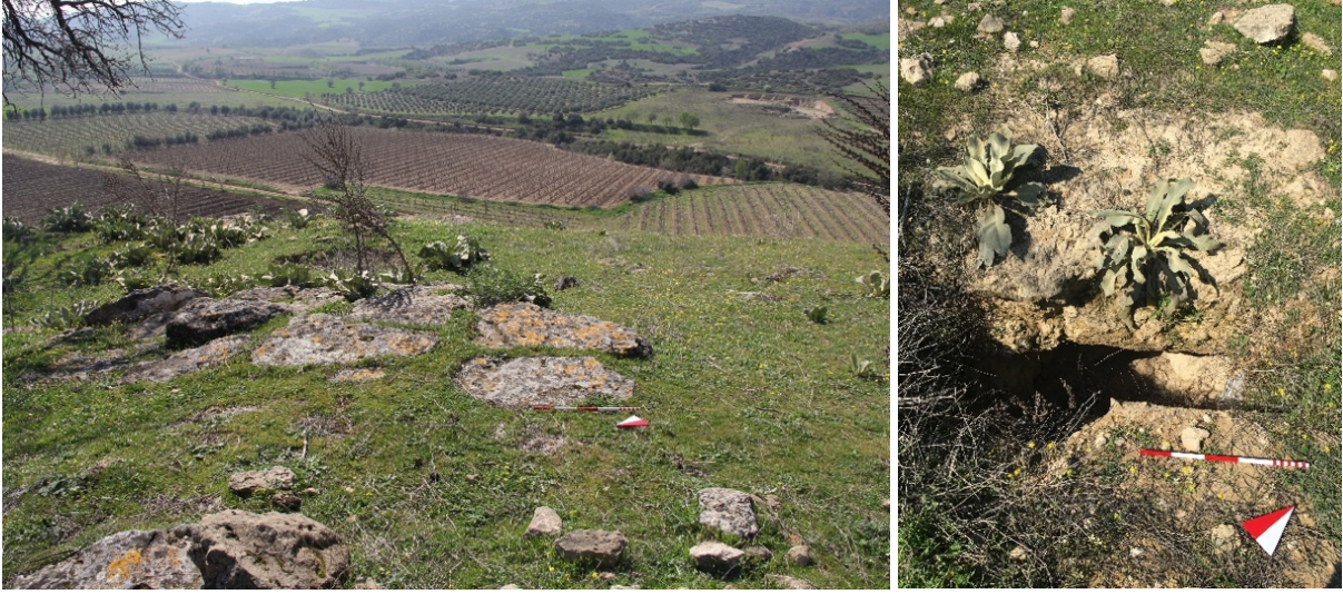
Figür 4. Mezarlıktepe Mevkii batı yarısındaki Tepe alanda olası taban döşemesi ve bu alanın kuzeydoğusundaki kaçak kazı sonucu ortaya çıkan taban blokları

almaktadır. Tespit edilmiş mezar taşlarından biri mermerden yapılmış olup, üzerinde yazıt yer almaktadır. Okunabilen bu yazıt 1909 yılına tarihlendirilmiştir 2 (Fig. 5).