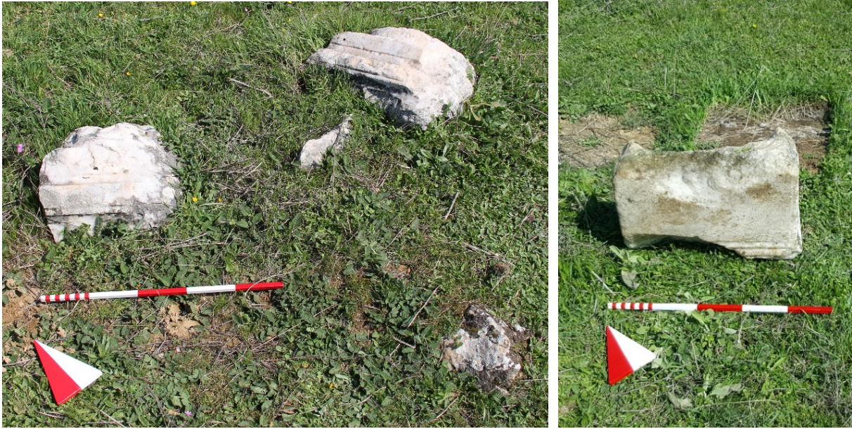
Figür 10-11. Mezarlıktepe Mevkii batı yamaçta yer alan geison ve postamentli kaideye ait parçalar

Batı alanda yer yer kaçak kazı sonucu oluşan çukurlar ile yüzeyde tespit edilen seramiklerin MS 3.-4. yy.a tarihlendirilen ağız, boyun, gövde ve kaide parçalarından oluşan günlük kullanıma ait olduğu anlaşılmaktadır (Fig. 12-13).