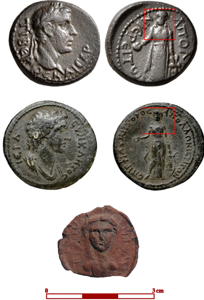
Figür 17. Arka yüzde Apollon Kitharoidos'lu Apollonos Hieron sikkeleri (RPC I: 3043-RPC IV.2: 2803) ve Tripolis'te ele geçen Apollon betimli pişmiş toprak mühür baskısı (Duman 2023: fig. 25)

cepheden betimlenen Apollon Kitharoidos'un yer aldığı, ön yüzde senato büstü olan sikkede (Fig. 17) de görülmektedir (Head 1901: Pl. III, 10).