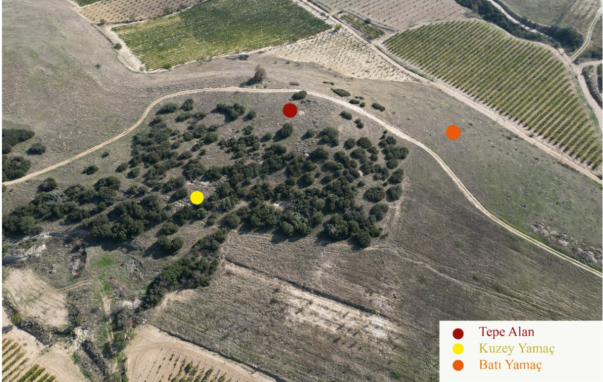
Figür 3. Tepe Alan, Batı ve Kuzey Yamaçların hava fotoğrafı üzerinde konumu

Bu bağlamda, Mezarlıktepe Mevkii'nde gerçekleştirilen araştırma kapsamında alan, daha açık bir şekilde tanımlanabilmesi amacıyla topografyasına göre "Tepe Alan", "Batı Yamaç" ve "Kuzey Yamaç" olmak üzere üç bölüme ayrılmıştır (Fig. 3).