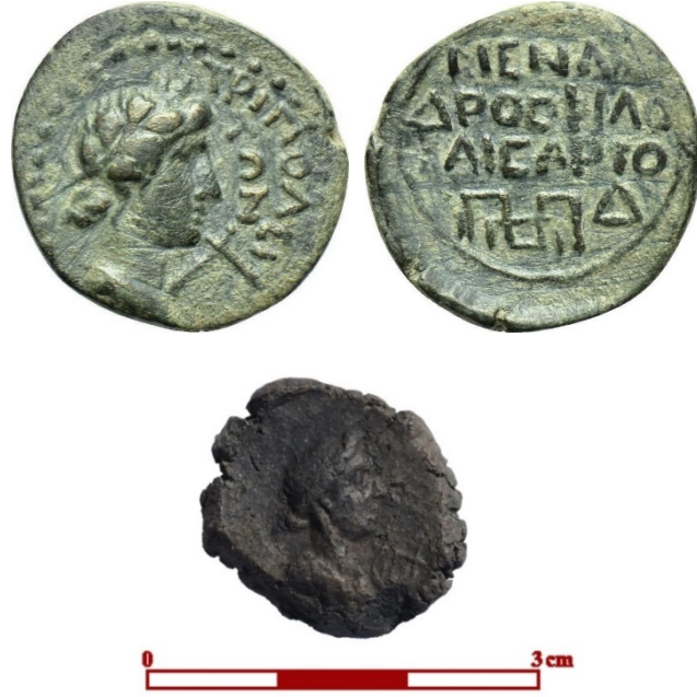
Figür 15. Ön yüzde Apollon Kitharoidos'lu Tripolis sikkesi (RPC I: 3057) ve Tripolis'te ele geçen pişmiş toprak mühür baskısı (Duman 2023: fig. 20)