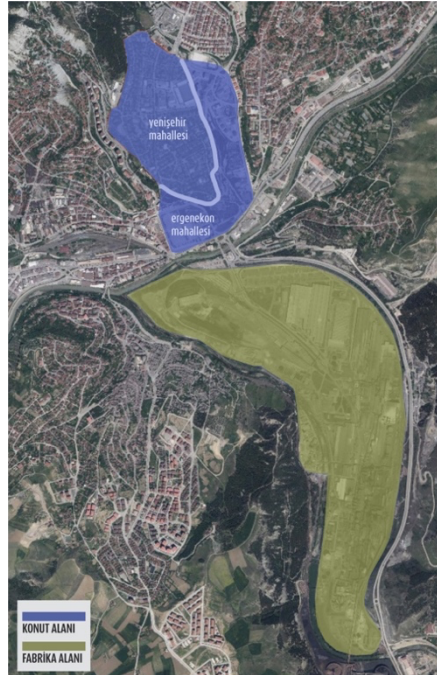
Şekil 3. Karabük Demir-Çelik Fabrika Alanı ve Konut Alanı (Nartkaya ve Dinçer, 2024, s. 10; yazar tarafından yeniden düzenlenmiştir)

Sümerbank'ın öncülüğünde Türkiye'nin ilk ağır sanayi hamlesi olarak başlatılan Karabük Demir-Çelik Fabrikası'nın inşasıyla eş zamanlı olarak, fabrikada çalışacak işçi ve mühendisler için fabrika dışında bir yerleşim alanı oluşturulmuştur. Yerleşke, sosyal ve mekânsal hiyerarşiyi gözeterek iki bölge biçiminde kurgulanmıştır (Şekil 3). Fabrikaya yakın konumlanan Ergenekon Mahallesi, alt kademe işçiler için küçük ve basit konutlardan; fabrikanın uzağında konumlanan Yenişehir Mahallesi ise üst düzey idari personel, memurlar ve mühendisler için tasarlanmış daha nitelikli yapılardan oluşur (Öktem, 2004, s. 80–87).