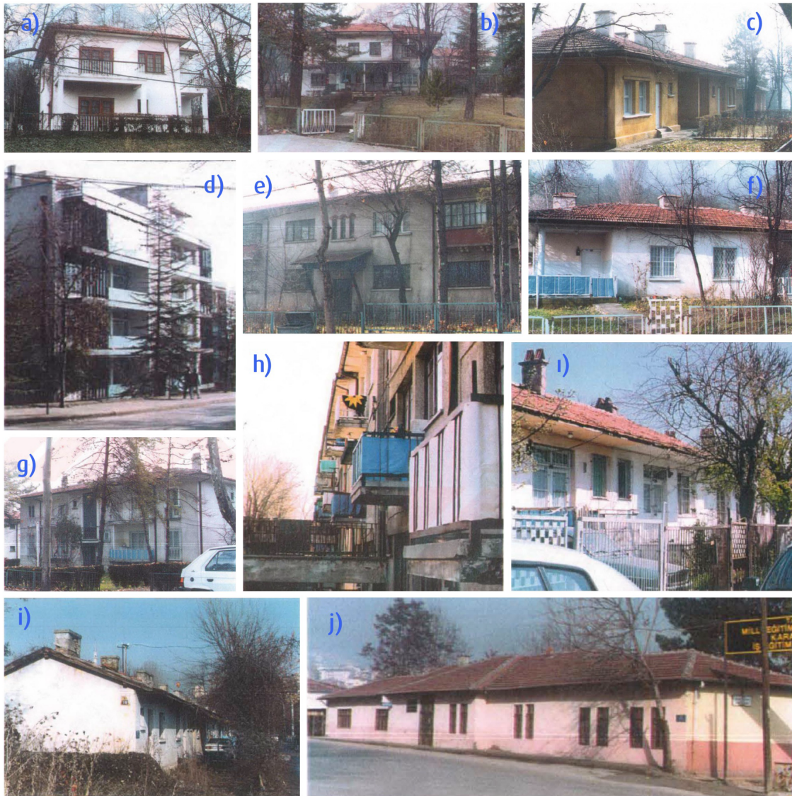
Şekil 5. Karabük Demir-Çelik Fabrikası Farklı Kullanıcı Gruplarına Ait Konut Tiplerine Konut Ait Cephe Görünüşleri. a) Genel Müdür Evleri, b) Müdür Evleri, c) Memur Evleri, d) Kübana Evleri, e) Bekar Lojmanları, f) Çamlık Evleri, g) Memur Apartmanları, h) 38 Evler, i) Yüzevler, j) Dereevler, j) İşçi Pavyonları (Öktem, 2004, s.98-116).

Memur, mühendis ve işçi gruplarının yalnızca kulüpleri değil, ulaşım araçları, yemekhaneleri ve boş zaman mekânları da birbirinden farklı biçimlerde örgütlenir (Aydın, 2018, s.279). Böylece yerleşke, çok katmanlı yapısıyla görünürde "sosyal eşitlik" izlenimi verirken, gündelik yaşam düzeyinde sınıfsal ayrımı mekânsal olarak görünür kılan bir sistem üretir.