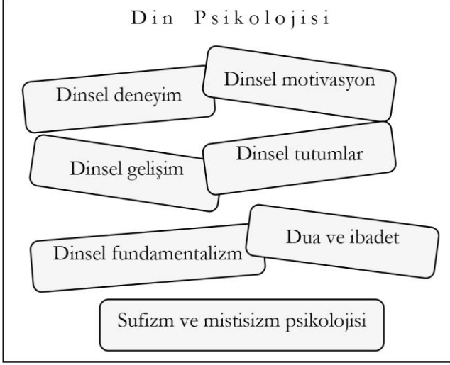
Şekil-1: Din psikolojisindeki bazı alt araştırma alanları

Bibliyografik çalışmalar, belli bir konuda ve alanda oluşan akademik birikimi göstermesinin yanı sıra farklı dönemlerde ortaya çıkan alana ilişkin dönemsel eğilimler ile bilimsel birikimi takip edip analiz edebilme adına hayati önemi haiz derleme türünden araştırmalardır. Öte yandan yine literatür taramasına dayalı yapılan bibliyografik çalışmalar, alana ilişkin akademik araştırma yapmak isteyen araştırmacıların ilk basamak referans kaynakları arasında yer almaktadırlar. Böylelikle bilimsel araştırmaların ve projelerin en önemli araçlarından biri olan bu tip çalışmalar, proje sürecinde alana ilişkin birinci ve ikinci el kaynaklara ulaşma noktasında araştırmacılara zaman kazandıran ve alanın topografik fotoğrafını çekmeye olanak sağlayan önemli araştırma türlerindedir.