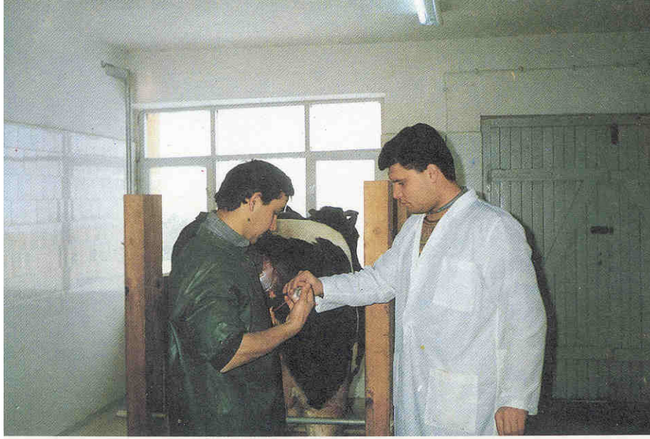
Resim 2- Uterusun Yıkanması.