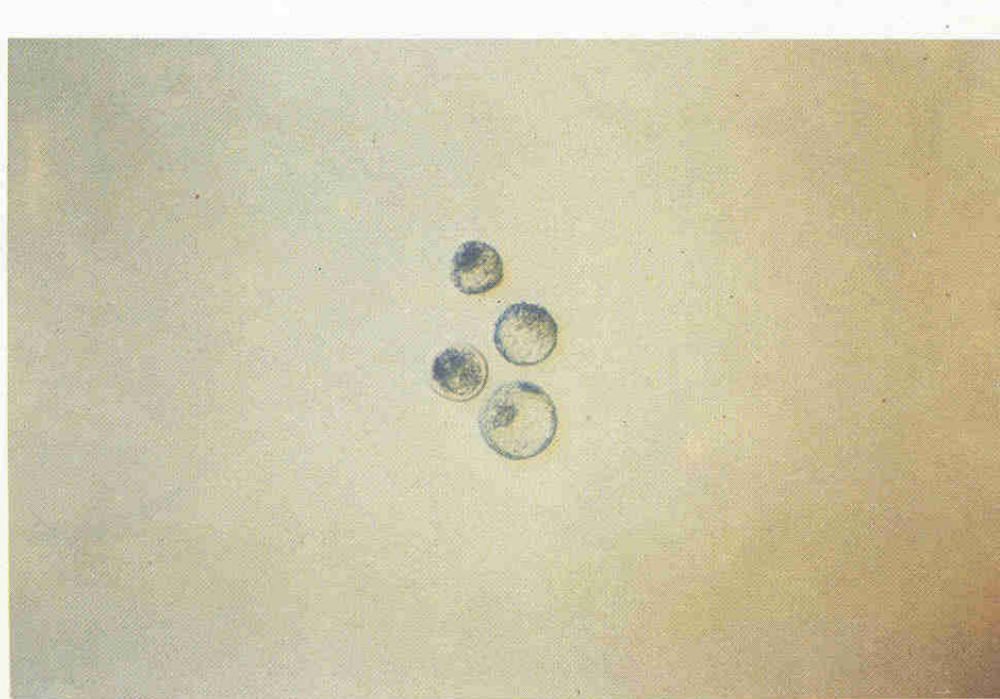
Resim 4- Blastosit safhasındaki embrioların görünümü.