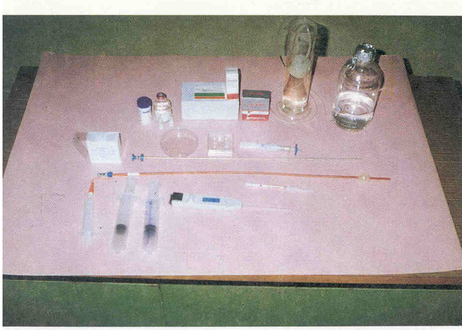
Resim 1- Embriyo toplanması ve deęerlendirilmesinde kullanılan malzemeler.