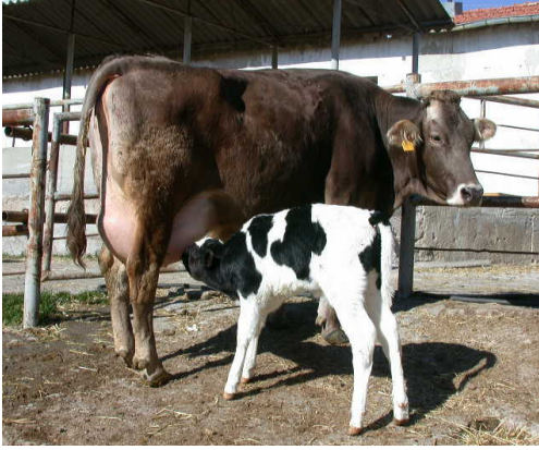
Resim 2. Taşıyıcı anne ve ET buzağı