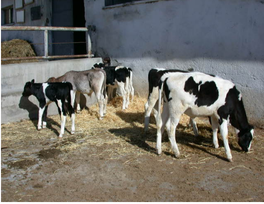
Resim 1. ET buzağları

yerleşmesi ve yaygınlaşması için yetişmiş eleman ihtiyacı karşılanarak fiziki altyapının geliştirilmesi gerekmektedir. Sunulan çalışma da, bu amaca hizmet etmiş ve başarılı bir uygulama olmuştur.