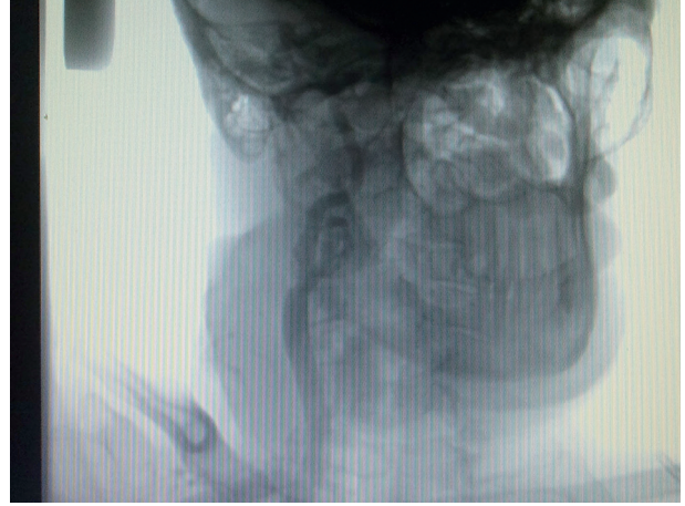
Resim 1. Sağ karotis arter bifürkasyon bölgesindeki darlığın anjiyografik görüntüsü

Stabil anjina ve baş dönmesi şikâyetleri olan 68 yaşındaki erkek hastanın çekilen koroner anjiyografisinde 3 damar koroner lezyonu ve karotis anjiyografisinde de sağ karotis bifürkasyon bölgesinde ciddi darlık (%85) tespit edildi. (Resim-1) Hastaya öncelikle karotis endarterektomi operasyonu sonrası ardından 3 damar koroner bypass operasyonu planlandı. Genel anestezi altında ana karotis, internal ve eksternal dalları damar teypleri ile dönülerek hazırlandı. Ana karotis arterde yapılan arteriyotomi sonrası darlığa neden olan ülser plağın hem internal karotis artere hem de eksternal karotis artere uzandığı, her iki dalında 5 mm'den dar olduğunu gördük. Plağı her iki daldan temizleyebilmek için hem internal hemde eksternal dala doğru arteriyotomiyi uzatmak zorunda kaldık. Geç dönem restenoz riskini azaltmak için meydana gelen 'Y' şeklindeki insizyona hastanın safen veninin proksimal kısmından hazırladığımız parçanın uç kısmını safen makası ile 2 cm. kadar keserek 'Y' şeklinde otolog bir patch elde ettik. Y şeklindeki patch'in inferiyor ucu common karotis artere, superiyordaki uçları da eksternal ve internal karotis arterlere dikilerek patchplasti tamamladık. (Resim 2 ve 3) Ardından aynı seansta hastaya 3'lü koroner bypass operasyonu uygulandı. Post operatif herhangi bir problemi olmayan hasta operasyon sonrası 7. günde taburcu edildi. Hastanın bir yıl sonra çekilen dopler ultrasonografisinde herhangi bir patoloji saptanmadı.