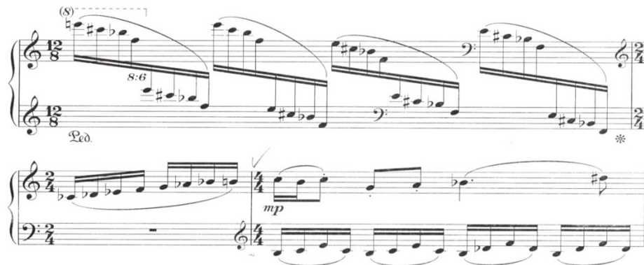
Nota 2:Azər Dadaşov I saylı fortepiano sonatinası. Bakı, 1967, A1 bölüm.

Sol əldə təkrarlanan səslənmələr ilk baxışdan müasir yazı texnikası prinsipini özündə daşmasını aydın şəkildə üzə çıxır. Burada əsasən sekunda və kvarta prinsipinə əsaslanan üç xord birləşmələr, bəzən isə səslər arasında üç tonun başverməsi bəstəkarın invensiya tipli faktura yaratması xüsusiyyəti əks olunur. A bölümü ilə A1 bölümü arasında 12/8 ölçüdə bağlayıcı partiya səslənir və burada minimalizm elementlərinə rast gəlinir. Lakin 2/4 ölçüdə əvvəl bütöv tonlu, sonra isə orta bütöv tonlu səslənmələrə rast gəlinir.