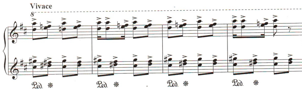
Nota 13:Azər Dadaşov 3 saylı sonatina. Bakı, 1991. III hissə

Əsərin sadə III hissəsi quruluşda a+a_1+a_2+b+a_3+a_4 şəklində təqdim olunur. Bu hissə Allegro scherzando tempində 4/4 ölçüdə başlayır. Sağ və sol əldə verilən paralel səslənmələr dissonas səslə üzərində qurulmuşdur. Bu cəhət əsərin yarıserial şəkildə qurulmasından xəbər verir. lakin burada da rast və segah intonasiyalartından istifadə olunmuşdur. Xrommatik səslərin verilməsi ilə re rast və fa diyez segah məqamlarının səssıralarına oxşarlıq özünü biruzə verir.