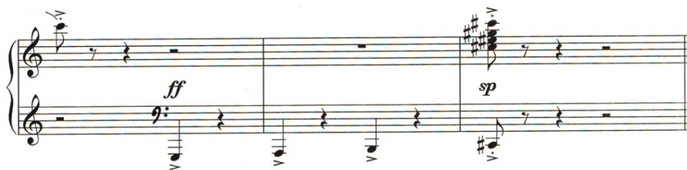
Nota 10:Azər Dadaşov 2 saylı sonatina. Bakı, 1983, III hissə, repriz bölümü.

A.Dadaşovun III saylı sonatınası 1991-ci ildə bəstələnmişdir. Sonatina Allegretto festivo tempində, 2/4 ölçüdədir. Əsər rondo formasında, a+a 1 +b+a 2 +c+a 3 quruluşundadır. Burada refren əvvəldə verilərək 2 dəfə təkrar edilir. Həmçinin bu əsərdə ikisəsli ifa tərzii ilə bərabər, həm də homofon-harmonik və polifonik elementlərə də rast gəlinir. Əsər rast intonasiyası üzərində olub, re rast məqamının səssirasına uyğunluq təşkil edir. Burada re rasta məxsus üçşaq, şikəsteyi-fars pərdələrinə istinad olunur.