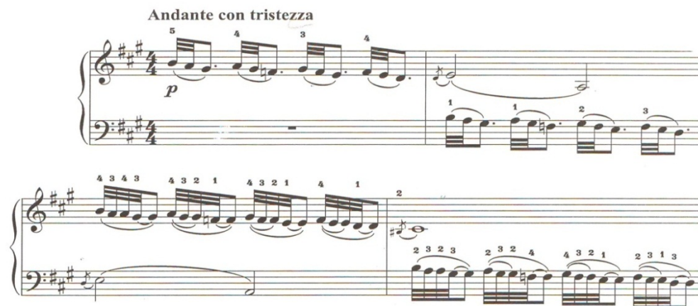
Nota 8:Azər Dadaşov 2 saylı sonatina. Bakı, 1983, II hissə a bölümü.

Bu seriallaşmanın dodekafonik səssirasına nəzər salsaq, marahlı mənərənin şahidi olarıq. Bəstəkar a hissədə sanki seriallaşma təbəqələrini birləşdirilmiş dodekafoniya əsasında təqdim etməyə çalışır. Lakin burada hər bir fraza adlarının sadələdiyimiz muğam intonasiyalarına əsaslandığından 1-ci fraza şüştər, 2-ci fraza segah intonasiyalarına aid edilərək sual cümləsi xarakterində təqdim edilir. Burada şüştər intonasiyası mi şüştər, segah intonasiyası isə do diyez segah məqamının səssirasına uyğun olur.