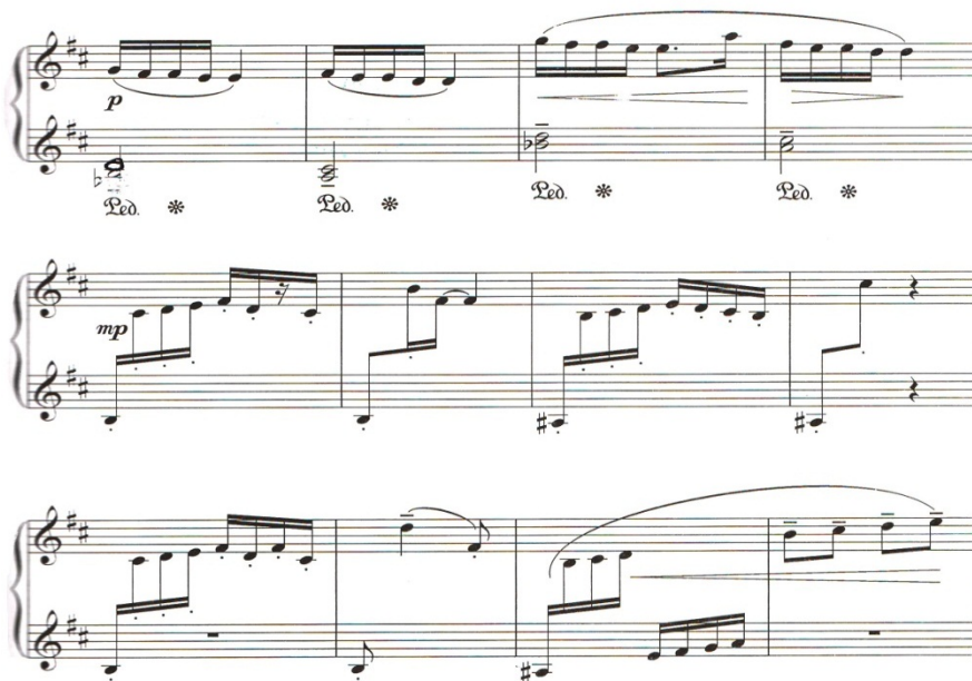
Nota 11:Azər Dadaşov 3 saylı sonatina. Bakı, 1991. Əsas bölüm.

Lakin, burada b bölümü periodunda bəstəkar tərəfindən genişlənmiş perioddan istifadə edilmişdir. Bu cəhət bəstəkarın öz fərdi təfəkkürünün məcmusu kimi diqqət cəlb edir. Burada sual cümləsindən fərqli olaraq, cavab cümlə 2 dəfə variantlı şəkildə təkrar olunur. İnci dəfə təkrar olunan cümlədə keçid səslərinə rast gəlinir ki, bu da yenidən a bölümü refreninin təkrarı ilə bağlı olur. Əsərin fakturasında rast gəlinən lya diyez səsi isə re rastın səssirasında özünə yer alan si bemol alterasiya səsi ilə enharmoniklik təşkil edir.