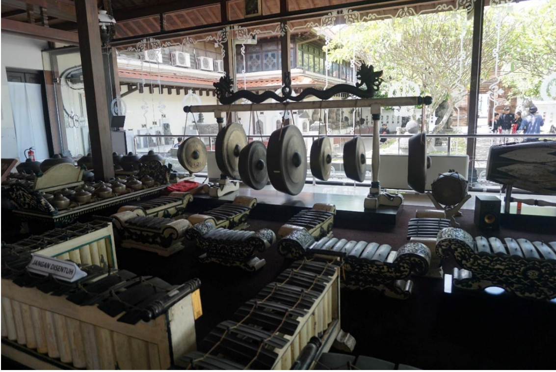
Fotoğraf 1. Sonobudoyo Müzesi, Cava Gamelan Koleksiyonu, Yogyakarta, Endonezya (25.06.2023)