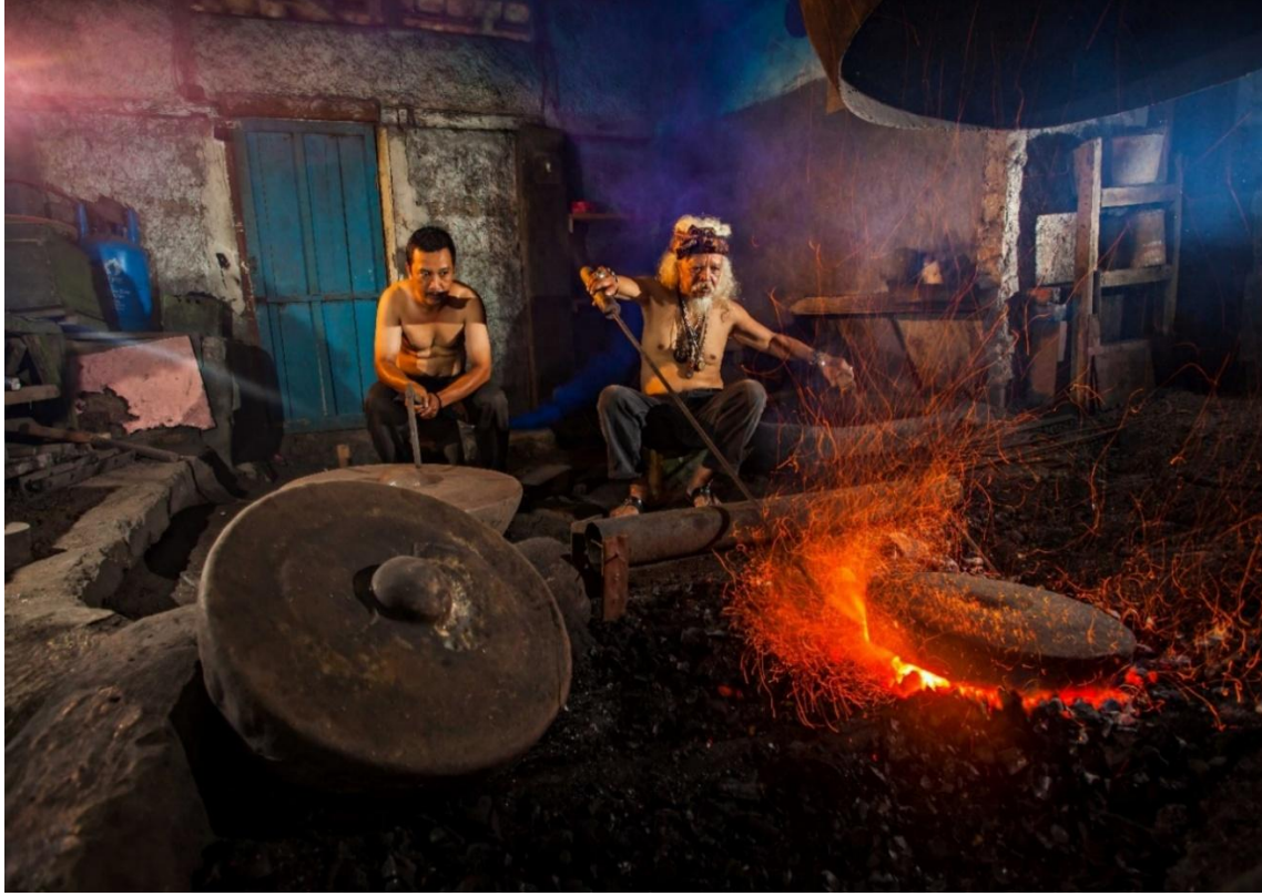
Fotoğraf 2. Geleneksel bir gamelan çalgısının yapım süreci; sanatçılar atölyede gamelanın bir parçası olan gong yapıyorlar. Cimahi Köyü, Batı Cava, Endonezya (01/2017)

somut birleşimine dönüşür. Bu süreçlerde kolektif çalışma, usta-çırak kuşağı arasında bilgi aktarımını canlı tutar; empu figürü, teknik rehber ve ritüelin taşıyıcısıdır.