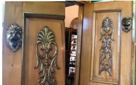
Fotoğraf 13-14: Türbe Odasının Kapılarında Bulunan Aslan ve Hayat Ağacı Motifi (kişisel arşiv)

Sandukanın bulunduğu odanın kapı kanatlarında hayat ağacı ile birlikte yine sarı renkli bir metalden yapılmış aslan sembolü bulunmaktadır (Fotoğraf: 13-14).