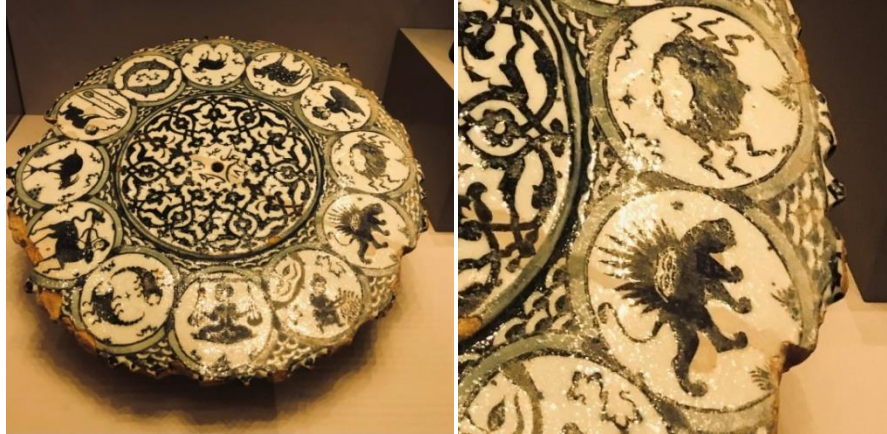
Fotoğraf 6-7: Pergamon İslam Sanatları Müzesi, İran'dan Burç Tabağı, Berlin

İslamiyet'in tasvir sanatını reddettiği yönündeki anlayışın aksine, çoğu İslami toplumun görsel anlatılar kullandığı ve İslam dinin yaygınlaşmasında da bu görsellerden yararlandığı da bilinmektedir. Farsça'da aslan anlamındaki şîr ve güneş anlamındaki hûrşîd kelimelerinden oluşan Şîr ü Hûrşîd birleşimi, bir gök cismi olan güneşin yanı sıra aslan burcu gerdûn şîri ve sipihr şîri anlamıyla da göksel bir birleşimi de ima etmektedir. Güneş ve aslan anlamında Mihr ü Şîr şeklinde de ifade edilen bu terkiibi oluşturan kelimelerin Arapça karşılıkları şems ve esed ile yine aslan anlamında kullanılan haydar kelimeleri de Şîr ü Hûrşîd tasvirinin kökeni ve içeriği bakımından da önemlidir (Tutaysalgır ve Arı, 2023:434-453). Aşağıdaki görselde bulunan seramikte on iki burç tasvir edilmiş, aslan burcu ise bir aslan ve arkasında bulunan yarım bir güneşle simgelenmiştir (Fotoğraf: 6-7).