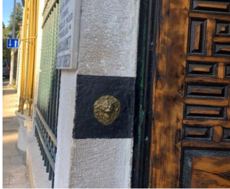
Fotoğraf 12: Karaca Ahmet Sultan Türbesi’nin Giriş Kapısında Bulunan Aslan Sembolü

Karaca Ahmet Sultan Türbesi’nin giriş kapısında kabartma bir aslan simgesi yer almaktadır (Fotoğraf: 12).