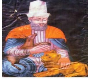
Fotoğraf 15:Hacı Bektâş-ı Velî'nin XV. yüzyılda Yapılmış Kök Boya Resmi (Hacı Bektaş Müzesi – Hacibektaş/Neşehir) 15

Dergâhta bulunan camekân içerisinde sergilenen eşyalar arasında Hacı Bektaş Veli'nin aşağıdaki resminin bulunduğu dekoratif bir tabak da yer almaktadır. Bu görselde bir aslan Hacı Bektaş'ın dizi dibinde oturmaktadır (Fotoğraf: 15).