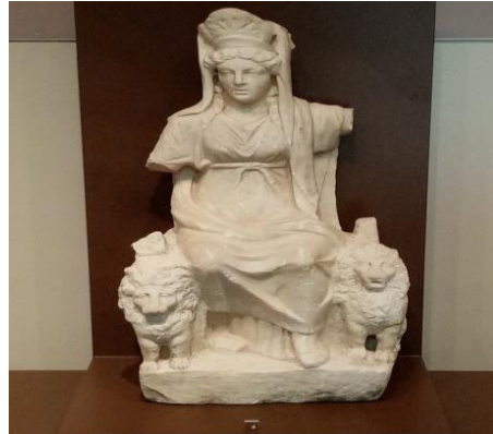
Fotoğraf 4: Pessinus Antik Kenti’nden Çıkarılmış Kibele Heykelciği (MÖ 30 - MS 395) 8

Hitit tanrıçası Kibele de iki yanında aslanla betimlenir (Fotoğraf: 4). Hitit sanatında heykelin çok büyük bir yeri vardır. Özellikle şehir kapılarında bulunan aslan ve sfenkslerin şehri düşmanlardan koruduğuna inanılırdı. Boğazköy’de bulunan Aslanlı Kapı’da yer alan aslan figürleri, Yeni Hitit döneminde form olarak klasikleşmişlerdir. Örneğin, kübik bir aslan heykelinin en önemli kısmı baş bölümüdür. Bedenin üçte birini oluşturan baş, ayrıntılı bir biçimde tasvir edilmiştir. Hitit aslanının karakteristik yüz şekli genellikle açık, saldırı anında betimlenmiştir. 7 (Fotoğraf: 5).