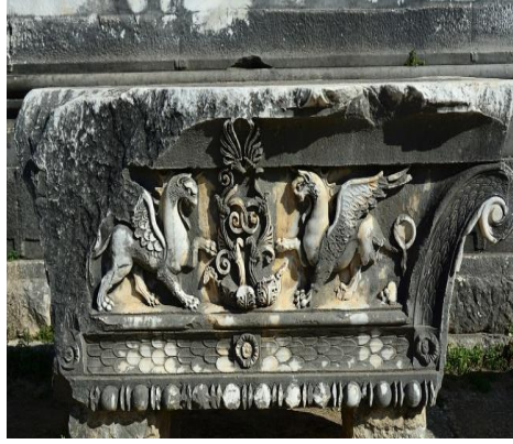
Fotoğraf 3: Grifonlar (aslan gövdeli, kartal kanatlı ve insan başlı mitolojik yaratık) (Didyma) 6

nihayetinde ‘mezar bekçisi’ olmuştur. Dönemin inancına göre Ekhidna ile Orthos’un çiftleşmesinden ortaya çıkan bu kanatlı varlıklar; şehirlerin, sarayların ve önemli kişilerin koruyucusu olarak görev yapmışlardır. Bu varlıklar da Mısır sfenkslerinde olduğu gibi şehirlerin hemen girişinde konumlandırılmış; ziyaretçilere cevabı zor soru ve bilmeceler sorarak onları tuzağına düşürmeleriyle ünlenmişlerdir. Antik Yunan kültürünün önemli tapınma yerlerinden biri olan Apollon ve çevresindeki aslan figürleri yoğun olarak kullanılmıştır (Fotoğraf:3). Mitlerde tanrıların koruyan aslan, burada da tapınağın güvenliğini sağlamaktadır (Tutaysalgır ve Arı, 2023: 434-453).