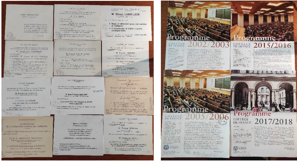
Resim 6: Kolej profesörlerinin geçmiş yıllarda vermiş oldukları konferansları duyuran afişler ve ilan metinleri ile Kolej'in yıllık programlarını gösteren broşür örnekleri.