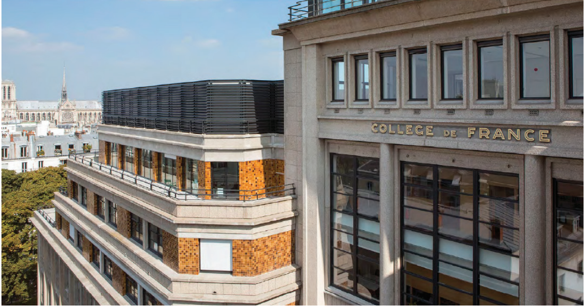
Resim 5: Kurumun “11, place Marcelin-Berthelot, 75231” Adresinde Bulunan Teras Çatılı Binası

Kurumun diğer binaları ise yine 5. Paris’te, “3 rue d’Ulm, 75231, 52 rue Cardinal-Lemoine, 75231” ve “49bis Avenue de la Belle Gabrielle, 75012” adreslerinde bulunmaktadır.