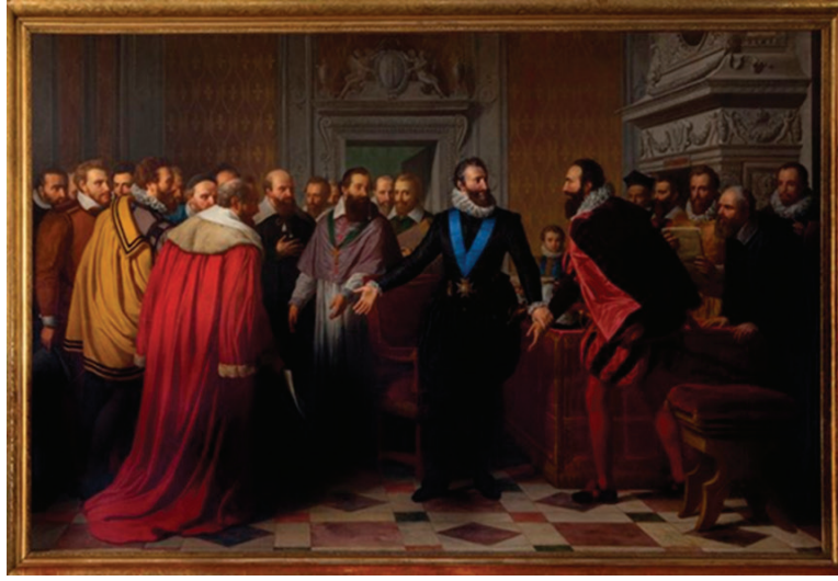
Resim 2: Charles Thévenin'in 1827 tarihli tablosu "Henri IV, Collège Royal'ı inşa etmeye karar veriyor" (Louvre Müzesi). Kral IV. Henri'nin 1610'da binanın temelini atılma anını betimleyen bu resim, Kolej'in erken dönem mimari gelişimini simgeler. (Kaynak: 5 centuries of history Erişim: 11.11.2025 https://www.college-de-france.fr/en/the-college-and-its-history/5-centuries-of-history )

Kolej'in devlet siyasetinin bir parçası olmasının olumlu olduğu kadar olumsuz yönleri bulunmaktaydı. Nitekim 17. yüzyıldaki "Grand Siècle" [26] olayları bu kurumu da etkilemiştir. [27] 1648'den 1653'e kadar süren, bazı soyluların kraliyete karşı muhalefetini içeren ve ardından yüzyılın sonunda Fransa krallığını Avrupa'nın bir kısmıyla karşı karşıya getiren "Fronde" adı verilen bu iç savaş, öğretmenlerin maaşlarının düzenli olarak ödenmesini engellemiştir. Bu yüzden arşivler binaların hızla harap olduğuna tanıklık edilmiştir.