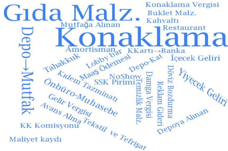
Şekil 1. Konaklama İşletmeleri İçin Örneklenen Mali Nitelikli İşlemler

Üç belge grubundan mali nitelikli işlemlerinin dâhil edildiği analiz sonucunda toplam 19 tema elde edilmiş ve temalar Tablo 2'de verilmiştir. Elde edilen temalar üç ayrı belge grubundan yapılan kod atamalarını içermektedir. Konaklama muhasebesi belge grubunun ana temaları; rezervasyon, alışlar, malzeme hareketleri, satışlar, personel işlemleri, para hareketleri, amortismanlar ve döviz işlemlerinden oluşmaktadır. Bu temaları oluşturan 30 kod, kod bulutu şeklinde Şekil 1'de sunulmuştur. Konaklama işletmelerinin günlük faaliyetlerinin Şekil 1'de sunulan kod bulutu ile temsil edildiği görülmektedir (Şengel, 2018).