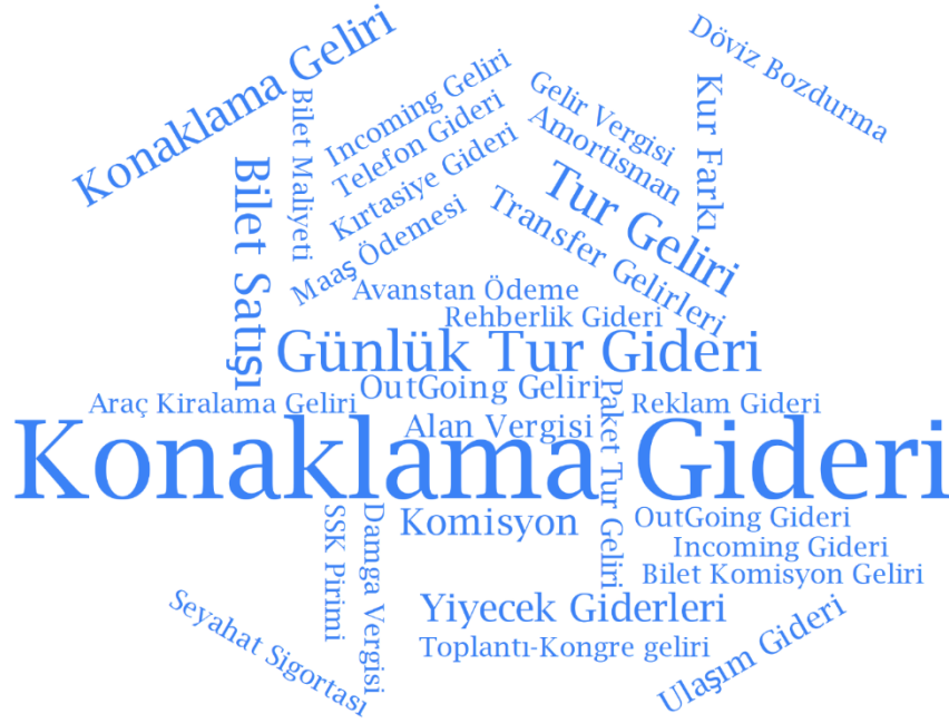
Şekil 2. Seyahat Acentaları İçin Örneklenen Mali Nitelikli İşlemler

Diğer bir turizm işletmesi olan seyahat acentalarının günlük faaliyetleri, işlerinin gereği konaklama işletmeleri muhasebesinden ayrılmaktadır. Seyahat acentaları muhasebesi kapsamında verilen örnekler; rezervasyon, personel işlemleri, bilet işlemleri, günlük turlar, döviz işleri, paket turlar ve amortismanlar olmak üzere 7 tema altında gruplanmıştır. Bu temaları oluşturan 32 kod, kod bulutu şeklinde Şekil 2’de sunulmuştur. Seyahat acentaları turizm sektöründe aracı kuruluş olmaları nedeniyle bir ürünü almakta ve komisyon alarak ya da satış fiyatı oluşturarak satmaktadır. Bunun için seyahat acentalarında alış ve satış işlemleri için ayrı tema oluşturmak yerine, (örneğin, paket tur alış ve satışı paket turlar içinde) yapılan günlük turlar, paket turlar, bilet işlemleri gibi yapılan işleme ait temalar altında incelenmiştir. Seyahat acentalarının ayrıca paket tur ve günlük tur organize etme ve satma görevleri bulunmaktadır. Ancak incelenen belgelerde bu konulara ait örneklerle ulaşılamamıştır.