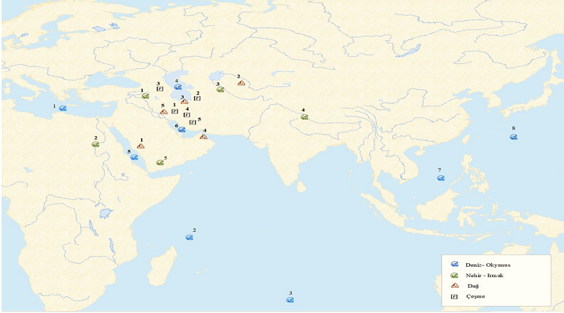
Harita 1: Acâibü'l-Mahlûkât 'ta Geçen Yerlerin Haritadaki Dağılımı 7

Azerbaycan 'daki çeşmeden akan su, bir kaba konulduğunda su donar. Şiraz 'daki bir dağda bir çeşme vardır. Bir kişi bu çeşmeye pislik bıraksa su, bu pisliği bırakan kişinin peşinden gider; yetişirse onu boğar, yetişemezse geri yerine gelir. Cürcan 'daki çeşmeden su alınmaya gidilip de yoldaki canlılardan biri (kurtcağız) öldürüldüğünde su kaplarının hepsi kokar, çürür. Su dökülüp yol üzerindeki bu canlılar (kurtcağızlar) kaldırıldığında ancak kolay bir şekilde su alınabilir. İsfehan ile Şiraz arasındaki çeşmeden bir kap ile su alınsa ve bu su kabı yere konulursa orada bu suyu seven sığırcık kuşları olur. Bu kuşlar, o suyun üzerinden hiç gitmezler. Bakır kapla bu çeşmeden su alınsa kuşlar da peşine gider; nerede çekirge olsa kuşlar bu çekirgeleri helak ederler. Nihavend 'de bir çeşme vardır. Suyu ihtiyacı olan bir kişi, uzaktan suya ihtiyacı olduğunu söylese su, o kişinin peşine gider. Sonrasında o kişi, su ihtiyacının giderildiğini söylediğinde su tekrar yerine döner.