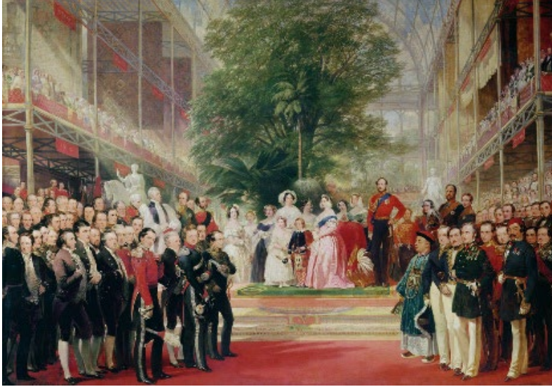
Resim 3. Henry Courtney Selous tarafından yapılan ve 1851 Londra Sergisi'nin açılışını gösteren tablo 45

Bu gecikmelerden den dolayı Osmanlı Devleti'ne ait ürünler Kristal Saray'a acele bir şekilde yerleştirilebilmiştir. Hyde Park'ta yer alan sergi Sarayı'nın Osmanlı teşhir alanı, Zohrab Efendi 43 ve Major'un denetimi altında düzenlenmiş olup, Osmanlı ürünlerinin Londra Sergisi'ne geç gelmesi sebebiyle eşyaların listeleri ilk katalogda yer almamıştır 44 .