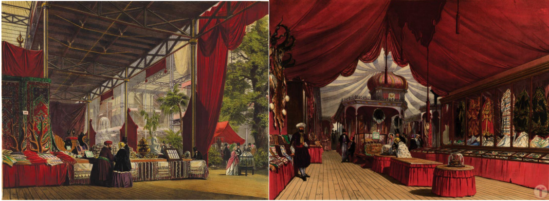
Resim 4. Londra Sergisi Osmanlı standından görüntüler 50

Bu sergideki ürünler; temel olarak bitki, hayvan ve mineraller gibi üç ana grubun yanı sıra ham madde ve üretilmiş eşya kategorileri kapsamında, toplam beş bölümde 3.300 civarında obje içermektedir 48 . Bu ürünlerin 1.300'ü sanayi ürünleri arasından seçilmiştir 49 .