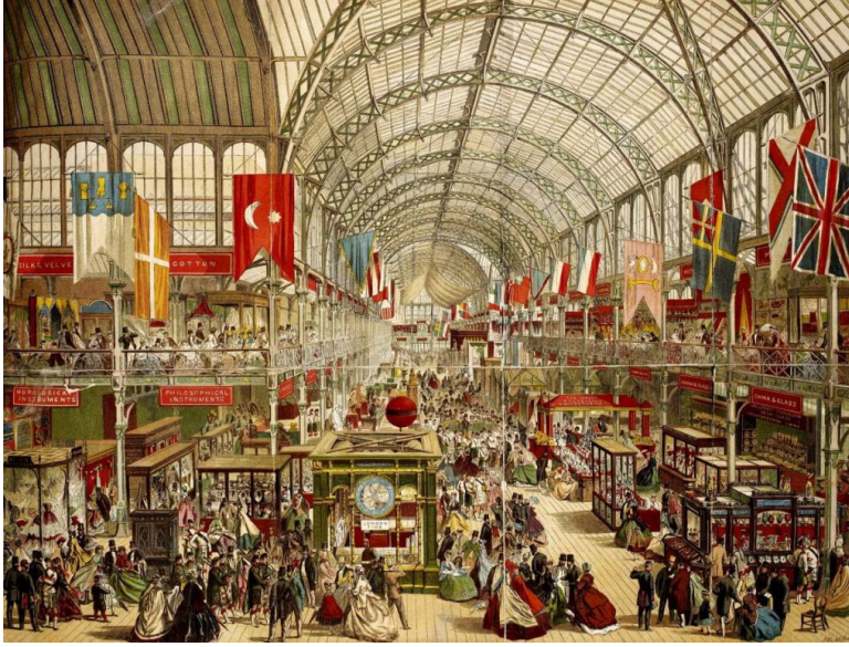
Resim 1. 1851 Londra Dünya Fuarı ve Kristal Saray 12

Serginin düzenlenmesinde Fransa'daki millî sergilere katılan İngiliz resmi kurum çalışanlarından biri olan Sir Henry Cole, dönemin kraliçesi Victoria'ya öneride bulunmuştur. Başlangıç olarak daha küçük çapta düşünülse de ürün tercihi ve dünyanın çeşitli yerlerinde sergilenen uygun fiyatlı ürünlerin sunulması ile Londra Sergisi, evrensel boyutlara ulaşmıştır 13 .