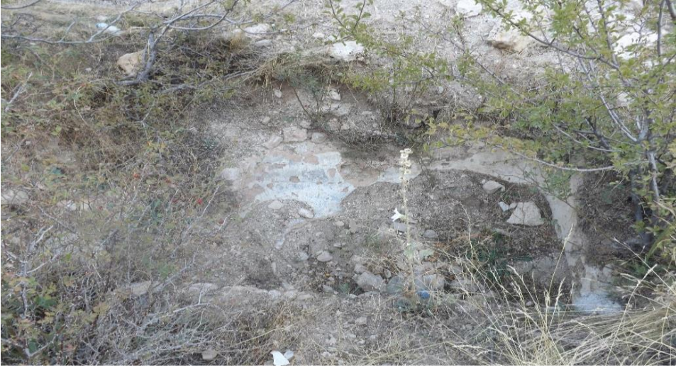
Foto 6. Asar Kale (Balkayalar Kalesi) Üzerindeki Bir Kalıntı (Ekim 2017)