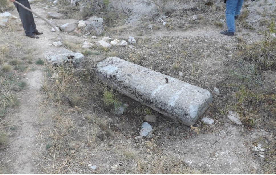
Foto 5. Asar Kale (Balkayalar Kalesi) Üzerindeki Bir Kalıntı (Ekim 2017)