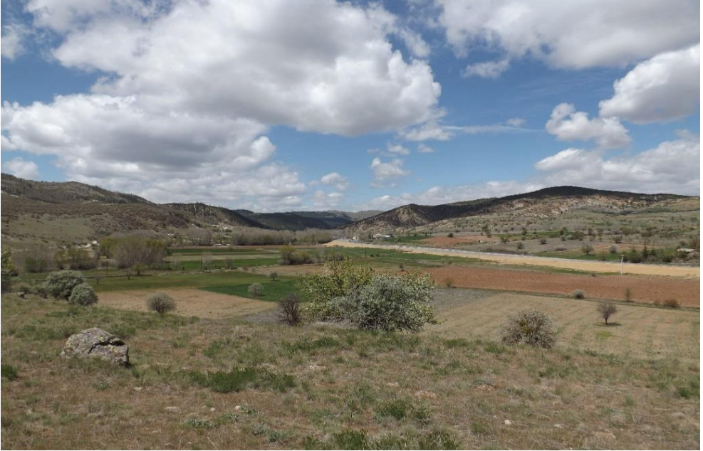
Foto 9. Höyük Tepe'den Bağırsak Boğazı'nın Konya Çıkışı. (Mayıs 2014)

Süryanî Mihael'e göre öncülerin geçtiği boğaza onları izleyerek gelen ve dâhilinde insanlar ile hayvanlar için gerekli erzak ve malzemeyi, savaş araçlarını taşıyan 5000 araba ile Bizans ordugâhını 50.000 Türk yağmalamıştır. 53