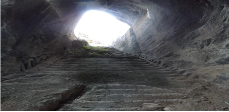
Foto 8. Asar Kale Kuzeydoğusundaki Yerli Kayaya Oyulmuş Merdiven (Ekim 2017)

Üç taraftan dik olan kayalık yüzey sebebiyle ancak kuzey tarafından ulaşmak mümkündür ve bu kesimde sur kalıntıları ile bir tapınak sahasına ait izler mevcuttur. Kalın duvarlarının harcında kireç kullanılmış olduğu görülür. Ayrıca, dâhilinde bir sarnıç ve bir de merdiven (Foto 8) mevcuttur.