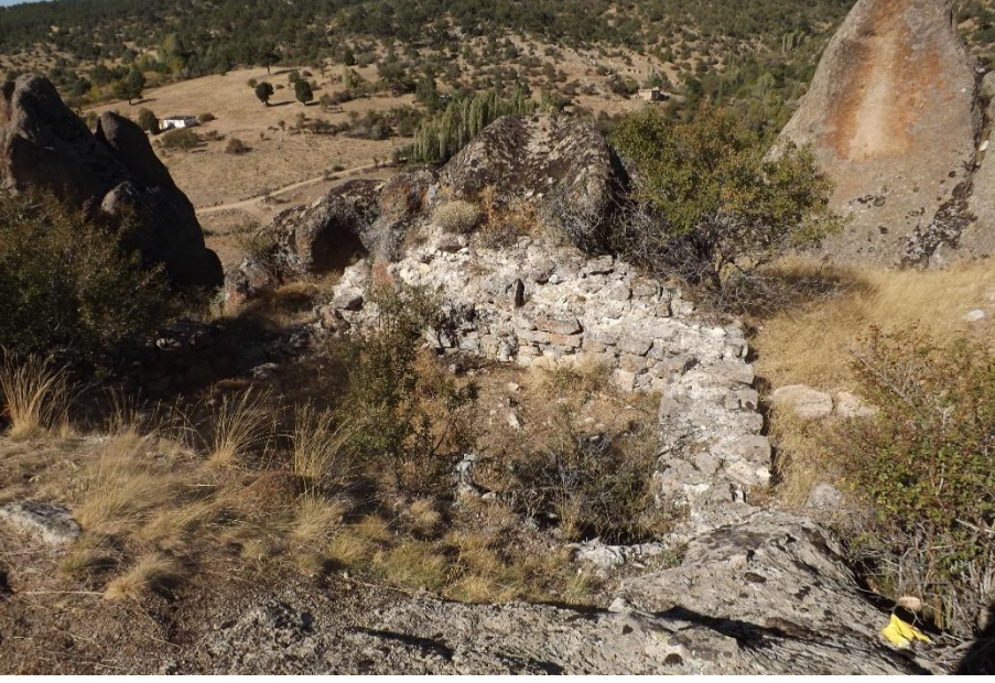
Foto 3. Asar Kale (Balkayalar Kalesi) Üzerindeki Bir Kalıntı (Ekim 2017)