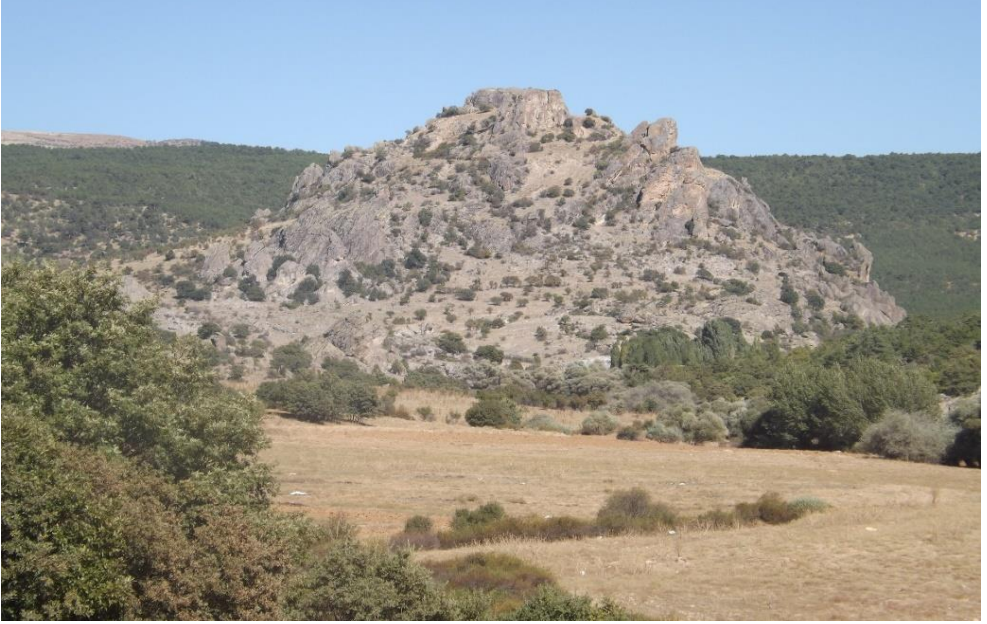
Foto 2. Asar Kale'ye (Balkayalar Kalesi) Ait Bir Görünüm. (Ekim 2017)

Çapı 750 m. olan yaklaşık 100 metrelik doğal kayalık bir yükselti üzerinde yer alan kalıntılardan buranın Demir Çağı'ndan itibaren kullanıldığı tespit edilmiştir. Heinrich Swoboda'ya göre yüzey buluntuları, burada geç Roma ve erken Bizans dönemlerinde bir kalenin mevcudiyetini göstermektedir. 49 Ekim 2017'de yapılan araştırma sırasında üzerinde tesadüf edilen kimi kalıntılar fotoğraflanmıştır (Foto 3, 4, 5, 6 ve 7).