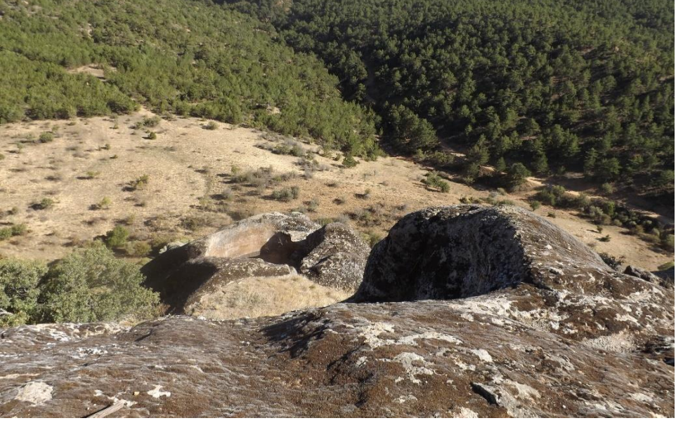
Foto 7. Asar Kale (Balkayalar Kalesi) Üzerindeki Bir Kalıntı (Ekim 2017)

Üç taraftan dik olan kayalık yüzey sebebiyle ancak kuzey tarafından ulaşmak mümkündür ve bu kesimde sur kalıntıları ile bir tapınak sahasına ait izler mevcuttur. Kalın duvarlarının harcında kireç kullanılmış olduğu görülür. Ayrıca, dâhilinde bir sarnıç ve bir de merdiven (Foto 8) mevcuttur.