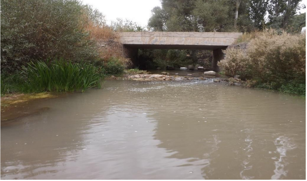
Foto 10. Boğazın Batı Çıkışında Yunuslar Köyü Yakınında Derin Olmayan Yatağında Akan Bağırsak Çayı'nın Bir Görünümü (Ekim 2017)