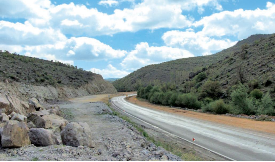
Foto 1. Duble Yol Yapım Çalışmalarının Kuzey Yamaçları ve Vadi Tabanının Doğal Görünümünü Değiştirdiği Bağırsak Boğazı'nın Darlaştığı Yerden Eski Bir Görünümü. (2014 Mayıs)

“Geçmek isteyecek olurlarsa Bizanslılar’a derhal karşı koymak üzere birliklerini bu dar geçide doldurdu. Tzibritze Geçidi yüksek yamaçlarla çevrelenen uzun bir vadidir. Kuzeye doğru gittikçe dikliği azalır ve yavaş tepeler arasında geniş vadiler halini alır. Güneye doğru ise vadi gittikçe dikleşir ve sarplaşır.” 39