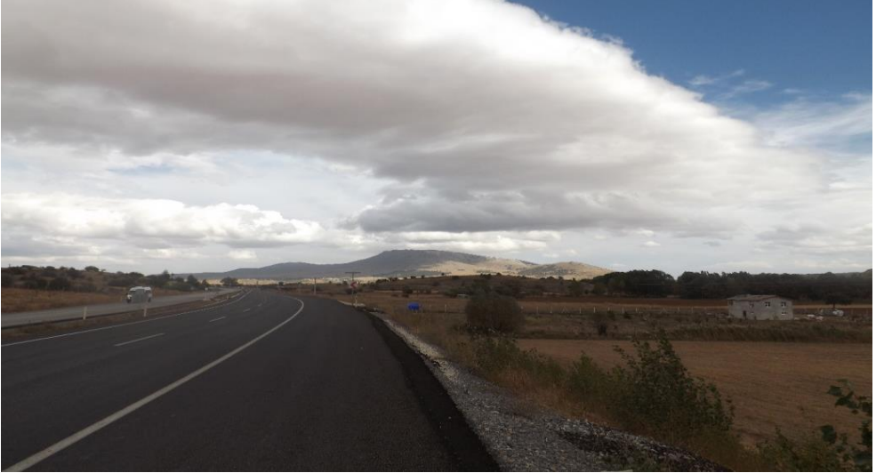
Foto 11. Boğazın Konya Çıkışındaki Yayoan Tepeye (Höyük Tepe) Ait Bir Görünüm. (Ekim 2017)