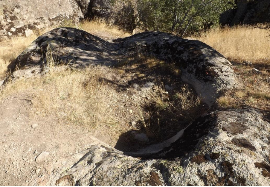
Foto 4. Asar Kale (Balkayalar Kalesi) Üzerindeki Bir Kalıntı (Ekim 2017)