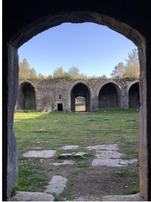
Şekil 6: Kargihan orta avlu