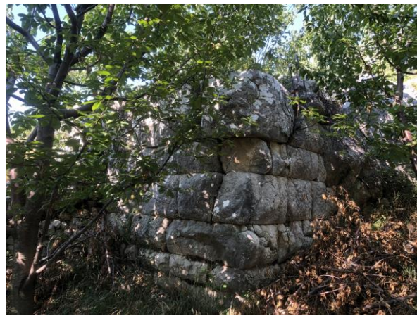
Őekil 9: Burma Han olduĐu d Ő n len duvar kalıntısı