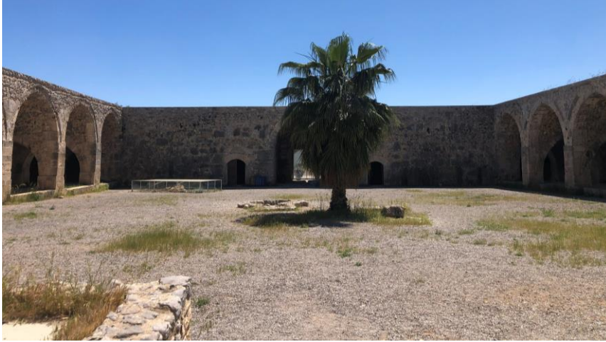
Şekil 14: Kırkgöz Han