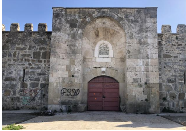
Şekil 2: Şarapsa Han kuzey cephede bulunan taş kapı