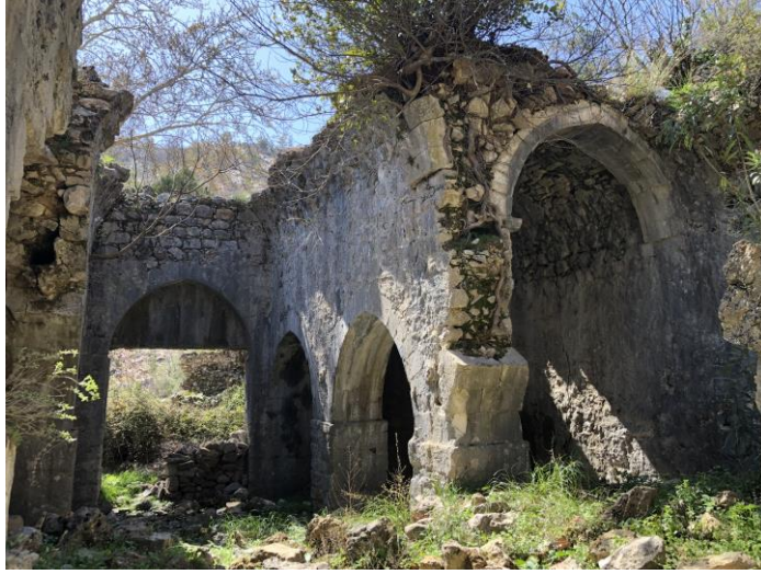
Őekil 7: Sirtk y Tol Han i mekan