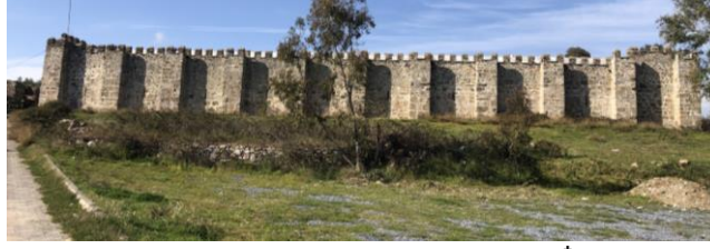
Şekil 1: Şarapsa Han güney cephe †