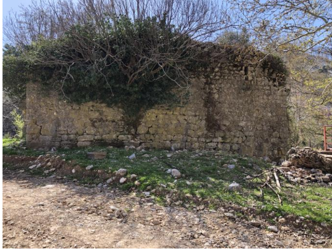
Őekil 8: Sirtk y Tol Han'ın bitki  rt s  nedeniyle tahrip olmuŐ cephelerinden biri