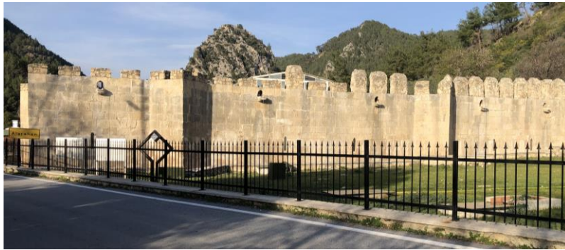
Şekil 3: Alara Han güneybatı cephesi ve Alara Kalesi