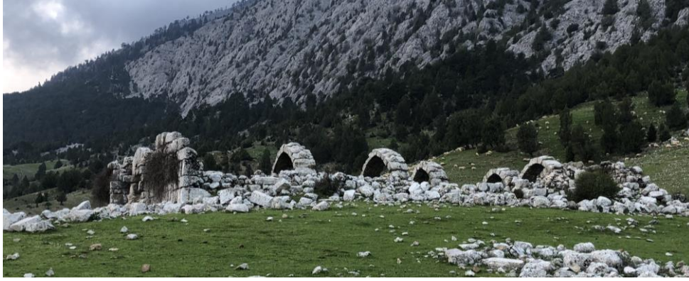
Şekil 11: Eynif Tol Han