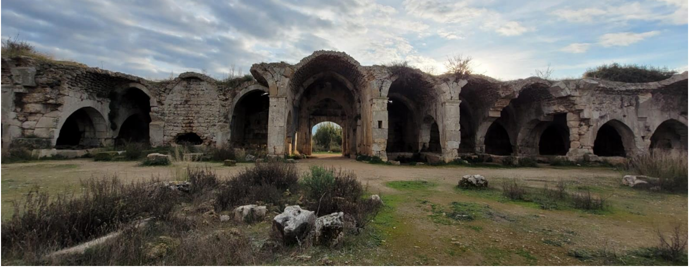
Şekil 13: Emdir Han iç görünüm