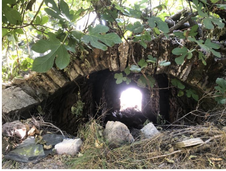
Şekil 10: Ebu'l Hasan Han'ın toprakla dolmuş mekanlarından