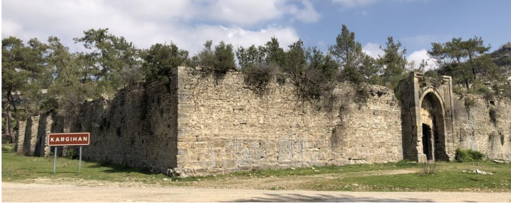
Şekil 5: Kargihan giriş cephesi