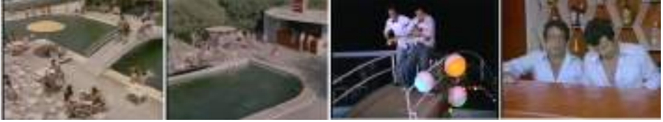
Görsel 11. Filmde Nebioğlu turistik tesislerinde yer alan havuz ve yanındaki bar mekanı Sivri Akıllılar Filmi. Erişim: 19.06.2017. goo.gl/yTbx79

Filmin açılış sahnelerinde tatil köyüne ilişkin genel plan çekimleri sunulur. Çoğunlukla havadan çekilen bu sahnelerle Nebioğlu Tatil Köyü'nün araziye yerleşimi, denizle ve bitki örtüsüyle kurduğu ilişkiye yönelik bütüncül bir izlenim elde ederiz (Görsel 9). Bu sahnelerden yerleşkede konaklama birimlerinin yamaca konumlandırıldığı ve plaj, yüzme havuzu, gece kulübü ve restoran gibi sosyal mekanların sahille ilişkilendirildiği dikkat çekmektedir.