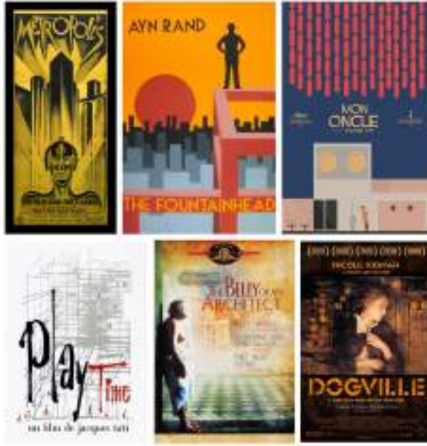
Görsel 1. Mimarlığın ön planda olduğu sinema filmlerinin afişleri

Bazı filmler sinemacıları olduğu kadar mimarları da yakından etkiler. Metropolis (Fritz Lang, 1927), My Uncle (Jacques Tati, 1958), Playtime (Jacques Tati, 1967), 2001 Space Odyssey (Stanley Kubrick, 1968), Balde Runner (Ridley Scott, 1982), Belly of an Architect (Peter Greenaway, 1988) gibi filmler mimarlık ve sinema disiplinleri arasındaki sınırları aşındırır; iki disiplinin iç içe geçtiği yeni alanlar yaratır (Görsel 1). Bu filmlerin bazılarında mimarlık bir metafor olarak ele alınır; bazılarında mimarlık 'ideolojik bir aparat' olarak yüze çıkar ve toplum mühendisliğiyle arasındaki kaçınılmaz bağa vurgu yapılır; bazılarında, içinde bulunduğumuz çağın mimarlığına yönelik bir eleştiri gündeme getirilir; bazılarında ise geleceğin mimarisin nasıl olacağı ve gelecekte nasıl mekanlarda yaşayacağımız sorgulanır.