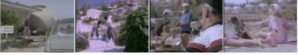
Görsel 10. Filmdeki karakter odaklı çekimlerinin arka fonunda yer alan yapılar Sivri Akıllılar Filmi. Erişim: 19.06.2017. goo.gl/yTbx79

Filmin açılış sahnelerinde tatil köyüne ilişkin genel plan çekimleri sunulur. Çoğunlukla havadan çekilen bu sahnelerle Nebioğlu Tatil Köyü'nün araziye yerleşimi, denizle ve bitki örtüsüyle kurduğu ilişkiye yönelik bütüncül bir izlenim elde ederiz (Görsel 9). Bu sahnelerden yerleşkede konaklama birimlerinin yamaca konumlandırıldığı ve plaj, yüzme havuzu, gece kulübü ve restoran gibi sosyal mekanların sahille ilişkilendirildiği dikkat çekmektedir.