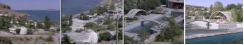
Görsel 9. Sivri Akıllılar filminin açılış sahnelerinde yer alan Nebioğlu yerleşkesi Sivri Akıllılar filmi. Erişim: 19.06.2017. goo.gl/yTbx79

Filmde, genel olarak, Zeki Alasya ve Metin Akpınar'ın iftiraya uğrayan arkadaşlarını kurtarmaya çalışması anlatılır. Recep ve karısı Perihan bir gazete çekilişinde tatil kazanır. Otele gelirler ve arkadaşları Zeki ve Metin'in otelde garson olarak çalıştığını görürler. Otele aynı gün milyoner Cemil Bey de ailesiyle gelir. Otelin müdürü bu fırsatı kaçırmak istemez ve Cemil Bey'in karısının mücevherlerini çalmak için bir plân yapar. Arkadaşı Sezai'yi ayarlar. Sezai, Cemil Bey'in kızının doğum gününde mücevherleri çalar. Mücevher kutusunu da Recep ve Perihan'ın odasına koyar. Polis suçlu olarak Recep ve Perihan'ı tutuklar. Film boyunca Zeki ve Metin arkadaşlarını kurtarmak için gerçek hırsızı bulmaya çalışacaktır.