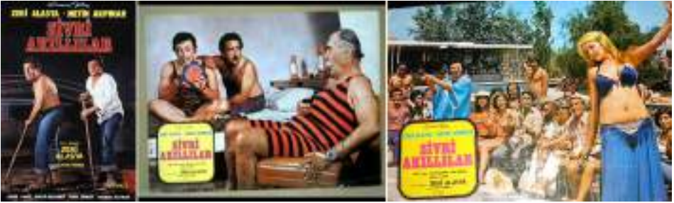
Görsel 3. Sivri Akıllılar filminin afişleri Sinematürk. Erişim: 19.06.2017. goo.gl/YokBZZ

Türk sineması bağlamında, mimari belge niteliğinde olan filmlere en iyi örneklerden biri 1974 yılında Ertem Eğilmez tarafından çekilen, yönetmenin çektiği Salak Milyoner filminin devamı niteliğinde olan ve başrollerini Kemal Sunal, Zeki Alasya, Metin Akpınar ve Halit Akçatepe gibi önemli oyuncuların paylaştığı Köyden İndim Şehre filmidir. Filmde kullanılan mekanlar bakımından İstanbul üzerine önemli mekansal okumalar yapmamızı sağlayan Salak Milyoner filmine benzer şekilde, Köyden İndim Şehre filmi de Ankara'nın Kızılay, Ulus, Güven Park, Gençlik Parkı gibi kamusal mekanlarına; Gar binası, Türk Ocağı binası, Kore Anıtı, Stad Oteli, Kızılay Gökdeleni, İş Bankası Gökdeleni gibi anıtsal binalarına ve Vakko mağazası gibi dönemin önemli ticari yapılarına ilişkin ipuçları sunar (Görsel 2).