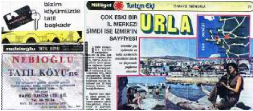
Görsel 5. Nebioğlu Tatil Köyü'ne Ait Reklamlar

Milliyet Gazetesi Turizm Eklerinde 26.05.1970, 05.05.1972 ve 16.05.1970 tarihli ilanlar)