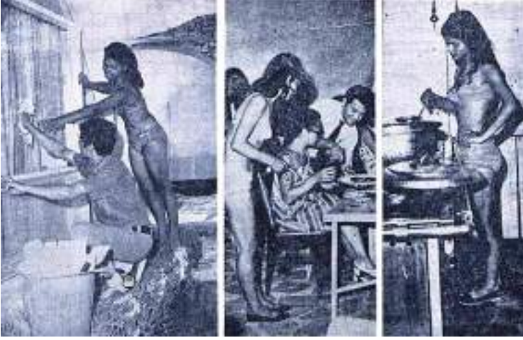
Görsel 7. Nebioğlu'nun kızları

Milliyet Gazetesi'nde 04.11.1969 tarihinde yayınlanan köşe yazısında yer alan fotoğraflar