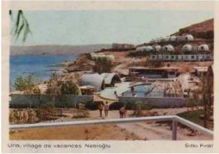
Görsel 4. Sıtkı Fırat tarafından fotoğraflanan Nebioğlu Tatil Köyü. (Yazarın Koleksiyonu)

Türkiye’nin konaklama/turizm mimarisinin tarihi ve Nebioğlu Turistik Tesisleri’nin bu anlamdaki önemi başka bir makalenin konusu olarak bırakılmıştır. Makale kapsamında öncelikle sinemanın önemli bir mimarlık belgeleme aracı/ortamı olduğuna işaret etmeye çalışılmış ve sinema filmlerinin mimari çizimler ve fotoğraflar gibi ‘durağan’ temsiller üzerinden okuyamadığımız bir bakış açısını sunma potansiyeli üzerinde durulmuştur.