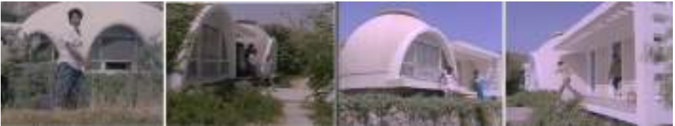
Görsel 12. Filmde Nebioğlu turistik tesislerindeki bungalovların dıştan fotoğrafları Sivri Akıllılar filmi. Erişim: 19.06.2017. goo.gl/yTbx79

Filmin öyküsü kurulmaya başladıkça ve Tatil Köyü'nün misafirleri geldikçe karakter odaklı çekimler başlamaktadır. Filmdeki karakterlerin tanıtıldığı bu çekimlerde arka planda yerleşkenin müracaat-karşılama mekanı, plaj, havuz başı gibi sosyal mekanları izleyiciye gösterilir (Görsel 10). Bu alanlar arasında özellikle havuz ve çevresi, hikâyenin hem gündüz hem de gece çekimlerinin vazgeçilmez mekanıdır. Bu çekimlerde Tatil Köyü'nün en önemli mimari elemanlarından biri olan havuzun tasarımı detaylı bir şekilde sunulur. Ek olarak bu çekimlerde havuzun ortasında yer alan köprü, bu köprüde yer alan ve bir dönem temsili sayılabilecek 'globe' aydınlatmalar, havuz kenarında yer alan 've yine dönemin moda renkleri ve geometrileriyle tasarlanmış olan bar mekanına daha yakından bakma fırsatı buluruz (Görsel 11).