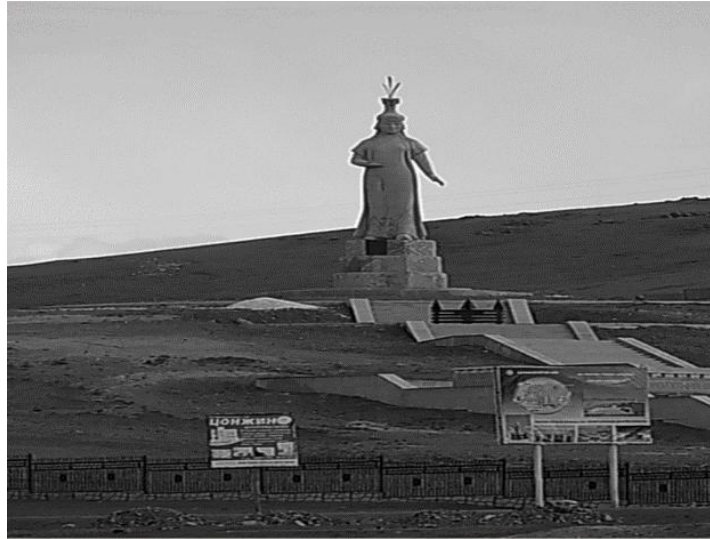
Görsel-2: Moğolistan'da Hö'elün Ana'nın Heykeli (Broadbridge, 2018, s. 44).