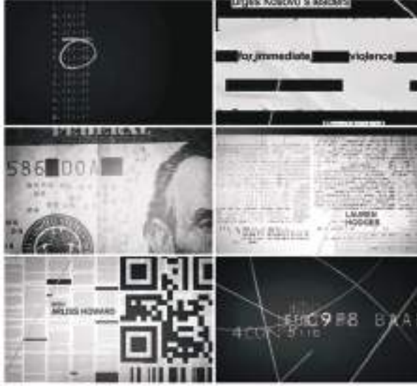
Görsel 5. Podeswa, J. ve Anderson, B. (Yönetmen). (2010). Rubicon [Dizi]. USA: Warner HorizonTelevision.

Kompozisyon Öğelerinin Konumlanması: Kompozisyon öğelerinin dizimi bakımından oldukça değişken bir merkez seçilmiştir. Seyircinin jenerikte odaklandığı nokta, kompozisyonun her köşesidir. Sabit bir arka plan kullanılmamıştır. Gerek sesle gerekse kullanılan öğelerle tasarım yüzeyi hareketli bir yapıya kavuşmuştur.