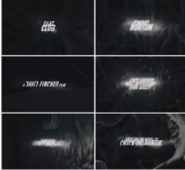
Görsel 6. Fincher, D. (Yönetmen). (1999). Fight Club [Film].USA: Fox 2000 Pictures.

Künye akışı gerçekleşirken önce isim sonra da soyadı birbirlerinin üzerine gelecek şekilde hareketlenip, bir bulut içerisinde kaybolurlar. Fon hareketli bir yapı sergilerken, fontlar kompozisyonun merkezinde bulunurlar. Yazıların rengi açık mavi ve etrafı ışıklıdır. İsimler hiyerarşik açıdan daha büyük olarak yazılırken, detaylara ilişkin bilgiler daha küçük olarak konumlanmıştır. Fontun arka plan ve biçim olarak ilişkisi ise filmin konusu ile zamanla özdeşleşmesine neden olmuştur.