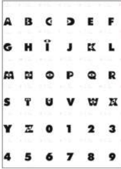
Görsel 2. Ziehn J. R. (2001). Monster AG http://www.fontineed.com/fon/monsters_inc_