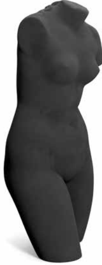
Görsel 2. Yves Klein, 1962, Mavi Venüs / La Vénus d'Alexandrie, Vénus Bleue. Lora Schlesinger Gallery. Erişim: 21.11.2015, http://www.loraschlesinger.com/klein.html

bana zittir. Klein, Milo Venüs'ünü yeniden yorumladığı çalışmasında geleneksel kabulden yararlanarak Venüs'ün güzelliğine göndermede bulunurken, Saint-Phalle yaratılmış bu geleneğe karşı çıkma adına Venüs'ü öldürmeyi uygun bulur.