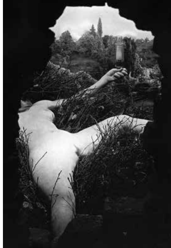
Görsel 3. Marcel Duchamp, 1966, Veriler: 1-Şelale 2- Gaz Aydınlatma / Étant donné: 1° la chute d'eau, 2° le gaz d'éclairage.