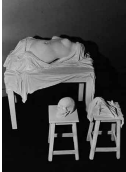
Görsel 5. Journiac, Michel, 1972, Milo Venüsü'nün Otopsis'i / Autopsie de la Vénus de Milo. Artnet. http://www.artnet.com/artists/michel-journiac/autopsie-de-la-v%C3%A9nus-de-milo-9565QVSkfVq-lw7HM5BWIQ2

Bir başka etkileyici çalışma ise sanatçı Michel Journiac tarafından gerçekleştirilmiştir. Cinsiyet ve psikanalizci bakışa sahip homoseksüel ve katolik bir entellektüel olan sanatçı 1972 yılında gerçekleştirdiği 'Milo Venüsü'nün Otopsis'i' isimli enstalasyonunda Milo Venüsü'nü parçalara ayrılmış olarak masada yatar şekilde sergiler (Görsel 5). Sanatçı bu çalışmasında, kolları ve başı olmayan Venüs'ün otopside parçalara ayırarak, bir anlamda sakatlanışını bize sunmaktadır. Venüs'ün, kafa ve rahim bölgesi kefen misali beyaz kumaşlarla örtülmüşken, beyaz gövdesi açıkta bırakılmıştır. Wilson'a göre marazi Hristiyanlık böylece gövdeyi Antik dünyanın açık şehvetinden korumaktadır (2000, s. 158-159). Masanın önünde yer alan iki tabureden birinin üzerinde kafatası, diğerinde kesik el bulunması, katolik sanatçının enstalasyonunu, hücrelerinde tövbe eden azizin nekrofil hayaline dönüştürmektedir.