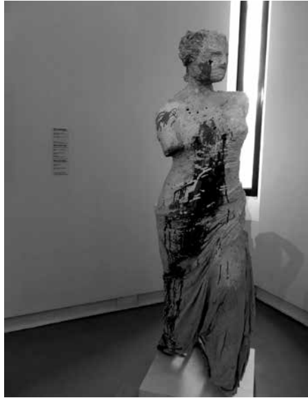
Görsel 1. Niki de Saint Phalle, 1962, Milo Venüsü / Vénus de Milo. Loquaciousness. Erişim: 21.11.2015, http://2.bp.blogspot.com/-cW9wllkvHM/ToOcn34ucNI/AAAAAAAAABf8/aHvLPdFrPYw/s1600/P9170286.JPG

Aşağıda kronolojik sırayla, postmodern dönemde üretilmiş ve sanat nesnesi Venüs olan bazı eserlerin incelemelerine yer verilmiştir: