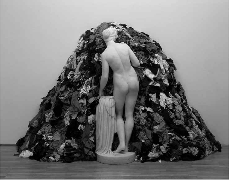
Görsel 4. Michelangelo Pistoletto, 1967-74, Paçavralar Venüsü / Venere degli stracci.