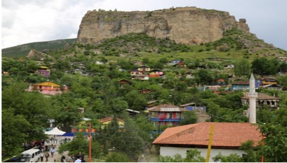
Fotoğraf 2. Adakale mahallesi ( https://www.google.com.tr/#q=ardanu%C3%A7+adakale&* )

Adakale mahallesinde genelde düşük gelirliler yaşamaktadır. Mahallede cadde bulunmamasıyla birlikte sokaklar dar ve evler birbirinden zor ayırt edilmektedir. Bunun temel nedeni mahallenin çok eskiden beri yerleşmeye açılması, yerleşim alanının sınırlı ve eğimli bir arazi yapısına sahip olması etkili olmuştur. Mahallenin üstünde bulunan Gevhernik tepesinden düşen kayalar, zaman içerisinde can ve mal kayıplarına yol açmıştır. Bu nedenle resmi kurumlar tarafından yapılan incelemeler sonucunda Adakale'nin yerleşmeye uygun olmadığı belirlenmiştir. Ancak günümüzde halen bu alan yerleşmeye açık ve bakımsızdır. Adakale Mahallesi'nde tarihi değeri olan İskender Paşa Camii, Hatice Hanım, Ali ve Süleyman Paşa Türbeleri ve mahallenin adı ile anılan tarihi kale gibi önemli eserler bulunmaktadır. Yani Ardanuç'un önemli tarihi eserleri bu mahallede bulunmaktadır.