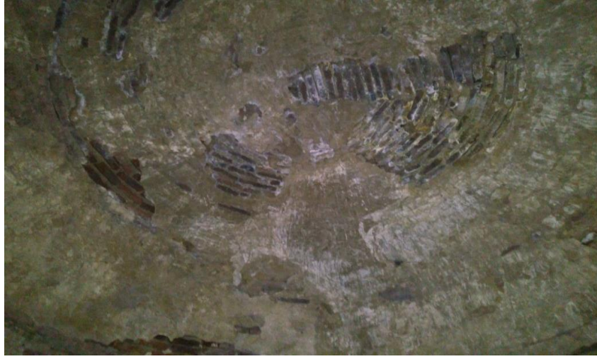
Fotoğraf 16. Kubbenin içten Görünüşü (27.03.2017)

( Fotoğraf 14 ve 15 27.03.2017 Tarihinde Çekilmiştir.)