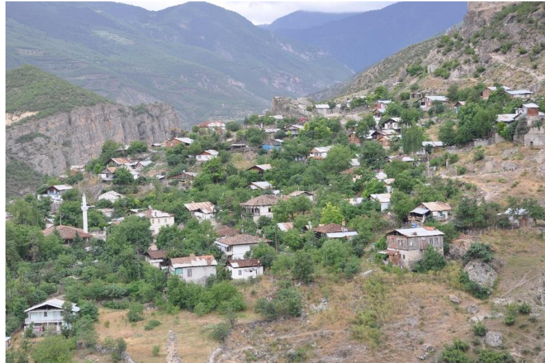
Fotoğraf 3. Adakale Mahallesi ve İskender Paşa Camisi (S. Başkan,2012.)

İskender paşa camisi ilk kez 7. Yüzyılda 3. Halife olan Hz. Osman döneminde yörede geçici olarak hâkim olan Müslüman Araplar tarafından yapılmıştır. Akkoyunlulardan sonra kullanılmaz hale gelen cami 1551'de Ardanuç Kalesi'ni fetheden Erzurum Beylerbeyi İskender Paşa tarafından 1553 yılında yeniden onartılmış ve işlevini sürdürebilmesi için gelir kaynakları oluşturulmuştur (Aytekin, 1995: 135).