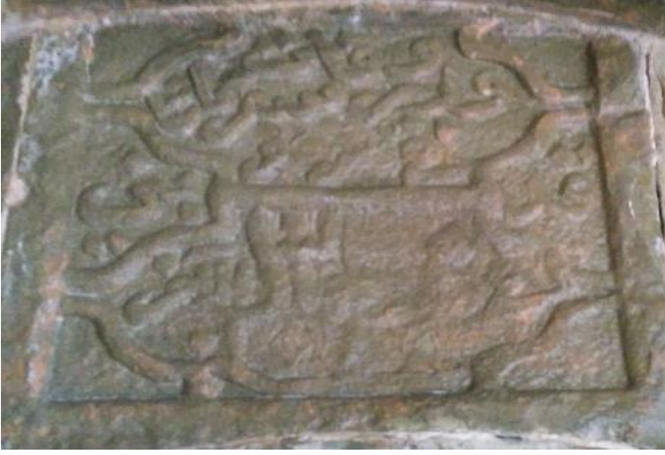
Fotoğraf 11. Kitabe (27.03.2017)