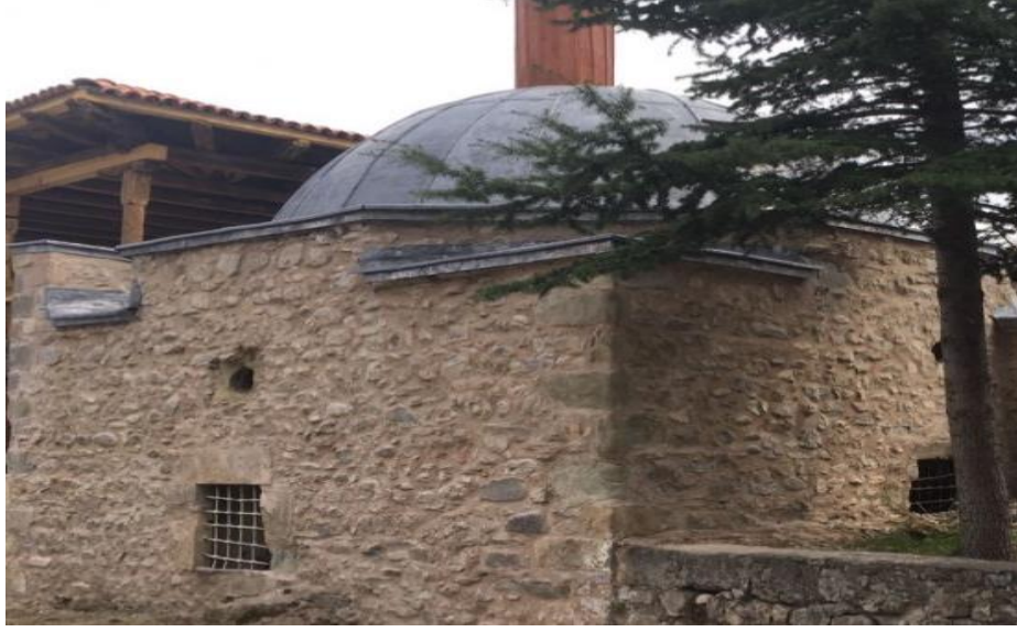
Fotoğraf 4. Hatice Hanım Türbesi'nin Kuzeybatı Cephesi (27.03. 2017)

Türbeye, Caminin son cemaat yerine açılan doğu cephesinin ekseninde basık kemerli kapı açıklığı ile girilmektedir. Kapı basık kemerli bir niş içerisine alınmıştır (Fotoğraf 4.). Türbenin güney, batı ve kuzey cephelerinin eksenin alt seviyesinde taş söveli dışardan dikdörtgen açıklı, içerden ise yarım daire kemerli birer pencere, üst kısmında ise küçük ve daire biçiminde toplam altı pencere yer almaktadır (Fotoğraf 6.).