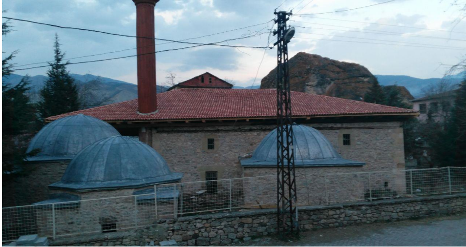
Fotoğraf 1. İskender Paşa Camisi, Hatice Hanım, Ali ve Süleyman Paşa Türbeleri (27.03.2017)

İskender Paşa Camisinin yanında bulunan Hatice Hanım, Ali ve Süleyman Paşa Türbeleri, Ardanuç ilçesinde Adakale Mahallesi'nin İskender Paşa sokağında yer alır (Fotoğraf 1).