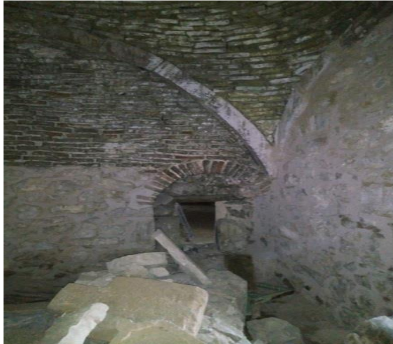
Fotoğraf 21. Harime Açılan Açıklık (27.03.2017)

( Fotoğraf 19 ve 20 27.03.2017 Tarihinde Çekilmiştir.)