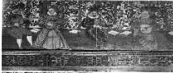
Görsel 3. Fairfax, W. (1585). Büyük Salon Resmi\Great Chamber Paint (Bir tablonun kesiti viyol, cithara ve lavta çalan müzikerler\Cross-section of a table,musicians playing viol, lute and cithara). Yorkshire,İngiltere,Giling Şatosu.

Bu süreçte, diğer sanat dallarında olduğu gibi müzikte de doğal yansıtan, akıcı, dans adımları taşıyan bir stil gelişmiştir. Dans müziği, danslara eşlik eden çalgılar, dansın coşkusunu duyuran güçlü ritm ve dinsel yapıtlarda olduğu kadar din dışı yapıtlarda da zenginleşen armonik yapı, Rönesans'ın başlıca özellikleridir.