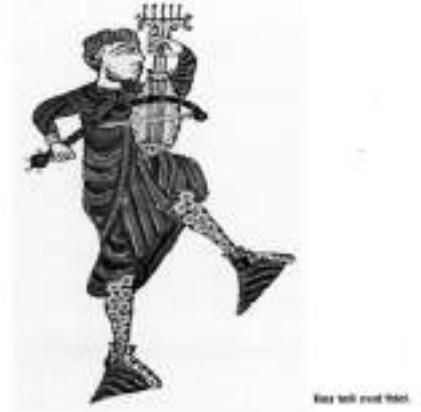
Görsel 1. Evin, İ. (5 telli fidel çalan müzisyen\Musicians playing 5 stringed Fidel). Zaman İçinde Müzik. (s.20) İstanbul: YKY. (1994).

Orta Çağ'a kadar müzik yapabilme, müzikle ilgilenme çabası, tümüyle kiliseye bağlı ve onun görüşleri doğrultusunda gerçekleşiyordu. Ancak Gregorius ezgileri giderek popüler hale gelmiş, çocuklar okulda ve oyunda bile bu ezgileri söyler olmuştular. Kutsal müzik artık gündelik yaşamın bir parçasıydı. Öte yandan kilisenin dışında, dünyevi konuları işleyen müzikler de halk arasında gizliden gizliye yayılmaktaydı. Notaya alınmış en eski müzik örnekleri dinsel olduğundan, dindışı müziğin ilk belgelerine 11. yüzyıldan önce rastlanmaz. Konusu dinsel olmayan ilk ezgiler ise yine kilise kalıplarının ve aynı havanın içinde bestelenmiştir. Müziğin yapısı değilse de konusu değişmiştir. Bu ezgilerin yanı sıra din dışı melodilerde dünyevi konular, kendi çalgısıyla kendine eşlik eden şarkıcılar tarafından söylenmektedir. Çalgı da insan sesi de aynı notaları tek sesli (monophonic) yapıda çalar ve söyler. Bu yöntem sonraları birden çok sese (heterophony) dönüşür ve çoksesliliğe (polyphony) bir adım olarak kabul edilir. (Elbaş, 1998, s.24-63).