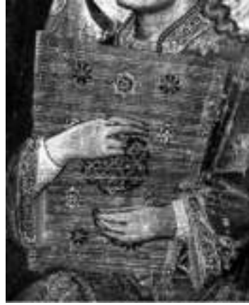
Görsel 6. Ataman, A.M. (Psalterion\Psalterion). Musiki Tarihi. (s.109) Ankara: MEB. (1947).

12. yüzyılda Asya'dan gelme iki çalgı, timpanon ve psalterion, klavsen ve piyanonun oluşumunda önemli rol oynamıştır (Gür, S. Anadolu Uygarlıkları (2007). Psalterion tellerin çekilmesi ya da mızrapla çalınan bir çalgıdır. Kanun bu çalgının gelişmişidir. Timpanon, tellerin gerili olduğu bir tahta kutu olup bu tellere tahta tokmaklarla vurularak ses üretilir. Santurun atası olduğunu söyleyebiliriz. Çalgıların tel sayılarında artış olmuş ve her bir tele tuşlar eklenerek klavye mekanizması oluşturulmuş böylece timpanon önce "klavikord"a, psalterion da "epinet"e dönüşmüştür. Daha sonra onlar da değişmiş ve epinet, "klavsen"e, klavikord ise on sekizinci yüzyılda "piyano"ya dönüşmüştür (Ataman, 1947, s.103-146).