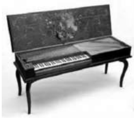
Görsel 8. Elbaş, O. (2011). (Klavikord\Klavikord). Berlin, Almanya, Enstürman Müzesi\Elbaş, O. Fotoğraf Koleksiyonu.

Dönemin diğer çalgıları arasında lavta, cithara, arp ve viyol'leri sayabiliriz. Tahta üflemeliler olarak flüt, hautbois (obua) sıralanabilir. Vurmalı çalgılar ise davullar, üçgen ve diğerleridir.