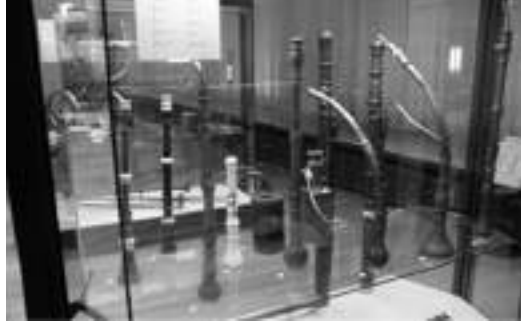
Görsel 9. Elbaş, O. (2011). (Eski dönemden Günümüze Obua Örnek Fotoğrafları\ From ancient times to today's Oboe Sample Photos). Berlin, Almanya, Enstürman Müzesi\Elbaş, O. Fotoğraf Koleksiyonu.