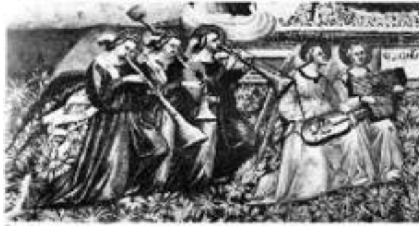
Görsel 2. Gaudenzio, F.(1535). (Giotto okulundan Aziz Francis'e saygı \ School of Giotto, Glorification of St. Francis). Ataman, M.A. Müzik Tarihi. (s.111). Ankara: MEB.(1947).

Yeni sanat dönemi, bağnazlıktan Rönesans'ın yaşam coşkusuna doğru geçiştir. Bu dönemde pek çok yapıt, doğaya ilişkin (Pastoral), önceki dönemlere göre daha hafif karakterde ve şiire dayalı bir yapıdadır. Art Nova, doğrudan 15. yüzyıl polifonisine, çoksesliliğin "Altın Çağı"na bağlanmıştır.