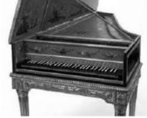
Görsel 7. Elbaş, O. (2011). (Klavsens\Klavsens). Berlin, Almanya, Enstürman Müzesi\Elbaş, O. Fotoğraf Koleksiyonu.