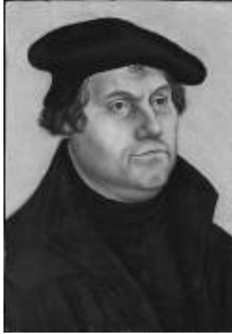
Görsel 10. Cranch, L. (1532). (Martin Luter \ Martin Luther) New York, Amerika, Metropalitan Museum of Art Galery 643.

Yine bu dönemde, 15. yüzyılın ortalarında icat edilmiş olan matbaa, notaların basılabilmemesini ve çoğaltılabilmemesini sağlamıştır. Böylece Almanya'da gelişen nota basımı ile değişik yörelerde bestelenen müzik, geniş kitlelere ulaşma olanağı bulmuştur.