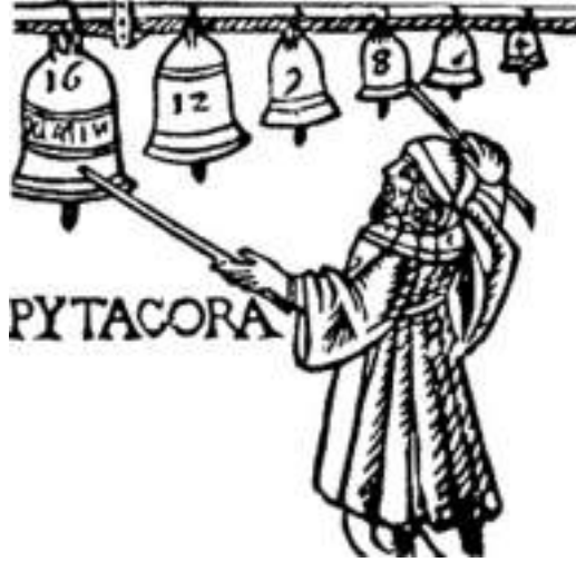
Görsel 7. Ataman, A.M. (Pythagoras tarafından geliştirilen seslerin bölünüşünü tanımlayan çan sistemi \Developed by Pythagoras that defines the sound of the division bell system). Musiki Tarihi (s.108) Ankara: MEB. (1947).

tik bilimini de içine alır. Müziğin geleneğindeki matematiksel mantığın doğru tonlamaya etkisi, onun gelişmesine büyük katkı yapmıştır. Aristoteles'e göre müzik doğrudan ruhsal tutkuları dile getirmektedir. Üzüntüyü, mutluluğu, kahramanlığı sergiler.