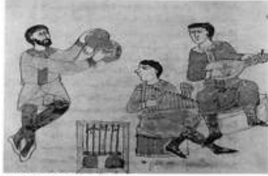
11. yüzyıldan İtalyan minyatürü.

miştir. Müzik, tek sesli, kutsal, Tanrı'ya adanmış, duaları kolay ezberletmeye yarayan, ayinlere tılsımlı bir ortam katan araçtır. Böylece kendilerinden önceki müziği yasaklayıp, ona ait belgeleri de yok eden Orta Çağ papazları, yüzyıllar boyunca müzik sanatını kilise koroları ve tek sesli ilahilerle kendi egemenlikleri altında tutmuşlardır.