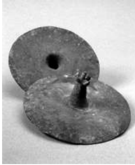
Görsel 3. Elbaş, O. (2011). (Tunç çağı idiofonları Sistrum ve Çalpara \Idiofon BronzeAge Sistrum and Swing). Ankara, Türkiye: Elbaş, O. Fotoğraf Koleksiyonu.

Bu ilk toplumlar, düşüncelerini anlatmak için resimli yazıyı, yani kutsal yazı adını taşıyan hiyeroglifi ve çok sonra da alfabeyi yoktan var ettiler. Alfabe, insanoğluna bilgisini ve düşüncelerini saptama ve saklama olanağını sağlamıştır. Bu bağlamda bilgi ve ardından bilim ve kültür/sanat birikimi elde edilebilmiştir. Böylece insanoğlu, alfabenin kullanılmaya başlamasından sonra insanlık tarihi için kısa sayılabilecek bir süre (5 bin yıl) içinde uzay çağına girme başarısını göstermiştir (Elbaş, 2011, s.5-23) .