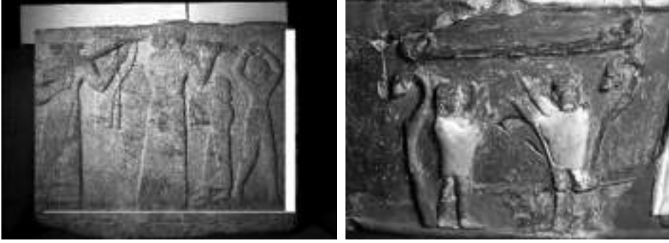
Görsel 4. Elbaş, O. (2011). (Geç Hitit ortostatı ve Hitit Dönemi İnanlık vazosu büyük lir \ Late Hittite Orthostat and Hittite period İnanlık the large lyre vase). Ankara, Türkiye: Elbaş, O. Fotoğraf Koleksiyonu.

Arkeolojik belgelere bakıldığında insanoğlunun yerleşik toplumsal düzene geçtiği süreçte müziğin büyüleyici, hastaları iyileştirici, toplum içinde uyarıcı işlevler kazanmış olduğu söylenebilir. Bilinmeyen güçlere tapınmak, iyi bir av için yakarıшта bulunmak, bir tehlike anında insanları uyarmak gibi işlevler için çalgılar ve müzik kullanılmıştır. Zaman içinde müzik, destanlara bilgi taşıyan, savaş öncesinde kabileyi coşturup yüreklendiren bir araç haline de dönüşmüştür. Müzik ile ilgili ele geçen ilk belgeler müziğin, toplumu yöneten güçlere ya da ruhani işlevlere dönük yapıldığını göstermektedir. Zaman içinde toplumsal yapılar değiştiğinde de bu ilk ezgilerin, saray ve tapınak törenlerinde önemli rolleri olduğu anlaşılmaktadır. Çoğunlukla bu ezgilerin, saray törenlerinde yönetenleri kutlama ya da onurlandırma, tapınaklarda tanrılara yakarış, kahramanlara övgülerde bulunma gibi konular üzerine olduğu görülmektedir.