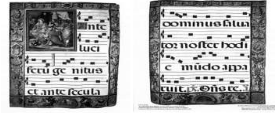
Görsel 11. Elbaş, O. (2010). (Neuma \Neuma) Ankara, Türkiye: Elbaş, O. Özel Koleksiyonu.