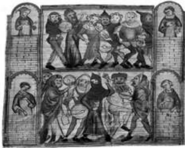
CHARIVARIS Miniatures du roman de Fauvel (début XIV e siècle)

Dođudaki Hıristiyan kiliselerinde mutlak bir yönetim birliđi kurulamadığından, her biri kendine göre farklı tören biçimleri geliřtirmiştir. Bizans ayinleri birinci Jüstiyan'ın 527'de taç giymesıyla yerleşik bir geleneđe kavuşur. Bizans ezgileri tek sesli, makamsal ve bađımsız ritimlerle donanmıştır. Bu ezgiler, Ortodoks, Yunan, Rus ve Dođu Ortodoks kilise müziđi için önemlidir. Önceleri kiliseye yalnız org girmesine izin çıkmışken, sonradan yalnız Noel gecelerinde kilisede üflemeli ve vurmali çalgıların da yer aldığı yönünde görüşler de vardır.