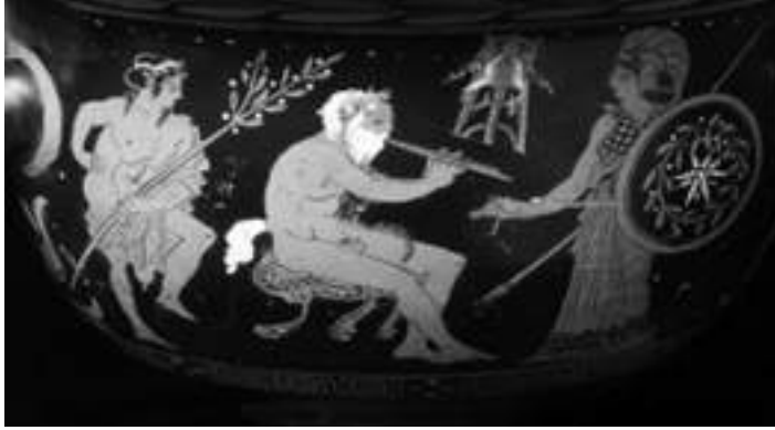
Görsel 6. Elbaş,O. (Demir Çağı, çifte kaval çalan müzisyen \Iron age, musician who is playing a double flute). Türkiye'de Müzik Kültürü (s.14) Ankara: AKM (2011).

İnsanoğlu, kendi sesini kullanabilmeyi, nesnelere birbirine vurup ses çıkarabilmeyi, bir hayvan kemiğine üfleyip ses çıkarmayı başardığında müzik tarihini yazmaya başlamıştır. İnsan ilk olarak kendi yetilerini kullanmayı öğrendiğinde, onu güçlendirmek ya da büyütmek için çeşitli araçlar oluşturmaya başlamıştır. İşte bu ilk araçlar ya da çalgılar arasında, el çırpma, ayak vurma'nın yarattığı ritim gücünü pekiştirmek için çeşitli idiofonlar (taşları vurarak ses çıkarma gibi eylemler, kemikten raspa/balıksırtı vb. çalgılar), derili vurmalar, kamıştan ya da hayvan kemiğinden üflemeli düdük/kaval, boğa kükreten denilen hava akımlılar sıralanabilir.