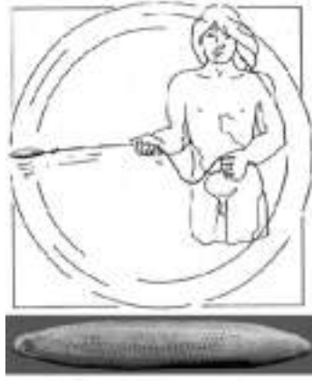
Görsel 1. Elbaş, O. (2011). (Boğa Kükreten Çizimi \Bull Roars Illustration) O, Elbaş. Türkiye’de Müzik Kültürü (s.7). Ankara: AKM (2011).

Bugün bir sanat dalı olarak uzun yılların eğitimini ve emeğini gerektiren müzik sanatı, diğer sanat dalları arasında en ilkel ve en temel güdülerden kaynaklanmış olanıdır. İlk insanın doğa seslerini yansıtması, kendi sesini, rüzgarın, denizin, kuşun sesine benzetmesi, ezginin doğması yolundaki ilk adımlar olmuştur. Önce doğayı yansıtmak için sesini yükselten insanoğlu, zaman içinde yalnızlığını unutmak ve doğa güçlerine tapınmak için mırıldanmaya başlamış, korkusunu yenmek için çığlıklar atmış, daha sonra da ruhsal değişimine göre kimi neşeli kimi hüzünlü ezgiler yaratmıştır. (Gür, 2007, s.64-98).