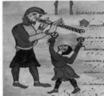
Miniature d'un manuscrit latin provenant de l'abbaye de Saint Martial de Limoges (XIIe siècle).

Belgelere göre Antik Çağ ile Erken Orta Çağ (Hıristiyanlık öncesi ve Hıristiyanlığın ilk yüzyılları) arasındaki müziğin benzer özellikleri, her ikisinin de yalnız melodi çizgisinden oluşan, tek sesli yapıda olmasıdır. Her ikisi de belli bir metine dayalıdır (Antik Çağ'da şiir ya da tiyatroya; Orta Çağ'da ise İncil'e ). Bu çağın ezgileri, büyük ölçüde doğaçlamadan yararlanarak çalınıp söylenirdi. Antik Çağ'dan Orta Çağ'a aktarılan bir başka özellik de müzik sanatının doğayı, insan düşünce ve davranışlarındaki etkinlikleri konu almasıydı.