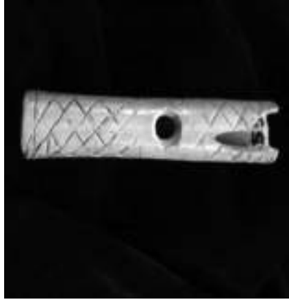
Görsel 2. Elbaş, O. (2011). (Neolitik kemik kaval parçası\Poplar part of the Neolithic bones). Ankara,- Türkiye: Elbaş, O. Fotoğraf Koleksiyonu.