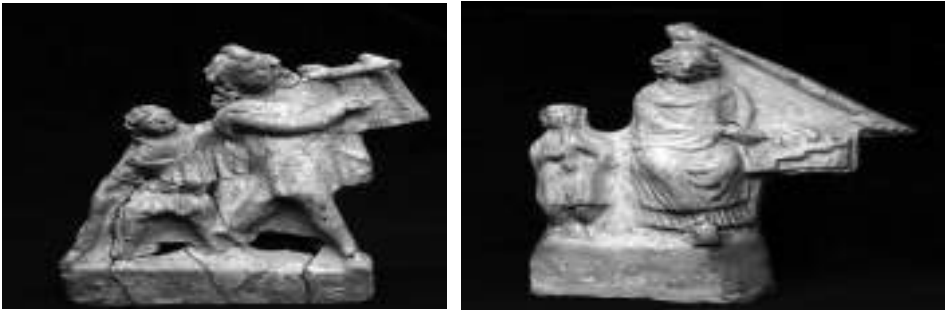
Görsel 5. Karaağaç, B. (2010). (Roma dönemi lir çalan müzisyen figürünü \ Musician figurine playing Roman lyre). İzmir, Türkiye: Efes Müzesi \ Karaağaç, B. Fotoğraf Koleksiyonu.

Arkeolojik belgelere bakıldığında insanoğlunun yerleşik toplumsal düzene geçtiği süreçte müziğin büyüleyici, hastaları iyileştirici, toplum içinde uyarıcı işlevler kazanmış olduğu söylenebilir. Bilinmeyen güçlere tapınmak, iyi bir av için yakarıшта bulunmak, bir tehlike anında insanları uyarmak gibi işlevler için çalgılar ve müzik kullanılmıştır. Zaman içinde müzik, destanlara bilgi taşıyan, savaş öncesinde kabileyi coşturup yüreklendiren bir araç haline de dönüşmüştür. Müzik ile ilgili ele geçen ilk belgeler müziğin, toplumu yöneten güçlere ya da ruhani işlevlere dönük yapıldığını göstermektedir. Zaman içinde toplumsal yapılar değiştiğinde de bu ilk ezgilerin, saray ve tapınak törenlerinde önemli rolleri olduğu anlaşılmaktadır. Çoğunlukla bu ezgilerin, saray törenlerinde yönetenleri kutlama ya da onurlandırma, tapınaklarda tanrılara yakarış, kahramanlara övgülerde bulunma gibi konular üzerine olduğu görülmektedir.