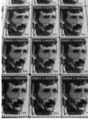
Görsel 7. Altındere, H. (1998). Kayıplar Ülkesine Hoş Geldiniz. 12 adet pul formatında dijital baskı, her biri 30x21 cm ( http://4.bp.blogspot.com/-QQUotUcQKvc/TySVFSPewgI/AAAAAAAAAME/D ).

Altındere'nin çok eleştirilen işlerinden: "Bir Türk Dünyaya Bedeldir" adlı yerleştirmesinde kastedilen dünyaya bedel olan Türk, "Ne mutlu Türküm diyene"deki Türk ise, etnik bir tanımdan bahsedilemez ve farklı etnik gruplar bir çatışma içinde tanımlanmaz (Evren, 2008, s.68). Türk'üm demek Türkiye Cumhuriyeti'nde yaşama kararını tanımlar şeklinde de yorumlanabilir. Aynı iyimser düşünce yapısıyla, ekonominin 1980'lerdeki hızlı liberalleşmesi ve enflasyonun hızla yükselmesi ile dünyanın en değersiz para birimi konumuna düşen Türk lirasını utanan Atatürk'lü banknot aracılığıyla eleştiren sanatçının izleyiciyi paranın gerçek değerine, ulusların ve ekonomilerinin utanç ya da gurur kaynağı olabileceğine dikkat çekmeye çalıştığı da söylenebilir.