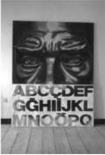
Görsel 8. Avşar, V. (1990). Atatürk ve Alfabe. Fotoğraf.

“Atatürkçüleri” ve generalleri eleştirir. Aydan Murtezaoğlu da “Karatahta” (Görsel 9) adlı, Atatürk’ün açık havada portatif bir karatahta önünde, Latin harflerini öğrettiği çok bilinen fotoğrafından yararlanarak oluşturduğu enstalasyonunda her şeyin tek perspektiften yazılmasını sorgulamaya çalışır (Kortun, Kosova, 2007, s.4).