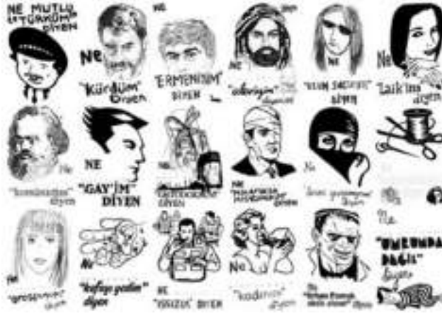
Görsel 10. Erdener, M. (Extramücadele). (2007). Ne. Afiş.

"Bir gün gelecek Türkiye'de yaşayan bütün azınlıklar ne mutlu ki Türkiye'de yaşıyorum" diyebilecekler. (Görsel 10).