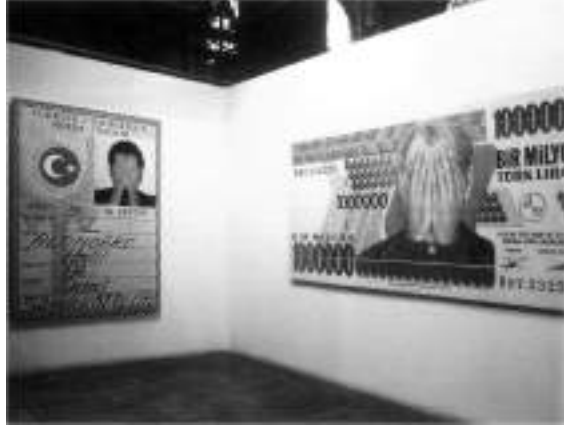
Görsel 5. Altındere, H. (1997). İstanbul Bienali'nden yerleştirme görüntüsü. Fotoğraflar. 170x233 cm. 110x140 cm. S. Evren. (2008). Kayıplar Ülkesiyle Dans s.30. İstanbul: Yapı Kredi Yayınları.

Yabancı küratörlerin desteğiyle yurtdışı sergilerde boy gösteren eleştiri dozu giderek artan işleriyle öne çıkan sanatçı Halil Altındere'nin 1988-89'da önce Berlin'de, sonra Kassel'de sergilenen "Ne mutlu Türküm diyene" adlı yerleştirmesi ve üzerinde elleriyle yüzünü kapatan Atatürk resminin bulunduğu bir milyon TL'lik banknotu gösteren fotoğraf çalışması da benzerleri gibi, farklı yorumlanabilir mizahi yapılarıyla dikkat çeker. (Görsel 5). Sanatçının işleri, ulusal temsil ve ulusalcı değerler odaklı sanat çevresinden Türkiye karşıtı lobilerce kullanılabilecek net bir politik ileti içermesi nedeniyle tepki çeker fakat, iyimser bir bakış açısından bakıldığında oldukça masum yorumlandıkları görülür (Evren, 2008, s.39).