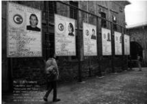
Görsel 6. Altındere, H. (1997). Tabularla Dans. Fotoğraf. 175x240 cm. H. Altındere., S. Evren (2007). User's Manual Contemporary Art in Turkey/Kullanma Kılavuzu: Türkiye'de Güncel Sanat. s.167. İstanbul: Art-ist Prodüksiyon Tasarım Yayıncılık.

Yabancı küratörlerin desteğiyle yurtdışı sergilerde boy gösteren eleştiri dozu giderek artan işleriyle öne çıkan sanatçı Halil Altındere'nin 1988-89'da önce Berlin'de, sonra Kassel'de sergilenen "Ne mutlu Türküm diyene" adlı yerleştirmesi ve üzerinde elleriyle yüzünü kapatan Atatürk resminin bulunduğu bir milyon TL'lik banknotu gösteren fotoğraf çalışması da benzerleri gibi, farklı yorumlanabilir mizahi yapılarıyla dikkat çeker. (Görsel 5). Sanatçının işleri, ulusal temsil ve ulusalcı değerler odaklı sanat çevresinden Türkiye karşıtı lobilerce kullanılabilecek net bir politik ileti içermesi nedeniyle tepki çeker fakat, iyimser bir bakış açısından bakıldığında oldukça masum yorumlandıkları görülür (Evren, 2008, s.39).