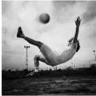
Görsel 13. Tuna, V. (1998). Birinci Dünya Vuruşu. Fotomontaj.

Vahit Tuna'nın 2000 yılında düzenlenen Manifesta 3 kataloğunda yer alan çalışması "Birinci Dünya Vuruşu", boş bir sahadaki futbolcunun havada sıçrayarak futbolda zor bir hareket olan röveşatayı gerçekleştirdiğini gösteren fotoğraftır. (Görsel 13). İmgeye dikkatle bakıldığında havadaki topun futbol topu değil, basketbol topu olduğu, başka birinin oyununu oynamaya çalışan, ama kendi oynadığı oyunun kurallarını terk etmeye yanaşmayan oyuncuyu imlediği fark edilir (Kosova, 2008, s.3).