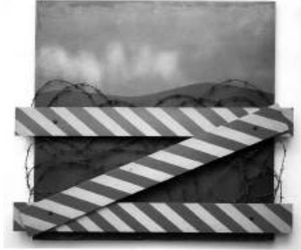
Görsel 1. Gürman, A. (1964). Montaj 4. Tahta üstü selülozik boya ve dikenli tel. 123x140x9 cm. https://www.google.com.tr/search?q=altan+g%C3%BCrman+eserleri&tbm=isch&bo=u&source=AQ&ved=OCCKQsAQ&biw=1280&bih=783#q=montaj+4+by+altan+g%C3%BCrman&tbm=isch

Ulus devletin sanat üzerindeki konumunu temsil eden Fransız Güzel Sanatlar Akademisi örnek alınarak, Osmanlı İmparatorluğu döneminde 1883 yılında kurulan Sanayi-i Nefise dönemin Türkiye'sinde, Batı'nın görevini tamamlamış eğitim kurumları olarak görülen güzel sanatlar okullarıyla karşılaştırıldığında çağın ilerisinde modern bir kurumdur (Artun, 2008, s.22-24). Ulus inşası programının temel ilkelerini belirleyen Atatürk devrimleri doğrultusunda, 1923-1970 yılları arasında görsel sanatlar alanında yapılan yeniliklerin hemen hemen tümü; devlet kontrolünde, devlet desteğinde, 'ulus' imgesini beslemek, sürekliliğini sağlamak ve devlet ideolojisini tanıtmak adına kullanılan birer araçtır. Cumhuriyet'in geçmişe karşı çıkan, gençliğe dayanan, bir tür fütürist bakışla olumlu bir geleceği hedefleyen, dünyada güncel olanla bütünleşmek hatta onu aşmak isteyen yapısı Türk sanatçısının modernleşme arzu ve gereksinimine denk düşmüş ve benimsenmiştir (Erdemci, Germaner, Koçak, 2007, s.3).