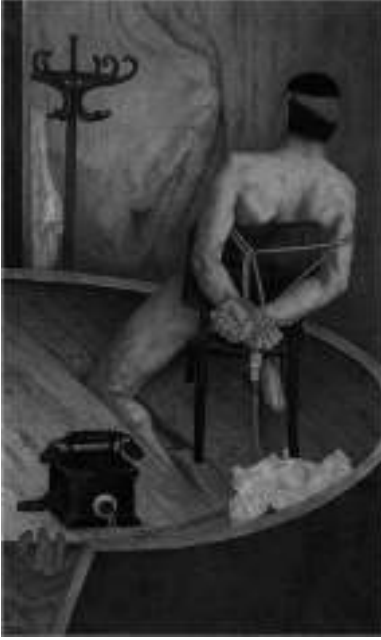
Görsel 2. Ayan, A. (1978). Elektrik İşkencesi. Tuval üzerine yağlıboya. 160x100 cm

Öğrenci gösterileri, ardından 27 Mayıs askeri darbesinin yaşandığı 60'lı yıllardan başlayarak yükselen yeni olma arzusu yanında; toplumsal, ekonomik, kültürel yapının gelişmesinin de etkisiyle sanat alanında belirgin birçok renklilik gözlenir. Sanat aynı zamanda sol ideolojinin aracı olmaya başlar ve 68 kuşağının toplumsal eleştiri içeren işleri dikkate değer çıkışlar olarak öne çıkar. Türk sanatına yepyeni bir bakış açısı getiren, radikal bir yol ayırımını başlatmış olan sanatçılar arasında Altan Gürman başta gelmektedir (Erdemci, Germaner, Koçak, 2007, s.17). Sanatçının 1964 tarihli Montaj 4 adlı işinde görüldüğü gibi ulus devletini yapı taşları olan, bürokrasi ve militarizme karşı eleştiri atağı izlenir. (Görsel 1). Politik içerikli anlamları simgelerle çoğaltıp zenginleştiren sanatçı Aydın Ayan'ın 1978 tarihli "Elektrik İşkencesi" adlı işi de (Görsel 2) bu döneme özgü bir örnektir. Daha sonra eleştiri dozu giderek artan anti ulusalcı etkinliklerin baş aktörlerinden sanatçı Halil Altındere'yi eleştiren küratör Beral Madra 22 Temmuz 2006'da Birgün Gazetesinde yayınlanan yazısında; asıl kırılmanın 1970'lerde yaşandığını belirterek, Altan Gürman'ın 1960'lardaki benzer içerikli yapıtlarının militarizm eleştirisinin, ya da Serhat Kıraz'ın 1980 darbesi sırasında Hareket Köşkü'nde sergilediği "Elektrikli Sandalye" görüntüsünün Altındere ve kuşağının Post-medyatik imgeleri yanında daha güçlü olduklarını iddia eder.