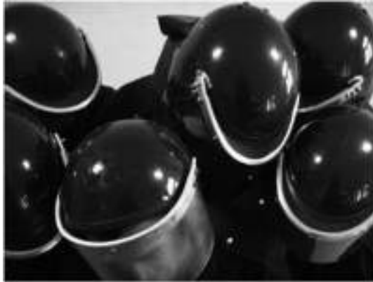
Görsel 14. Bonus, video görüntüsü ( http://www.cagdassanat.com/tag/ba-lang/ ).

Sanatçının “Bonus” adlı videosu dakoreografik bir düzenleme eşliğinde kontrolden çıkmış biçimde kasklarını tokuşturan polisleri gösterir. (Görsel 14). Uygun adımın simetrisiyle başlayıp asimetrik bir iç içe geçmeye doğru ilerleyen polisler, slogan atmaya başladıklarında insan haklarına karşı girişilen tüyler ürpertici polis yürüyüşü akla gelir (Kosova, 2008, s.5). İstanbul’da gerçekleşen güncel sanat etkinliklerine, merkez dışından katılan sanatçılar kendi bölgelerinde de benzer girişimlerde bulunurlar. Diyarbakır’da 2002’de kurulan Diyarbakır Sanat Merkezi (DSM), etnik kökenlerinden ve coğrafyalarındaki yönetimle ilgili rahatsızlıklarından beslenen bir grup sanatçının yaşadıkları bölgede de çalışmalarını sürdürmelerini ve temsil edilmelerini sağlayan bir ortam yaratır. İzmir’de de K2 Güncel Sanat Merkezi (2003), sanatın İstanbul dışında da var olabileceğinin göstergesi olur. Anti-ulusalcı çıkışlarıyla tanınan sanatçı Şener Özmen’e göre Diyarbakır, Ankara ve İzmir’deki ilginç sanat hareketlenmeleriyle kıyaslanamayacak, sanatçılar ve üretimleri açısından hiçbir koşulda karşılaştırma yapılamayacak, benzerlikler ve eşzamanlılıklar söz konusu edilemeyecek kadar ciddi bir olgudur (Altındere, Evren, 2008, s.113).