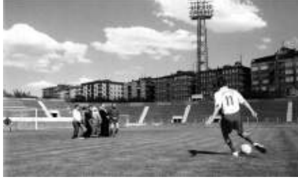
Görsel 12. Tekin, C. (2005). Serbest Vuruş. Video görüntüsü.

toplattır mahkeme demokrasi tüm duygulanımlara katlanmaktır diye kararı kaldırır. Ordu, asker, işkence, cezaevi ve intiharlar gibi birbirine zıt dokuları işleyen sergi adını Diyarbakırlı sanatçı Cengiz Tekin'in aynı adlı video işinden alır. (Görsel 12). Bir spor sahasında serbest vuruş yapan oyuncuyu görüntüleyen yapıtta barajı kuran oyuncunun ailesinin ironik görünüşü Güneydoğu'da yaşananları anımsatır (Altındere, Evren, 2008, s.143).