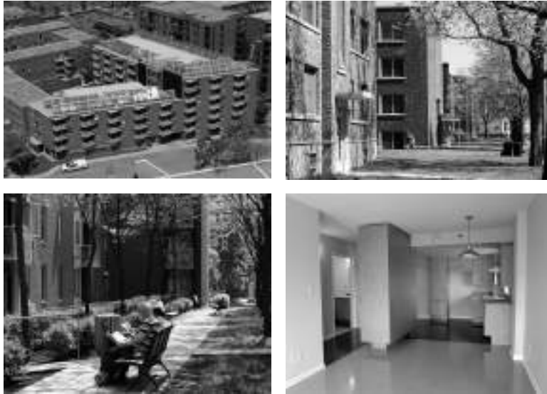
Görsel 5. Benny Farm yerleşkesinden görüntüler Holcim Foundation. Erişim Tarihi: 21 Ekim 2013. http://www.holcimfoundation.org/Article/greening-the-infrastructure-at-benny-farm-montreal-qc-canada Loeuf Architecture. Erişim Tarihi: 21 Ekim 2013 http://www.loeuf.com/projects/benny-farm-green-energy-benny-farm/ .