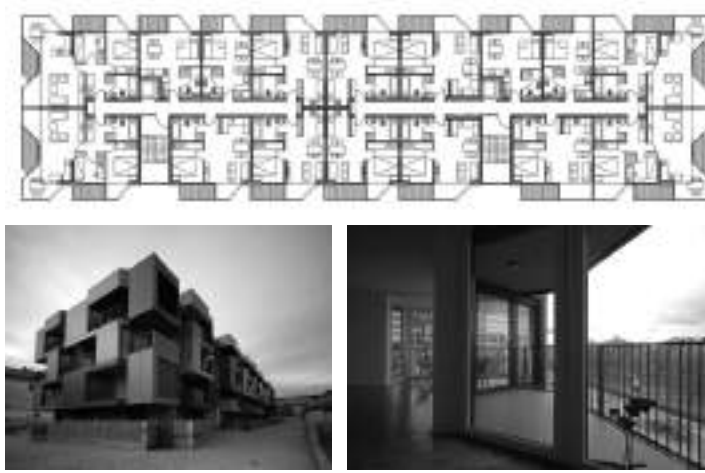
Görsel 4. Tetris Apartmanı (Lubiana) plan ve görünüşleri. Duran, S.C. (2009) Yüksek Yoğunluklu Konutlar: Büyük Şehirlerdeki Yeni Konut Eğilimleri. (104-112). YEM Yayın, İstanbul.

lanmıştır (Holchim Foundation, 2013). İç mekân tasarımları oldukça sade olan Benny Farm konutlarında bu sadelik işlevsel olarak maksimumda kullanılmış ve değişen kullanıcı sayısı ve fonksiyonlara kolayca adapte edilebilecek esnek mekânlar yaratılmıştır (Görsel 5).