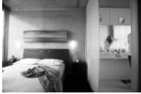
Görsel 3. Perrinepod evinden görüşler.

Perrine. Erişim Tarihi: 20 Ekim 2013. perrine.com.au.