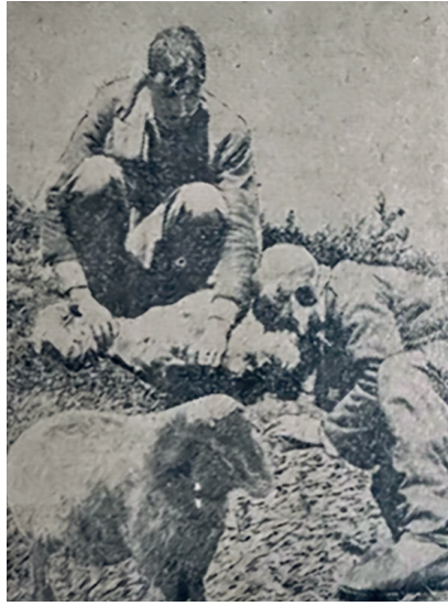
Görsel 2. Dişle İçdiş Etme

Hayvan bedenlerine verimlilik ve ekonomik kaygı temelli müdahaleler yirminci yüzyıla özel değildi. Önceki yüzyıllarda da hangi hayvanların üremesine izin verilip hangilerinin kısırlaştırılacağına yönelik farklı yöntemler kullanılmaktaydı. Örneğin, Toroslardaki yörüklerin "dişle içdiş" adını verdikleri; üremesi tercih edilmeyen hayvanların üreme organlarına giden damarların diş ile sıkıştırılarak işlevsiz hale getirilmesi gibi farklı yöntemler asırlardır kullanılmaktaydı. 60 Ancak yirminci yüzyılda geliştirilen bilimsel yöntemler ile bu müdahalenin boyutları daha önce görülmemiş boyutlara ulaştı.