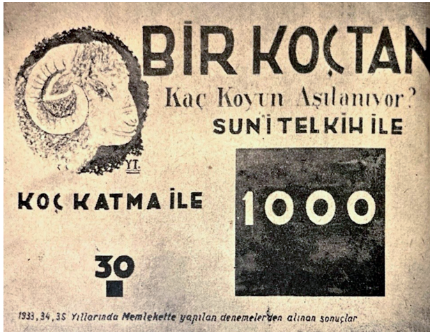
Görsel 3. Kaynak: Fahri Araz, Merinoslarda Suni Tohumlama: Aygırlardan Yeni Metotla Tohum Alma ve Kısıraklarda Suni Tohumlama (Ankara: İdeal Basım ve Cilt Evi, 1936), 6.

Günümüzde hâlâ hayvan sömürüsü üzerinden sermaye birikiminin devasa boyutlarda olmasını mümkün kılan ve hayvanların üreme kapasitesini neredeyse mutlak bir insan tahakkümüne tabi tutan suni tohumlama yönteminin Türkiye coğrafyasında özellikle Birinci Sanayi Planı (1934) sonrası daha yoğun tartışılmaya başlanmış olmasının önemli bir kesişim olduğunu düşünmekteyim. Ulus , Türk Dili , Tan ve Kurun gibi pek çok farklı gazetede 64 suni tohumlamanın nasıl yapıldığı ve “ faydaları” aktarılırken suni tohumlama uzmanı ve Ziraat Vekaleti Zootečni Bürosu Müdürü Fahri Araz’ın uygulamanın “ faydalarını” ve nasıl yapılacağını adım adım anlattığı iki kitabı ise 1936 65 ve 1937 66 yıllarında Ziraat Vekâleti tarafından bastırılmıştır.