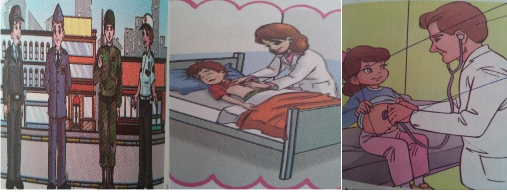
Resim 7. Mesleki Roller Kadın ve Erkek Rollerini.

temizlikçisi gibi mesleklerin erkekler tarafından yapıldığı görsellerde ifade edilmektedir. Çeşitli araçlara (otobüs, kamyon, minibüs, okul servisi, otomobil) yönelik görsellerde sürücülerin hep erkek olduğu sadece bir görselde otomobili sürenin kadın olduğu gözlemlenmiştir.