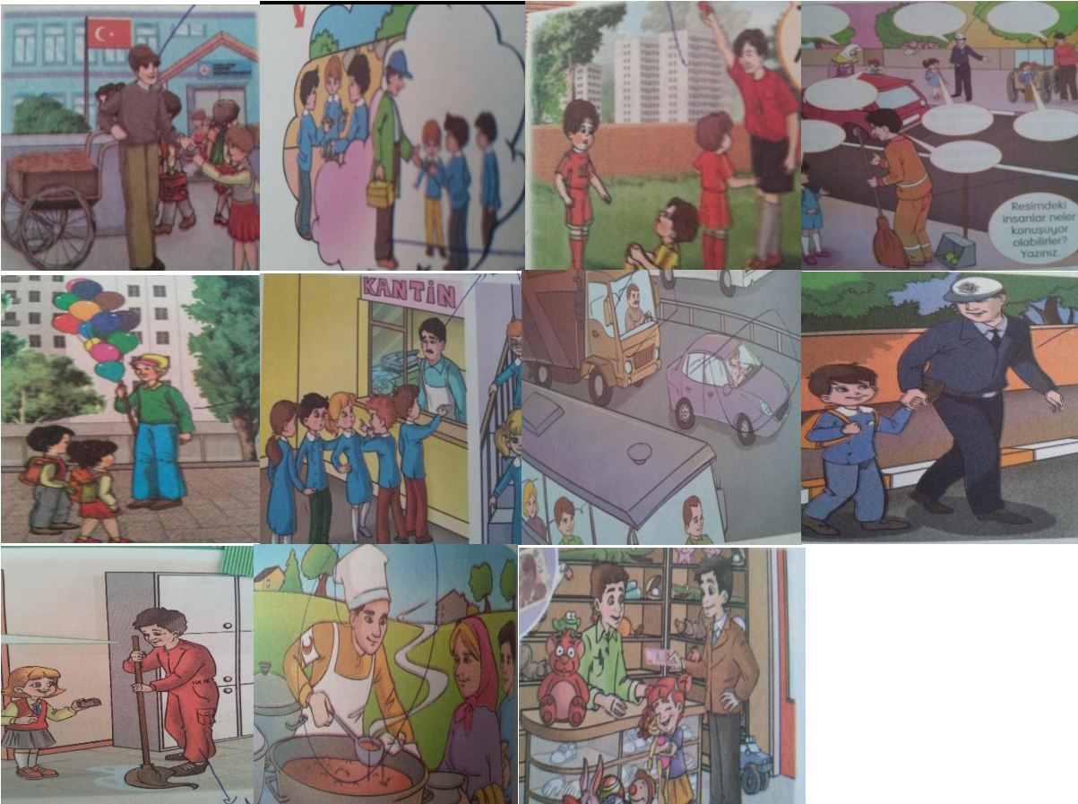
Resim 6. Mesleki Roller Erkek Rollerini.

Mesleki roller teması, kadın rolleri alt temasına bakıldığında Resim 5’te görüldüğü gibi kadınlara daha çok öğretmen, haber spikeri, hemşire, terzi gibi roller verilmiştir.