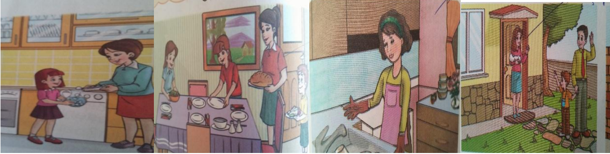
Resim 2. Ev İçi Sorumluluklar (Anne).

Resim 1’de görüldüğü gibi Anne-baba rolleri temasında çocuk bakımı alt temasına ait görsellerde çocuk bakımı ile genellikle anne ilgilenmektedir. Anne çocuğun tırnağını kesme, dişini fırçalama, üzerini değiştirme, ders çalışmasına ve uyumasına yardımcı olma gibi görevlerde yer alırken, birkaç görselde babanın da tırnak kesme, saç kurutma, ayakkabı bağlama gibi çocuğun bakımıyla ilgili görevlerde yer aldığı görülmektedir.