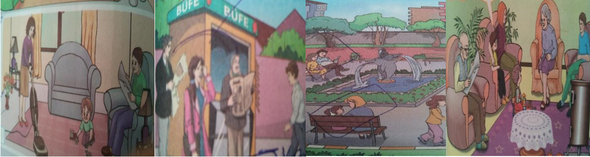
Resim 8. Okuma Faaliyetleri

Mesleki roller teması, kadın ve erkek rolleri alt temasına göre incelenen görsellerde (Resim 7) doktor, polis, asker, öğretmen gibi mesleklerin her iki cinsiyet tarafından yapılan bir meslek olduğu gözlemlenmiştir. Yalnız bu durum sayıca değerlendirilecek olursa polis, asker ve doktorların daha çok erkek, öğretmenin ise daha çok kadın olduğu görselleri gözlenmiştir. Ayrıca öğretmen rolü hem kadın hem de erkeğe verilmiştir fakat okul idarecilerinin genelde erkek olduğuna dair görseller yer almaktadır.