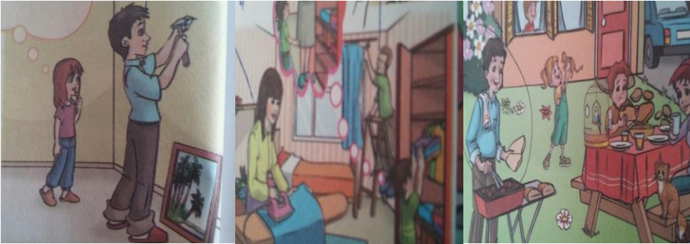
Resim 3. Ev İçi Sorumluluklar (Baba).

Resim 2’de Ev içi sorumluluklar alt temasına ait örnek resimler yer almaktadır. Anne-baba rolleri teması ev içi sorumluluklar alt temasında, her iki ebeveyn görev almakta fakat metin ve görsellerde genelde anne ev içinde yemek yapma, bulaşık, temizlik, ütü, yemek masası hazırlama gibi işlerde, baba dışarıda çalışıyor gösterildiği için ev içi işlerde baba daha az yer almaktadır. Anne çoğunlukla ev içerisinde gösterildiği için çocuğu okula gönderen ve okuldan eve geldiğinde onu karşılayan annedir.