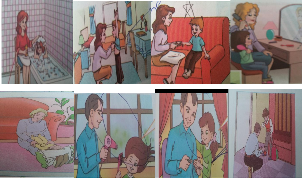
Resim 1. Anne-Baba Rollerini Çocuk Bakımı.

Hayat Bilgisi ders kitaplarındaki görseller incelendiğinde toplumsal cinsiyet rolleri metinlerdeki gibi anne-baba rolleri ve mesleki roller olmak üzere iki tema altında incelenmiştir.