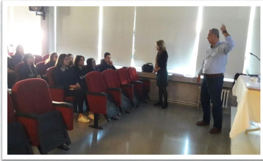
Şekil 1. “Yerel Tarih ve Sözlü Tarih Nedir” Konulu Eğitimden Bir Fotoğraf

Bu eğitimin sonunda ‘genç tarihçilere’ yerel tarih çalışması için orijinal konu bulmaları gerektiği ifade edildi. Konunun öğrenciler tarafından bulunması projeyi sahiplenmeleri adına önemli idi. Ancak ‘Proje Koordinasyon Kurulu’nun bir ilke kararı olarak, genç tarihçiler, Üsküdar denilince ilk akla gelen konuları yerel tarih çalışması olarak seçemeyeceklerdi. Sözgelimi, çok bilinen Kızkulesi ya da Sultan III. Ahmet Çeşmesi öğrenciler tarafından seçilemeyecekti. Bu anlamda genç tarihçilerden Üsküdar’ı gezmeleri ve Üsküdar’a ‘alıcı gözle bakmaları’ istendi. Bakmakla görmek arasındaki farkı fark etmeleri, görmenin de tek başına yetmediği, görüp hissetmelerinin de çok önemli olduğu vurgusu altı çizilerek yapıldı. Bu ödev üzerine genç tarihçiler bir hafta sonu Üsküdar’ı bir daha ve yeniden gezdiler. Öncesinde öğrencilere, “Üsküdar Yerel Tarih Konumuzu Nasıl Bulduk Formu” dağıtıldı. Bu form ile olası birden fazla konu bulmaları, konuların üzerinde tartışmaları ve en son çalışmayı arzu ettikleri