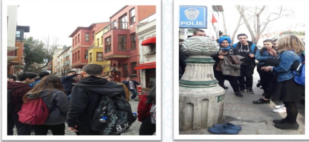
Şekil 2. "Genç Tarihçiler" Konu Bulma Amaçlı Üsküdar'ı Geziyor

Öğrencilerin pek çoğu Üsküdar'da yaşamalarına rağmen, Üsküdar'a ilişkin bilmedikleri ya da bakıp da görmedikleri ne kadar çok şey olduğunu bu gezilerle keşfettiler. Keşfettikleri bir Üsküdar değeriyle ilgili olarak görece daha yaşlı Üsküdarlılarla da sohbet ettiler. Grupla yapılan bu yerel tarih konu bulma gezisinden başka, genç tarihçiler kendileri de grup olarak Üsküdar'da dolaştılar; bakmayı, görmeyi ve mekânı hissetmeyi soludular.