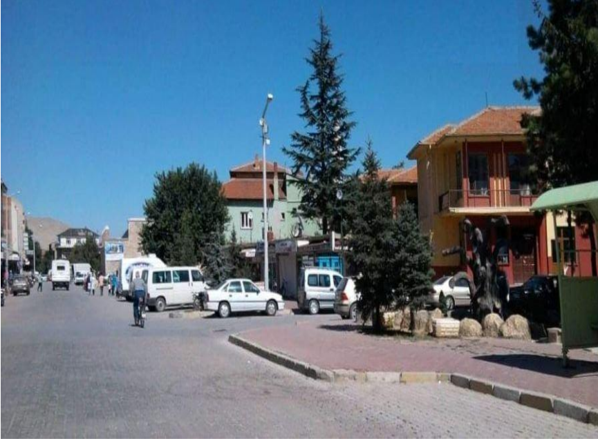
Görsel 2. Hamam Üzerine Yapılan Ilgın Sinema ve Kültür Binası ve Lala Mustafa Paşa Külliyesi