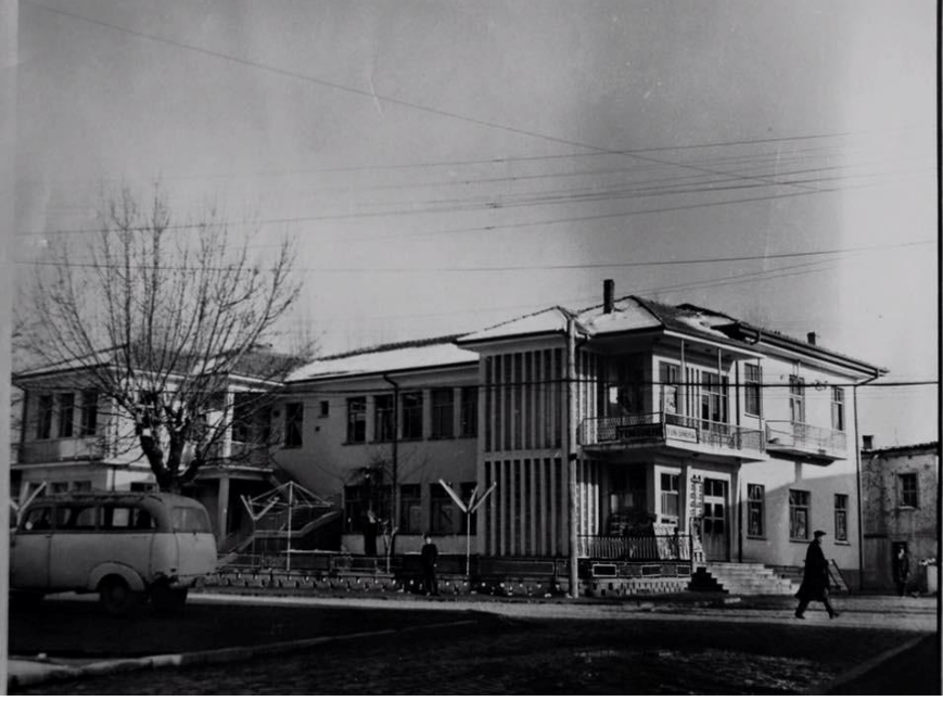
Görsel 1. Hamamın Üzerine 1960-1970 Yılları Arasında Yapılan ve 2018’li Yıllarda Kaldırılan İlgin Sinema ve Kültür Binası