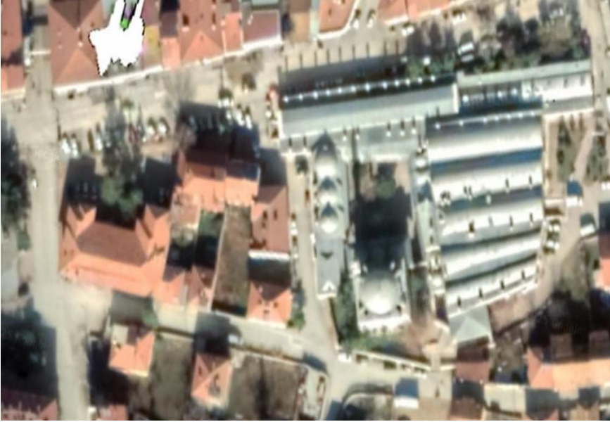
Görsel 3. Iğın Lala Mustafa Paşa Kervansarayı Koruma Alanının 13 Ocak 2018 Tarihli Görüntüsü

28 Mart 2018 tarihinde çekilmiş (Gör. 4) yeni görüntüde ise altında hamam kalıntısına rastlanılan sinema ve kültür binasının artık olmadığı görülmektedir. Iğın Belediyesi'ne ait olan ve sinema ve kültür binası olarak kullanılan yapı, muhtemelen Şubat-Mart aylarında resmî kurumlar tarafından yıkılarak ortadan kaldırılmıştır.