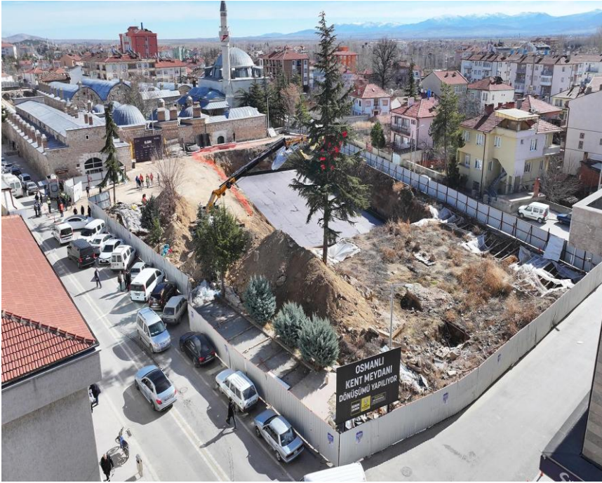
Görsel 6. Lala Mustafa Paşa Külliyesi ve Sağ Köşede Hamamın Bulunduğu Ilgın Osmanlı Kent Meydanı

Varlıkları Koruma Bölge Kurulu'nun uygun görüşü alınması zorunludur" nota istinaden, rastlanılan yapı kalıntısı ile ilgili Konya Müze Müdürlüğü'nden gerekli inceleme ve çalışmaların yapılması talep edilmiştir. 09.12.2022 tarihinde yerinde gerçekleştirilen incelemeler neticesinde, 131 numaralı ada, 17 numaralı parselin güneybatı köşesinde yer alan kalıntının tuğla örgülü, beşik tonoz örtülü bir yapı olduğu tespit edilmiştir. Yapı kalıntısı ile ilgili hazırlanan uzman raporu, 13.12.2022 tarihinde Konya Kültür Varlıkları Koruma Bölge Kurulu'na iletilmiştir.