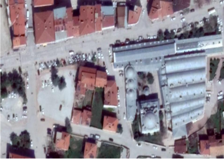
Görsel 4. Ilgın Lala Mustafa Paşa Kervansarayı Koruma Alanının 28 Mart 2018 Tarihli Görüntüsü

Koruma alanında, Görsel 4'te görüldüğü üzere sinema ve kültür binasının ortadan kaldırılması sonucu boş kalan alan ile mülkiyeti Vakıflar Genel Müdürlüğüne ait 132 ada, 6 nolu parselde bulunan Lala Mustafa Paşa Külliyesi arasında sivil yerleşime ait yapılar ortada kalmıştır. Bu yapıların da 20 Eylül 2022 tarihinde çekilmiş olan tepe görüntüsüne kadar varlıklarını sürdürdükleri, ancak 26 Şubat 2023 tarihinde çekilmiş görüntüde ise tamamının yıkılıp ortadan kaldırıldıkları görülmektedir. Muhtemelen 2022 yılının aralık ayına kadar geçen üç aylık süreçte yıkım işlemi gerçekleştirilip, alan tamamen boş bir hale getirilmiştir. Sivil yerleşime ait binaların inşasından önce bu alanda da geçmişte taşınmaz kültür varlıklarının bulunabileceği, ancak bilinçsizce ortadan kaldırılmış olma ihtimalinin oldukça yüksek olduğunu düşünmekteyiz.