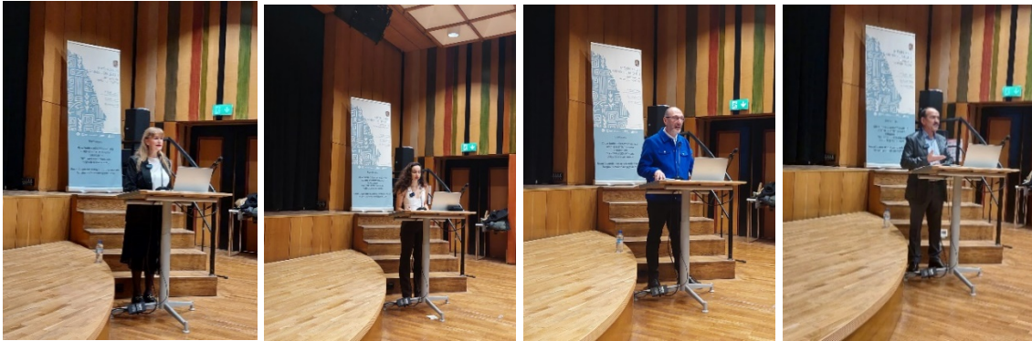
Fotoğraf 10. 11. 12. 13. Goethe-Institut Ankara’da sunum yapan katılımcılar