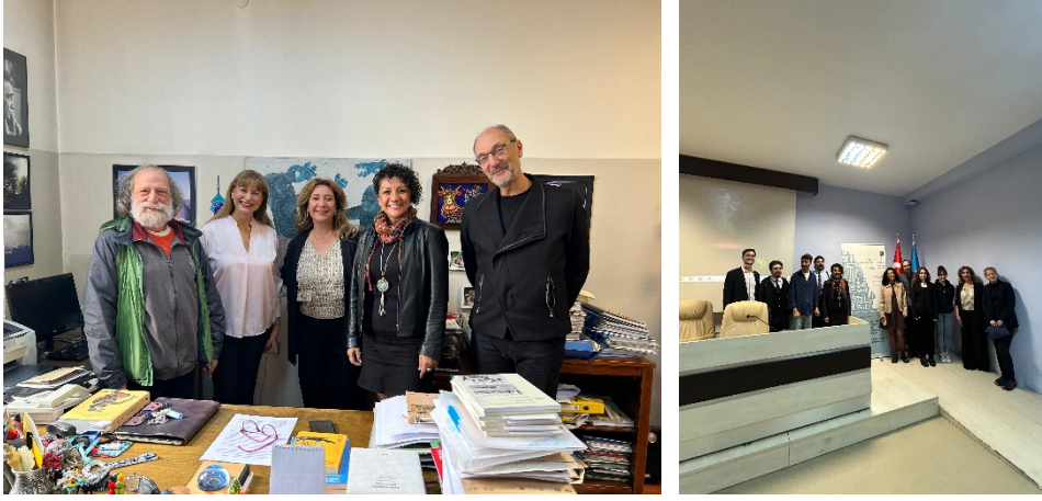
Fotoğraf 8. 9. DTCF’de etkinliğe katkı sağlayan akademisyenler ve öğrencilerle anı fotoğrafları

ile toplumsal ritüeller arasındaki bağı ortaya çıkarmaktadır” diyen Yılmaz sunumunda, Anadolu’nun dönemsel kutlama ve törenlerindeki yarışma, oyun, eğlence, dans, dram ile güldürü unsurlarının da Türk halk tiyatrosunun temellerini oluşturduğu fikrinden hareketle dünya literatüründe Türk gölge oyunu olarak bilinen ve 2009 yılında “İnsanlığın Somut Olmayan Kültürel Mirası Temsilî Listesi”ne kaydedilen Karagöz sanatının kâr-ı kadim oyunlarını Dionisos ve toplumsal ritüeller açısından değerlendirmiştir.