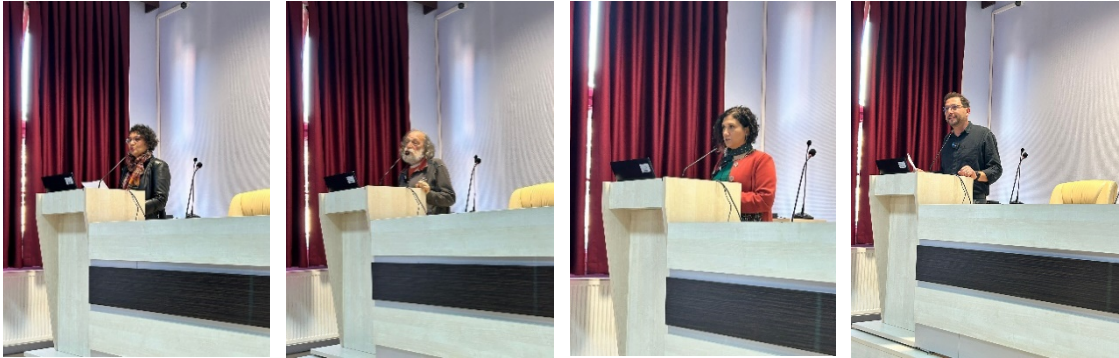
Fotoğraf 4. 5. 6. 7. DTCF’de sunumlarını gerçekleştiren akademisyenler